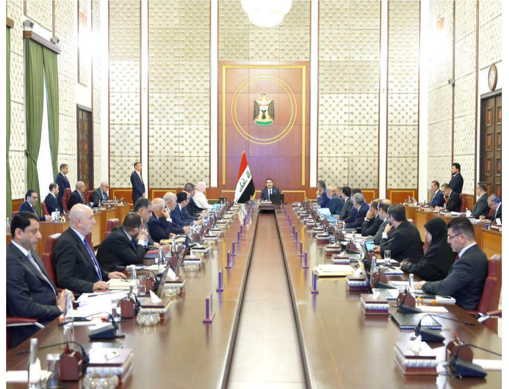
مناقشة : مجلس الوزراء يناقش قضايا عدة

وفي ملف الطاقة، جرى إقرار توصية الرياضى، وبهدف مسؤازرة رحلة منتخبنا الوطني في بطولة كأس اسيا التي ستنتقل الشهر المقبل في قطر، وجه السيد رئيس مجلس الوزراء وزارة النقل بتسيير رحلات جوية مخفضة للعراقيين الراغبين بحضور البطولة، ممن لديهم البطاقات الرسمية المعتمدة من قبل اللجنة المنظمة، كما وجه وزارة الخارجية للتواصل مع الجانب القطري من أجل تسهيل حصول تاشيرات دخولهم. وفي سياق الجلسة، وافق مجلس الوزراء على تمليك العوائل المهجرة والنازحة من منطقة (صين) في محافظة البصرة، البالغ عددها (250) عائلة، الاراضي المخصصة لهم سابقا خارج حدود بلدية البصرة بالسعر الحقيقي، استثناء من إجراءات الزيادة العنقنية المنصوص عليها في قانون بيع وإيجار اموال الدولة 21 لسنة 2013 المعدل.