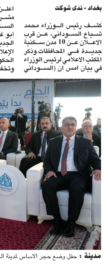
مدينة : حفل وضع حجر الأساس لمدينة الجواهري في ابي غريب

اعلن عن إطلاق العمل في مشروع مدينة الجواهري السكنية الجديدة، في قضاء أبو غريب، أحد مشاريع المدن الجديدة الخمس، التي تم الإعلان عنها ضمن ستراتيجية الحكومة لمعالجة أزمة السكن، وتخفيف الاحتفاظ عن مراكز المدن الكبرى) واكد خلال حفل اقيم بالمناسبة، حضره عدد من الوزراء و أعضاء فريق تنفيذ المدن الجديدة، وأفراد من عائلة الشاعر الكبير الراحل محمد مهدي الجواهري، فضلاً عن ممثلي الشركات الصينية، والعراقية المشتركة بالتنفيذ، (الحكومة شخصت، منذ بداية مهامها، الخلل في أزمة السكن، وأعدت خططا مدروسة لمعالجتها، انطوت على تشييد مدن سكنية متكاملة، وليست مجمعات، واختيار مواقع لها على أطراف بغداد والمحافظات، بعيدا عن مناطق الاحتفاظ).