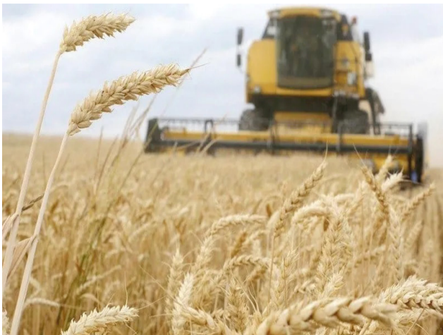
زراعة : الحنطة والشعير يعتدنان على الزراعة الديمة

معظم مناطق المملكة، من يوم غد الثلاثاء حتى يوم السبت المقبل، وأوضحت ان منطقة مكة المكرمة ستتناثر بأمطار متوسطة إلى غزيرة قد تؤدي إلى جريان السيول وتساقط البرد ورياح هابطة شديدة السرعة مثيرة للأتربة والغبار لتشمل العاصمة المقدسة وجدة والجموم والكامل وخليص والطائف وميسان وأضم والعرضيات ورايح وبحرة واللبث، ومنطقة الرياض تشمل عفيف والدوادمي والقويعية والزلفي والعاظ وشقراء والجمعة، ومناطق المدينة المنورة وحائل والقصيم وتبوك والجوف والحدود الشمالية والشرقية، ويتوقع هطول أمطار متوسطة ورياح هابطة نشطة السرعة مثيرة للأتربة والغبار على منطقة مكة المكرمة لتشمل تربة والمويه والخزعة ورنبة والقنفذة، ومناطق تبوك والباحة، وأشادت المديرية إلى أنه يتوقع هطول أمطار متوسطة إلى خفيفة ورياح هابطة نشطة السرعة مثيرة للأتربة والغبار على منطقة الرياض، وتشمل الرياض العاصمة ورياح وشقراء وممرات والمزاحمية والحريق وحوطة بني تميم والخرج، ومناطق الشرقية وعسير.