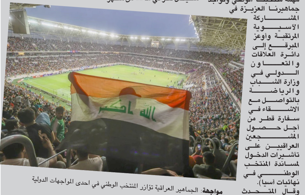
مواجهة: الجماهير العراقية توارز المنتخب الوطني في احدى المواجهات الدولية