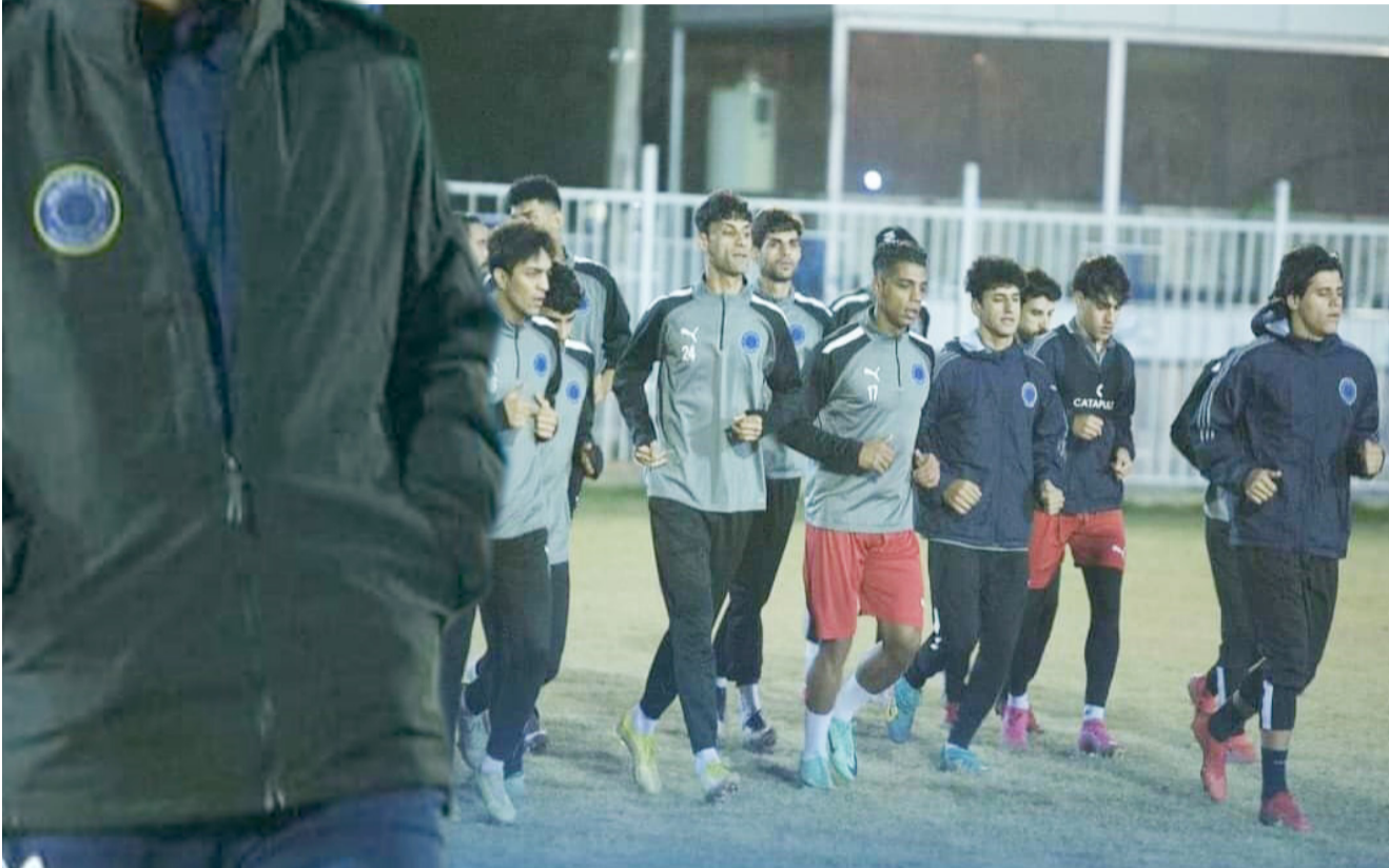
تدريبات: فريق الطلبة يجري تدريباته استعداداً للجولة القادمة

يواصل زاخو في أفضل حالاته ومعنوياته بالفوز على الكهرياء الذي استرد عافيته مؤخراً ويواصل نطقه ليسان مدعوماً بجمهوره العودة ليسان الانتصارات على حساب اربيل التراجع وسيكون النصف امام الاختبار الصعب الخامس الجنوب 5 ويحاول متبذل المجموعة ميسان بنقطة الخروج من نوامة التراجع في ملعبه وذلك بتحقيق النتيجة المطلوبة امام الشرايط الثامن الساعي العودة بالفوز الثاني توالبا بعد تغلبة على الناصرية الاسبوع الماضي ويريد الفهد 3 دعم فوزة الحول على ضيفه عك 3 ويخرج فريق الحنين السابع 4مواجهه التاسع بيشركة السليمانية 3. يطلع الوصيف فريق الناصرية 6 مدعوماً بجمهوره الكبير التي استعادة توازنه بعد خسارة الشرايط الدور الماضي والعودة للصدارة على حساب ضيفه الكرامة 8 متصدر المجموعة الاولى في افتتاح مباريات الجولة الخامسة للدوري المحتان لكرة القدم غد الجمعة ملعب الشطرة لكنها مهمة ليست