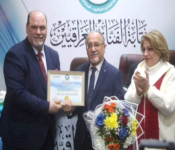
احتفاء: لقطات من جلسة الاحتفاء، بإسنادة معهد الفنون الجميلة