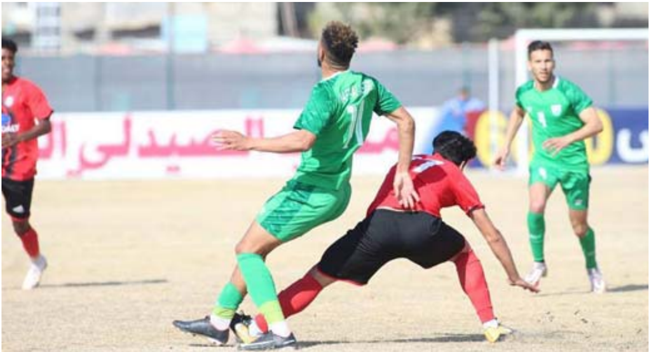
هبوط : فريق سامراء يهبط الى الدرجة الاولى بعد مشاركة مخيبة

التي أخذت الفريق ثم المدرب الرابع الذي لم يكن بإمكانه فعل شيء للفريق الذي استسلم تماماً وانتهت الأمور ولم يطرأ في وقته أي تحسن أمام استمرار مشاكل النتائج وكان الفريق لم يشارك قبل ان تطيح به بالنهاية ان تزداد المهمة تعقيداً وصعوبة ولم تأتي محاولة تذكر للحد من مسلسل الهزائم التي كانت كافية ان تلزمه على المغادرة السريعة من الباب الضيق بأسوء طريقة للمشاركة وحتى ان اقتضت المشاركة لبعض المستلزمات لا يمكن ان تأتي بالطريقة التي انتهت عندها للفريق الذي لم يبدأ للحد الأدنى للمنافسة كما يجب واثبت من البداية انه غير قادر على اللعب وأفضل الخبايا والخروج مبكراً وقد لا يعود بعد أمام نظام دوري الدرجة الاولى الذي سيقام بطريقة الدوري العام ولتتعلّم الإدارة تتخطى فريقها.