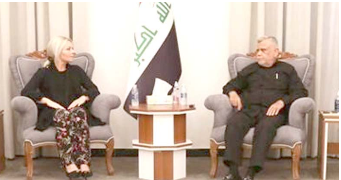
استقبال : رئيس تحالف الفتح هادي العامري يستقبل في بغداد ممثلة الامين العام للامم المتحدة جنين بلاسخارت

بالخبث، ولكي لا اغذي فساركم بدماء العراقيين الذين راح الكثير منهم ضحية لفسادكم وشهوآتمك ولكي تبقى قيادات الفساد تعبت في الأرض (الصفاء على سلميية الاحتجاجات ودماء المتظاهرين والقوات الامنية والحشد الشعبي طاعة له وحباً إليها الفاسدون، وسياستكم المعروف باسم صالح محمد العراقي، قد طالب الكتل المضوية في الإطار التنسيقي كجج جماع الثالوث الاطاري الذي وصفه بالمشؤوم، وكتب في صفحته على فيسبوك امس ان (هذا الثالوث يلعب بالنار وقد يكون من صالحه تاجيح الحزب الاهلبيية من خلال الاعتصام مقابل الاعتصام او التظاهرات مقابل التظاهرات، فينا ان ننظاهار إنما ننظاهار ضد الفاسدين، فهل هم فاسدون؟).