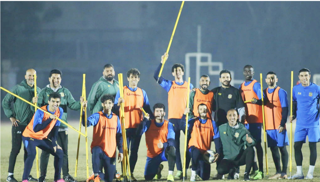
اسبوع: نجوم الامانة في الاسبوع العاشر

الناصرة- باسم الركابي يواجه الجوية الساعي لتعزيمز موقعة في صدارة دوري المحترفين لكرة القدم اختيارا ليس سهلا امام الثاني عشر الكهرباء 12 في ملعب الشعب اليوم مؤجلة من الدور الثامن ويسعى الفريق المدعوم بجمهوره الكبير للعب برغبة الفوز والحصول على كامل النقاط من اجل توسيع الفارق مع الغريم الشرطة إلى سبع نقاط من خلال قيام اللاعبين بادوارهم ومواصلة طريق النتائج ولانبات عزم اللاعبين وتصميمهم في الصراع على لقب الدوري والدفاع عن الكاس ويتعين على لاعبي الفريق الذي ظهر بداء منخفض في اخر مباراتين استعادة دورتهم وبسلوهم اذا ما ارادوا تحقيق الفوز والحفاظ على مسار النتائج بدون خسارة وقبلها تقديم بروفة ناجحة قبل الخروج للتحف السبت ولان المباريات الضاد سخونة وتحديا بوجه الفريق المطالب بعدم التوقف مع مرور الوقت ما يتطلب ان يكون اكثر استقراا من اجل تعزيم