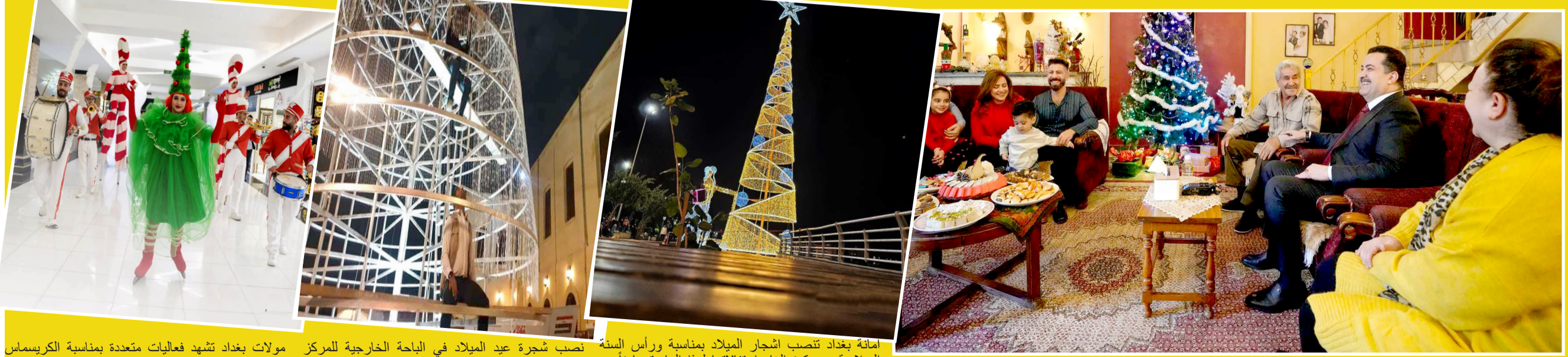
امانة بغداد تنصب أشجار الميلاد بمناسبة رأس السنة الميلادية ، مؤكدة إلغاء احتفالها لهذا العام تضامنا مع حدائفة الحدائفة وحداداً على شهداء غزة . رئيس مجلس الوزراء محمد شياع السوداني، يشارك أس من المعون المسيحي في العاصمة بغداد، الإحتفال بأعياد الميلاد المجيدة