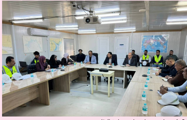
اجتماع. جانب من اجتماع بوزارة النقل