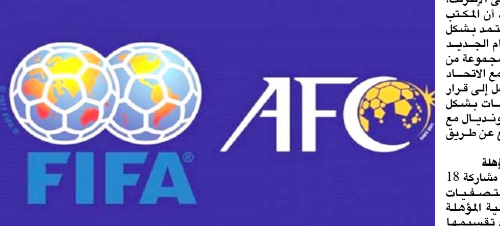
اتحاد: شعار الاتحاد الآسيوي لكرة القدم