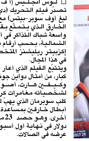
الكلب الخارق يتصدر شبك التذاكر في أمريكا

وتراجع إلى المرتبة الثالثة (فور): لاف أند فاندر) رابع أجزاء سلسلة البطل الخارق الشهير