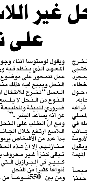
النحل غير اللاسع كنز ليس معروفا على نطاق واسع

وتنوع من أنواع النحل الواحد وبينما يباع الكيلوغرام الواحد من عسل النحلة الإفريقية