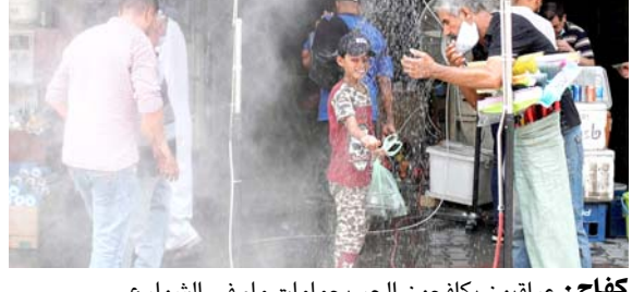
كفاح: عراقيون يكافحون الحر بحمامات ماء، في الشوارع

بمديرية تربية المحافظة في بيان أمس (استمرار الإحتجاجات العامة للساكن الإعدادي خلال ايام تعطيل الدوام الرسمي في المحافظة). في غضون ذلك، ناشد اهالي منطقة السبعية (الزمان) أمس انه (وفقا لتقرير الطاقم الدولي المؤشر بدخول مناطق جنوب العراق ووسطه الجداول الدولي لأعلى درجات حرارة مسجلة في العالم، إذانا الكهراء بالتدخل المباشر لحل أزمة الحمولات. وقال الاهالي ان (الحلول المنصوبة لا تحتمل أهمية نهب المواطنين، مراعاة ارتفاع الحرارة غير المسبوق، والترشيح باستهلاك الطاقة وإطفاء الأنارة، والاجهزة الكهربائية غير الضرورية، وتخفيف الأحمال حفاظا على اسقرارية المنظومة، حتى نتمكن من مواكبة الطلب وعدم التأخير، سلبا على ساعات التحجيز).