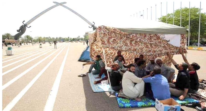
كتب الامين العام لعصائير اهل الحق قيس الزعزعي على تغريدة على تويتر (سيفي العامري شيخ الجاهدين ورفيق الشهداء وسائرنا على نبرهم في