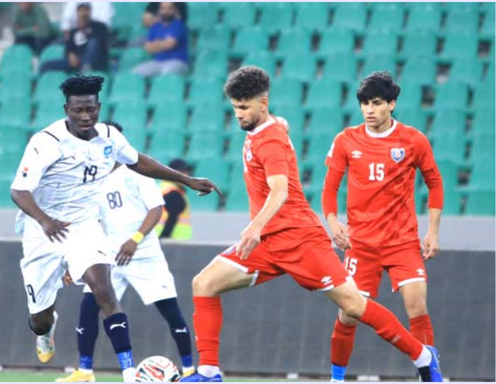
دوري: إحدى مواجهات فريق نفط البصرة في الدوري الممتاز