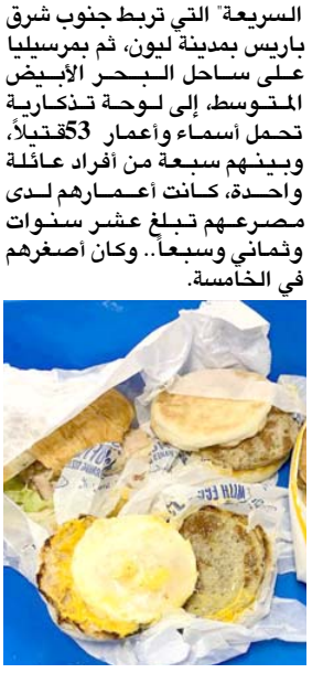
غرامة بقيمة ألفا دولار

وتعلقا على هذه الحادثة، صرح وزير الزراعة الأسترالي موراى ماكوتالندز اشتراما هذا المسافر. تطبق أستراليا سياسة صارمة في مجال الأمن الحيوي في مسعى إلى حماية قطاعها الزراعي الكبير من الآفات والأمراض. ورفعت السلطات مستوى الإنذار بعد تفشي الحمى القلاعية في إندونيسيا، فإرضة المستوردة من هذا البلد ولا تشكل هذه الحمى خطرا على الإنسان، لكنها من الأمراض الفيروسية شديدة العدوى التي تصيب المواشي. وتضاهي هذه الغرامة بقيمة البالغة 2664 دولارا أستراليا بما عن 567 شطيرة "ماكافن" في سيدني أو كلفة عدة ذئار سفر إلى باقي دولارات الأئتم المذكورة التي تحمل اليوم الأئتم المذكورة التي الاربعون للكراثة البرورية التي اسفرت عن أكبر عدد من الضحايا من المركبات على طريق سريعة في فرنسا. إذ تسبب تصادم عدد من المركبات على طريق سريعة في أحياء الجنوب في الأول من آب/أغسطس 1982 في مقتل 53 شخصا بينهم 46 طفلا، معظمهم كانوا في طريقهم إلى مخيماتهم الصيفيّة. وتعود طريق صغيرة على طول طريق الشمس السريع التي تربط جنوب شرق باريس بمدينة ليون، ثم برسيليا على ساحل البحر الأبيض المتوسط إلى لوحة تذكارية تحمل أسماء واعمار 53قُتيلًا، وبينهم سبعة من أفراد عائلة واحدة. كانت أعمالهم لدى مصرعهم تبلغ عشر سنوات في أستراليا وسبعًا، وكان اصغرهم في الخامسة.