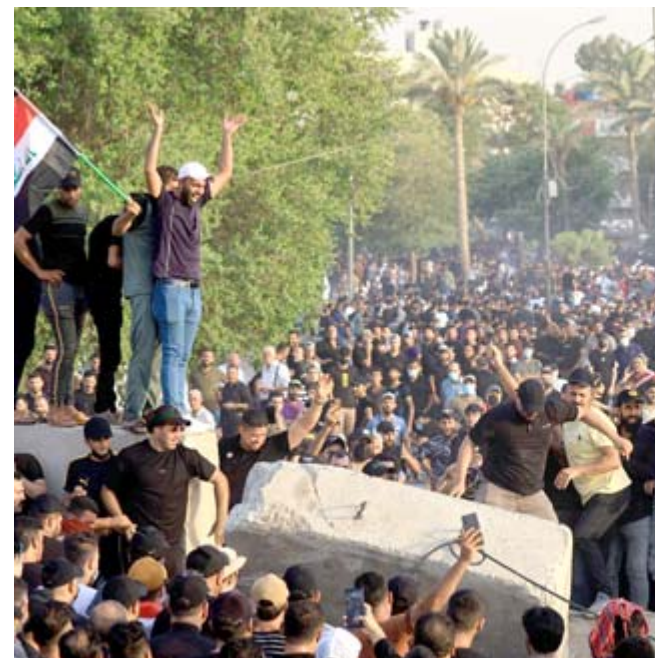
تظاهرات مؤيدي الإطّار التسنيقي يخرجون بتظاهرة مضادة للتيار الصدري

الصدر في الإطّار التسنيقي عند الحرس المعلق المؤدي إلى المنطقة الخضراء التي تضم مؤسسات حكومية ومقرات دبلوماسية غربية ومقر البرلمان. ورفع بعض المتظاهرين لافتات كتب عليها "الشعب لن يسمح بالانقلابات"، كما حملوا الأعلام العراقية ورايات إسلامية وصورا للرجعية الشيوعية العليا آية الله علي السيستاني.