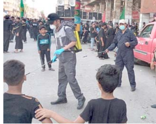
استعدادات منسوبي الدفاع المدني في واسط يستعدون لحظة لزيارة عاشوراء.

في مدينة الكاظمية، في حال حدوث اي امر طارئ حفاظاً على ارواح الزائرين. وفي وقت سابق، دعت هيئة الإعلام والاتصالات، المؤسسات الإعلامية إلى الإلتزام بأربعة اجراءات تزامناً مع حلول شهر محرم.