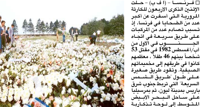
إستذكار أسوأ حادث مروري في تاريخ فرنسا

□ فرنسا- (أ ف ب) - حلت الإثنى الذكرى الاربعون للكراثة البرورية التي اسفرت عن أكبر عدد من الضحايا في فرنسا، إذ تسبب تصادم عدد من المركبات على طريق سريعة في اتجاه الجنوب في الأول من آب/أغسطس 1982 في مقتل 53 شخصاً بينهم 46 طفلاً. معظمهم كانوا في طريقهم إلى مخيماتهم الصيفيّة. وتعود طريق صغيرة على طول طريق الشمس السريع التي تربط جنوب شرق باريس بمدينة ليون، ثم برسيليا على ساحل البحر الأبيض المتوسط إلى لوحة تذكارية تحمل أسماء واعمار 53قُتيلًا، وبينهم سبعة من أفراد عائلة واحدة. كانت أعمالهم لدى مصرعهم تبلغ عشر سنوات في أستراليا وسبعًا، وكان اصغرهم في الخامسة. واحتلت صور الصغار يومها الصفحات الأولى للصحف الفرنسية. ووقع الحادث ليل السبت 31أغسطس/يوليو إلى الأول من آب/أغسطس، عندما كانت حافظتان تجهان من كربيي أن فالوا، الواقعة إلى شمال شرق باريس، إلى مخيم صيفي في سافوا، بجبال الالب الفرنسية، حاملتين 107 طفلاً من عائلات معوزة كان معظمهم سيمحيه امامه، تاخر رد فعله، فاصطدمت العلة الأولى في حياته.