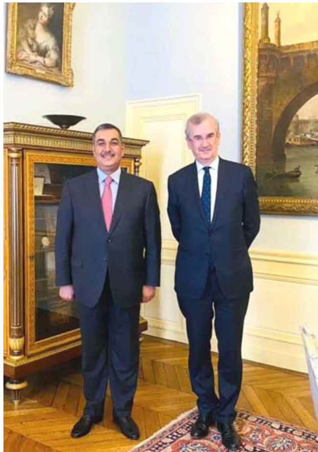
لقاء محافظ البنك المركزي خلال لقائه نظيره الفرنسي في باريس

شروط وضوابط وضعت، حيث بإمكان زبائن المصرف زيارة فروعها في بغداد والمحافظات لمشاريعهم الخاصة). على صعيد متصل، أحصى مصرف الرافدين، عدد الحسابات المفتوحة للقطاعات كافة في فروعها ببغداد والمحافظات خلال شهر حزيران الماضي.