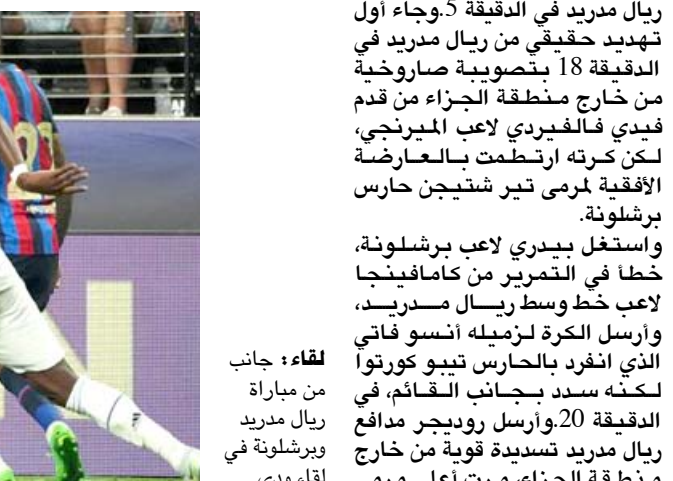
لقاء: جانب من مباراة ريال مدريد وبرشلونة في لقاء ودي