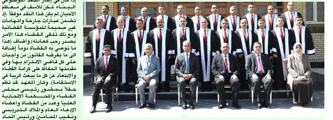
لقطة: رئيس مجلس القضاء الاعلى في لقطة مع طلبة المعهد القضائي

بغداد - الزمان قال (منصب القضاء هو مسؤولية قبل ان يكون وظيفة، لذا يجب ان فائق زيدان، القضاة على الابتعاد عن كل ما يثير الريبة في الاستقامة والعمل من اجل الحفاظ على كرامة القضاء، وقال زيدان خلال تخرج طلبة الدورة 42 في المعهد القضائي