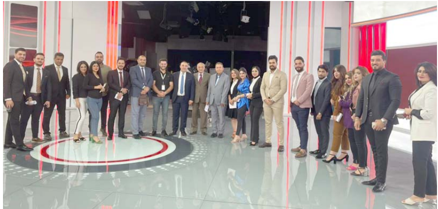
أربيل - الزمان

اختتمت أكاديمية الشرقية للإعلام امس دورة في فن الإلقاء وتقديم الأخبار والبرامج الحوارية في سبتوديو 7 بمحافظة أربيل بتخريج دفعة جديدة من المتدربين القادمين من المحافظات العراقية والدول العربية. وكانت الأكاديمية قد أقامت سلسلة من الدورات في أربيل. فيما تضمنت هذه الدورة التي استمرت لمدة من 20 إلى 24 تموز الجاري، تدريبات مكثفة في مجال الإعلام التلفزيوني.