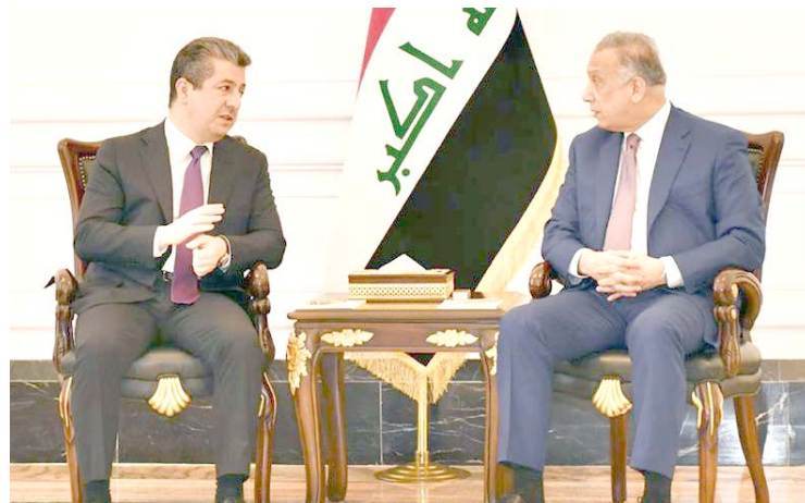
لقاء: رئيسا حكومة إقليم كردستان خلال لقاء جمعهما في بغداد

وأشار البيان أن (اللقاء بحث العلاقات الثنائية بين البلدين وسبل تعزيزها والتعاون في المجالات السياسية والاقتصادية والثقافية، والتسسيق في مختلف القطاعات بما يحقق المصالح المشتركة، إلى جانب المشاركة الفاعلة للعراق في القمة العربية، كما جرى التطرق إلى القضايا العربية والإقليمية والدولية ذات الأهمية المشتركة، حيث جرى التأكيد على أهمية التنسيق المشترك لتخفيف توترات المنطقة وإنهاء الأزمات القائمة).