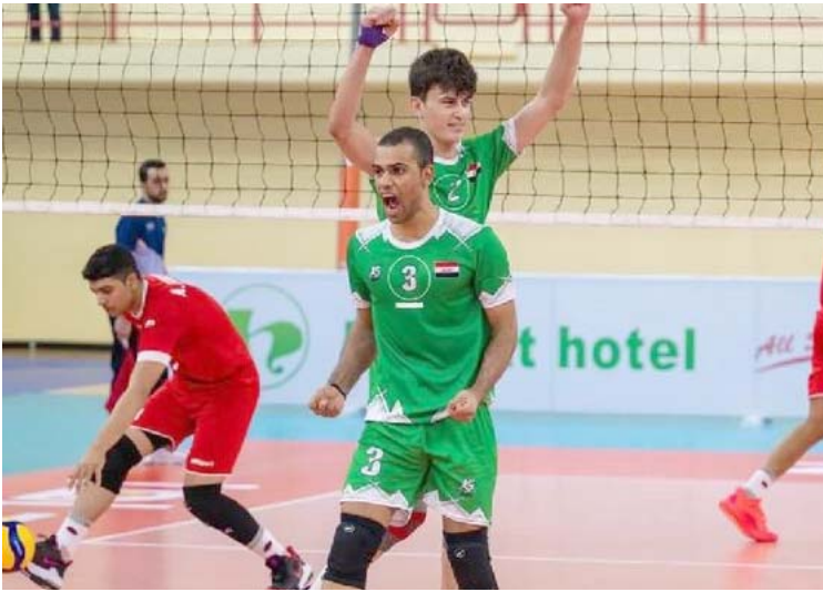
طائرة: مباراة العراق والبحرين بكرة الطائرة

بغداد- الزمان خسر منتخب شباب العراق الوطني لكرة الطائرة أمام منتخب البحرين 3-1 في مسنهل مشواره ببطولة غرب آسيا للشباب التي انطلقت اليوم في مدينة الدمام السعودية. وقلب البحرين الطاولة على منتخب العراق الشبابي وانهي اللقاء لصالحه بثلاثة اشواط مقابل شوط واحد في انطلاق منافسات غرب آسيا. الشوط الاول كان عراقياً 23-25 من قبل المنتخب البحريني الكفة بحسبه الشوط الثاني لصالحه 20-25 ليحسم بعدها منتخب البحرين الشوط الثاني ثم الثالث بفارق بسيط 25-22. وكان وفد منتخب شباب العراق لكرة الطائرة، غادر اول أمس الأربعاء، العاصمة الإيرانية طهران، متجهاً صوب مدينة الدمام السعودية بعد اكمال معسكره التدريبي، للمشاركة في بطولة إتحاد غرب آسيا التي ستعقد منافساتها اليوم الجمعة. الجدير بالذكر أن منتخب شباب العراق اوقعت القرعة في المجموعة الاولى إلى جانب كل من منتخبات البحرين والأردن والإمارات ولبنان.