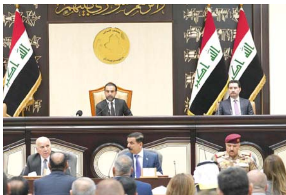
جلسة: رئيس البرلمان لدى ترؤسه جلسة طارئة بحضور وزير الدفاع والخارجية

وجه مجلس النواب، بتشكيل لجنة مشتركة للتحقيق مع اللجنة المشكّلة من قبل الحكومة، بتقصي حقائق إستهداف مصيف بزخ في زاخو بمحافظة دهوك، الذي أسفر عن إستشهاد وإصابة عدد من المدنيين، وسط دعوات إلى إخراج قوات حزب العمال الكردستاني من الأراضي العراقية. وقال بيان تلقته (الزمان) أمس أن (رئيس البرلمان محمد الحليوسي