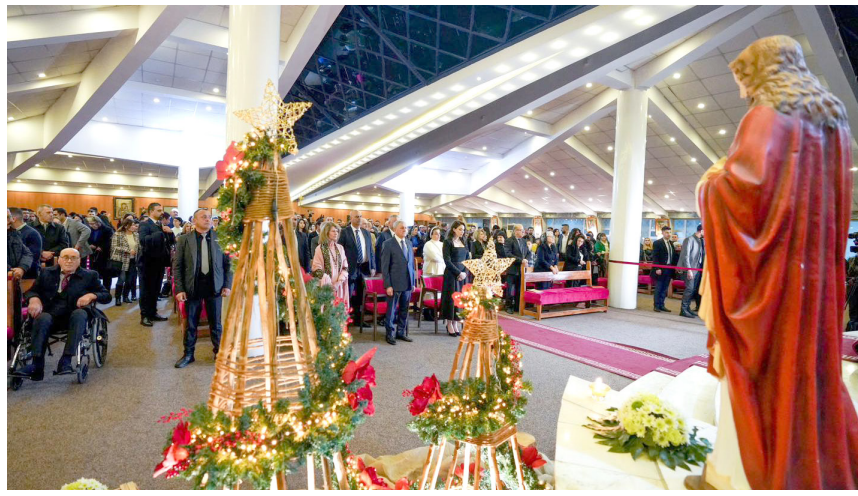
قداس : رئيس الجمهورية يحضر قداس أقيم في كنيسة مار يوسف بالسليمانية بمناسبة أعياد الميلاد المجيد

رئيس الوزراء محمد شياع السوداني، امس الاثنين، زيارة إلى أسر من أبناء الكون المسيحي في بغداد، وشاركها الإحتفال بأعياد الميلاد الجديدة، مقدماً التهنية لجميع أبناء الشعب العراقي عامة، والمسيحيين خاصة بهذه المناسبة المباركة. ونقل بيان عن السوداني قوله إن (المسيحيين هم ملح الأرض، ومكون أصيل في بلدنا وشعبنا، وأسهموا في بناء الدولة، مؤكداً أن وجود المسيحيين في العراق هو عامل قوة للبلد، معبراً عن اعترازه بجميع أطياف الشعب العراقي). وأكد السوداني أن (الحكومة حريصة على التواصل مع جميع الكوّنات في العراق، وخصوصاً أبناء شعبنا في المسيحيين للمشاركة في إحتفالاتهم بهذه المناسبة الكريمة)، مشيراً إلى (حضوره قداس الميلاد الفلسطيني في غزة).