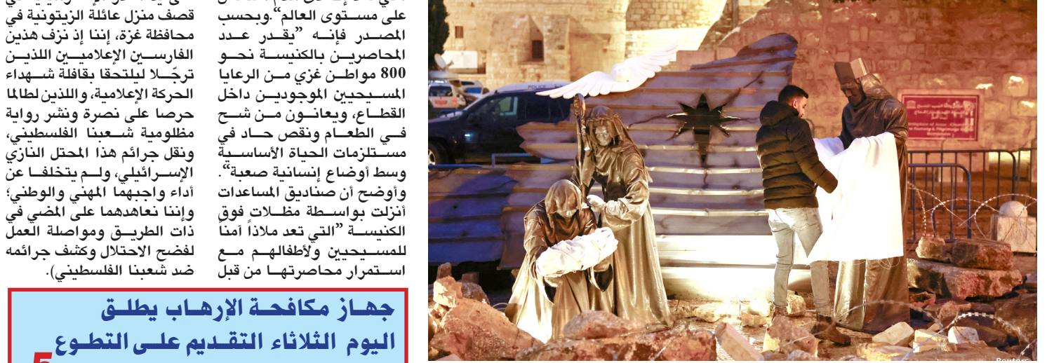
إحتفالات : كنائس بيت لحم تخلو من الإحتفالات المعتادة كل عام بسبب أحداث غزة

بغداد - ابتهاج العربي تجاوزت الإيرادات المالية المتحققة خلال الشهر الماضي للنفط مليار دولار، وفق الإحصائية النهائية للكميات المصدرة من النفط الخام، بحسب وزارة النفط وقال بيان (مجموع) ان (مجموع الصادرات النفطية والإيرادات المتحققة لشهر تشرين الثاني الماضي، والصادرة من شركة تسويق النفط العراقية سومو، بلغت 102 مليوناً و 975 ألف و 782 برميل، بإيرادات بلغت ثمانية مليارات و 481 مليوناً و 558 ألف دولار)، مشيراً إلى (مجموع الكميات المصدرة من النفط الخام للشهر الماضي من الحقول النفطية في وسط وجنوب العراق بلغت 101 مليوناً و 764 ألف و 620 برميل، فيما كانت الكميات المصدرة من القيارة مليون و 38 ألف و 779 برميل)، وأضاف ان (الصادرات التي الى الارن بلغت 172 ألفاً و 383 برميل، وبلغ معدل سعر البرميل الواحد 82,365 ألف دولار)، مبيّناً ان (الكميات المصدرة قد تم تحميلها من قبل 33 شركة عالمية من جنسيات عدة، من موانئ البصرة وخور الزبير والعوامات الاحادية، وميناء جيهان التركي ومستودع كركوك