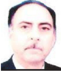
غزاي درع الطائي