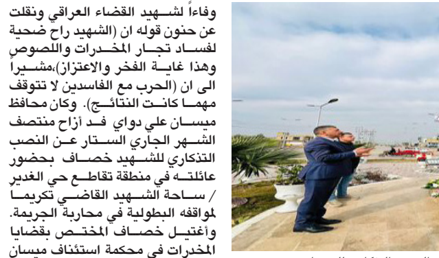
تعب : رئيس هيئة الزمامة يضع أكليل ورد على النصب التذكري للخصاف

منطقة الزعفرانية ، فيما نفذت مفاز المديرية، اوامر إلقاء القبض بحق عدد من المتهمين والطوبىين بغضبا سرقة الدرجات النارية، والمحال التجارية، والمنازل السكنية، واخرين بالتزوير، ومطوبىين بغضبا جنائية مختلفة ضمن مناطق متفرقة من بغداد، حيث تم اتخاذ الإجراءات القانونية بحقهم وتقديمهم الى القضاء ليتالوا جزاءهم العادل). وتتمكنت شرطة كركوك من إلقاء القبض على المتهم الرئيسي في حادثة الاعتداء على شاب كركوي في كركوك،والتت الاستخبارات العسكرية القبض على 14 متهمًا بغضبا قانونية مختلفة في بغداد والناظرين وبنيتي وسلاح الدين. وقال بيان امس انه (بوابات منفصلة وجهد حثيثة واستعدادا في معلومات استخباراتية دقيقة لشعب قيادة العمليات والفرق (المقر المستطير طوزخورماتو ر6 و 7 و 10 و 15 و 17) التابعة إلى مديرية