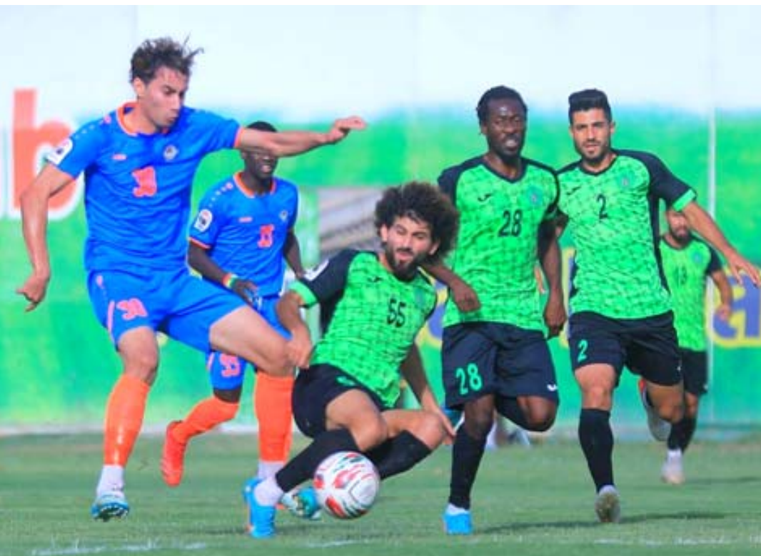
موري : احدى مواجهات فريق النقط في الدوري الممتاز