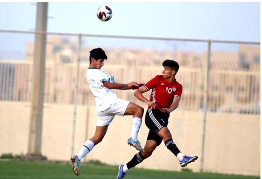
منتخب الشباب امام نظيره الليبي وديا