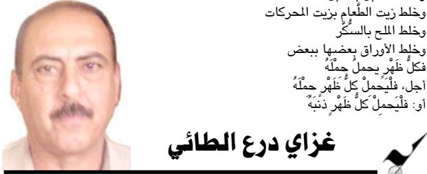
غزاي درع الطائي

لا ذنب للبقرة إذا عمد باني العليب إلى خلط حليبها بالآء . ولا ذنب للثعنة إذا عمد باني العسل إلى خلط سعلها بالسكَّر ولا ذنب لزرة الشاي إذا عمد تاجر الشاي إلى خلط شايها بنشارة الخشب وتكذلك: لا ذنب للمجموع إذا عمد صاحب الشئان إلى خلط الحليب بالآء . وخلط العسل بالسكَّر وخلط الشاي بنشارة الخشب وخلط الحابل بالنابل وخلط زرع الطعم بزيت الحركات وخلط الملح بالسكَّر وخلط الأرواق ببعضها ببعض فكلُّ ظهرٍ يحمل حملاً أجل، فليحمل كلُّ ظهرٍ حملاً أف: فليحمل كلُّ ظهرٍ ذنبه