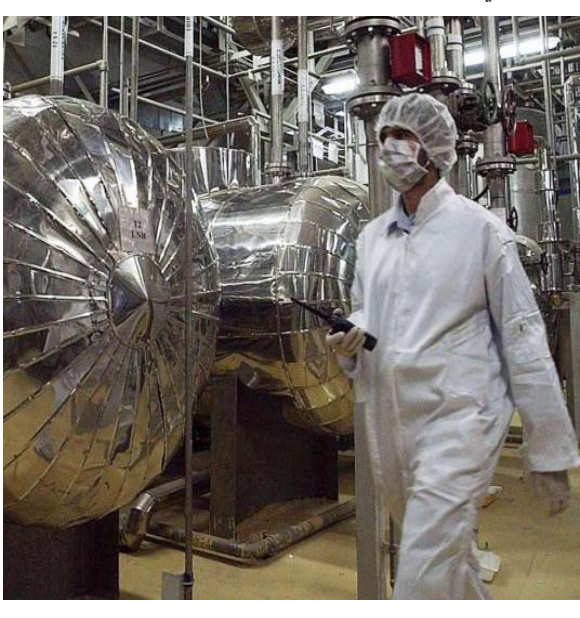
تخصيب، احدى منشآت تخصيب اليورانيوم الإيرانية

استندوا في نفي السعي للسلح النووي الى فتوى لجامعتي بشر نصها للجنة الأولى عام 2018في خضم التوتر بشأن الملف النووي، واتهام بعض الدول، في مقدمها الولايات المتحدة واسرائيل، بطهران بالعمل على قنبلة نوية. ويعتبر المرشد في فتواه المنشورة على موقعه الالكتروني، وفق ترجمتها البرنائج النووي.