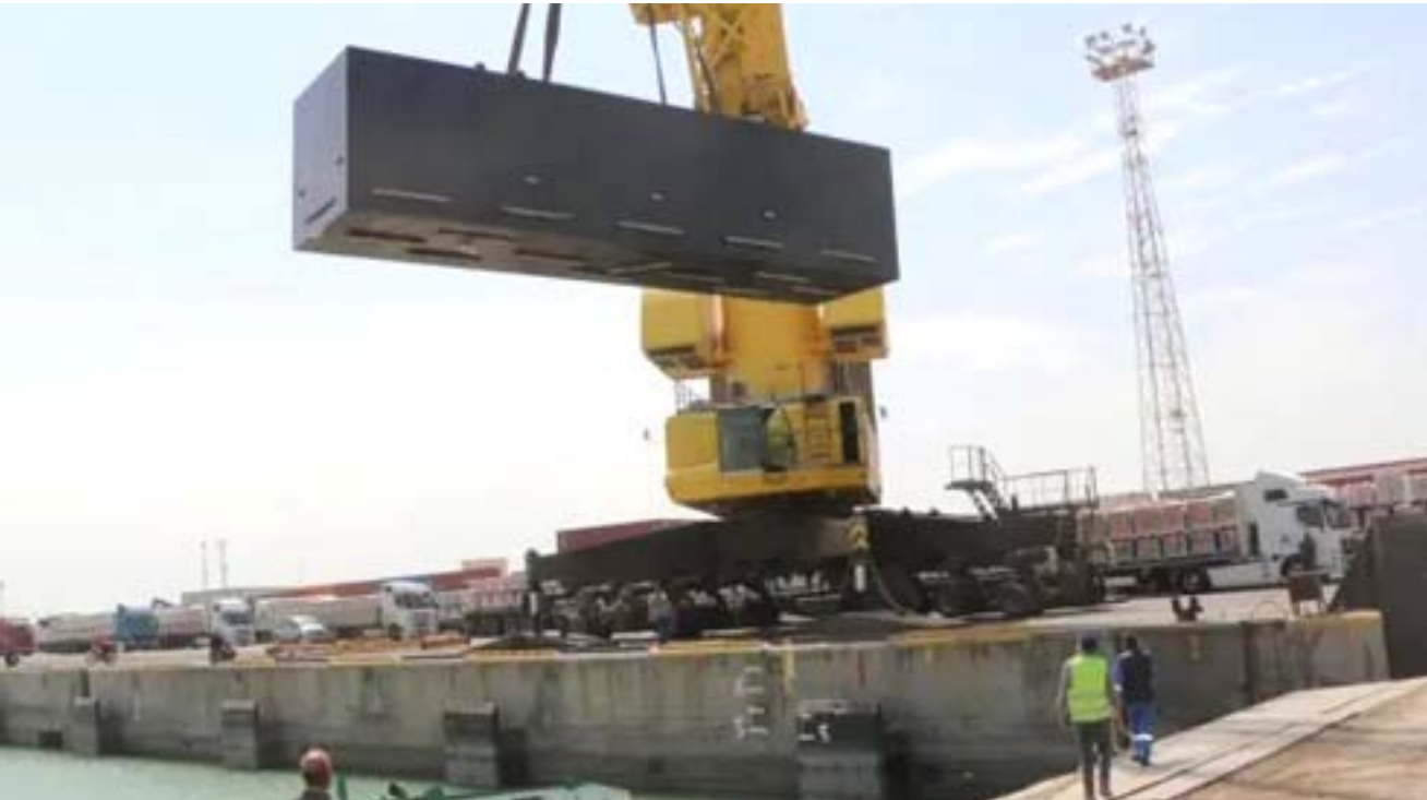
تأهيل : عمال يؤهلون ميناء أم قصر الشمالي

اسم ان (المواد مخالفة لضوابط الاستيراد، كونها تجاوزت المدة) واضاف ان (المديرية فتحت محضراً اصولياً واحالت القضية الى مركز شرطة الكمر، لإتخاذ الإجراءات القانونية بحق المخالفين).