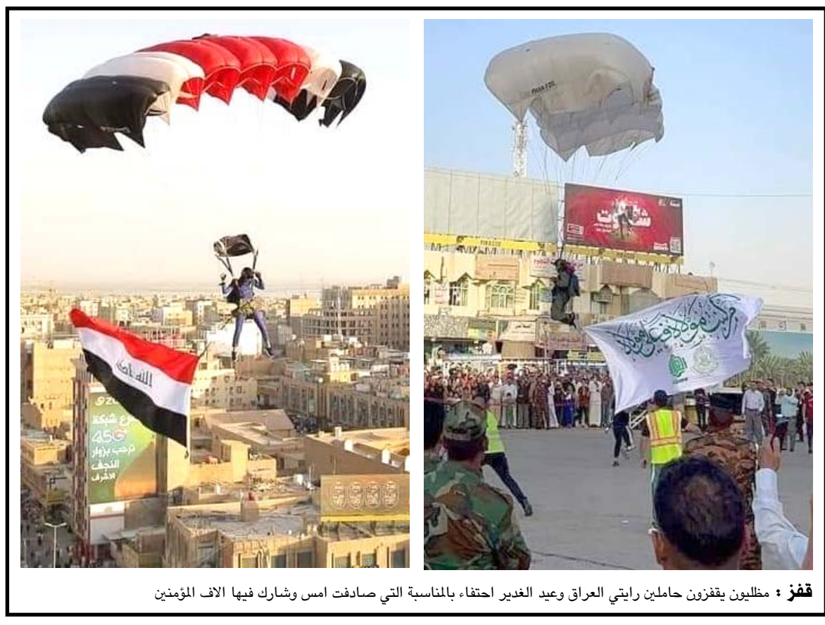
قفز : مليوني بققزون حاملين رايتي العراق وعيد الغدير احتفاء بالمناسبة التي صادفت امس وشارك فيها الاف المؤمنين

مؤكدة أن اللجنة ستعمل على اكتمال المتطلبات الخاصة بقطع الخدمة في الساعات الأولى من انطلاق الامتحانات، ورفضت الاتصالات في وقت سابق، قطع خدمة الانترنت خلال امتحانات السادس الاعداوي، وقال مدير عام العلاقات والإعلام بالوزارة عادل جبار الأعرجي في تصريح أمس إن (الوزارة بلغت خلال اجتماعها مع التربية بعدم موافقتها على قطع خدمة الانترنت خلال امتحانات السادس الاعداوي)، وأضاف ان (الوزارة لن تقطع خدمة الانترنت، إلا في حالة واحدة، وهي ورود موافقة رئيس الوزراء مصطفى الكاظمي).