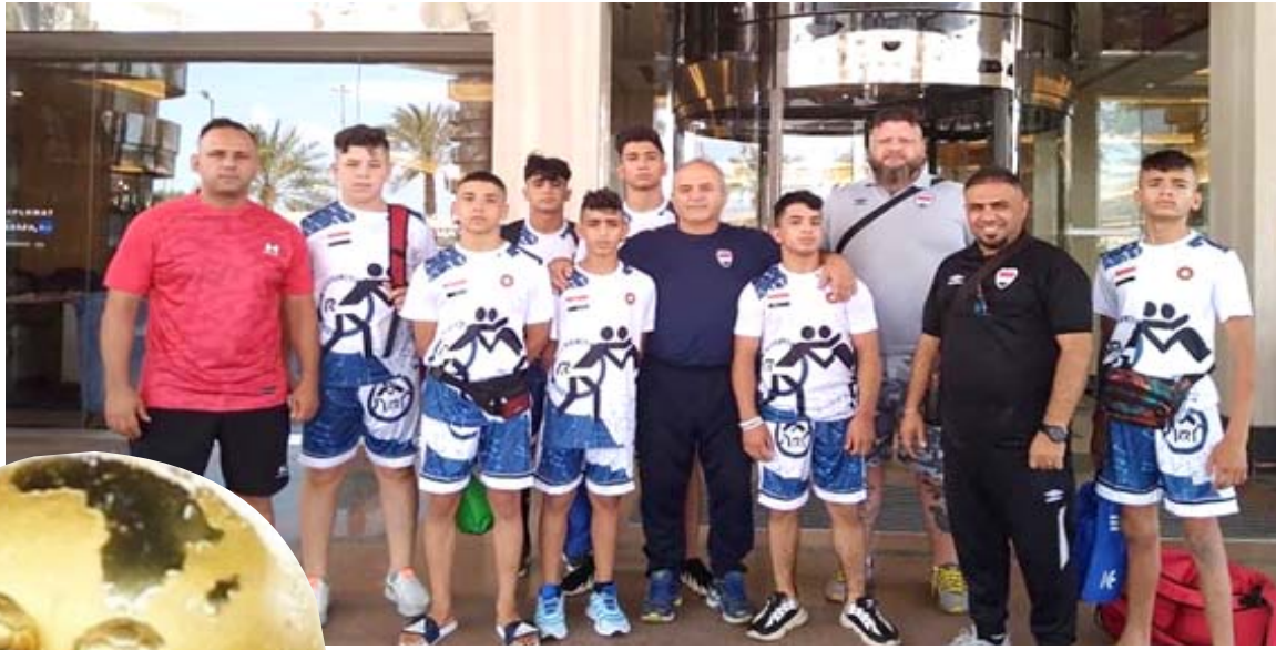
مصارعة: منتخب العراق للأحداث المصارعة المشارك في بطولة آسيا

تفادي امطار واقامت البطولة طوال عقود خلال بداية العام لتفادي الأمطار التي تهطل بغزارة على كثير من بلاد أفريقيا جنوب الصحراء، قبل أن يقرر الإتحاد الأفريقي تأجيل موعد البطولة إلى الصيف للتناقص مع الأندية الدولية. وبعد استضافة مصر بطولة 2019 خلال شهري يونيو/حزيران ويوليو/تموز، تأجلت البطولة اللاحقة في الكاميرون لتقام في فبراير/ شباط الماضي بدلاً من الموعد المفترض في صيف 2021، ويخبر إقامة البطولة في يناير وفبراير مشكلات عدة مع أندية أوروبا التي يلعب لها العديد من محترفي المنتخب الأفريقية، والتي تواجه أزمة بالتخلي عنهم خلال ذلك الوقت. فازت السنغال بالبطولة الأخيرة، للمرة الأولى في تاريخها، بعد تغلبها في النهائي على مصر بركلات الترجيح، عقب نهاية المباراة بالتعادل السلبي. من جهة أخرى، قرر الإتحاد الأفريقي إعادة النظام القديم لبطولتي دوري أبطال أفريقيا وكأس الإتحاد (الكونفيدرالية)، بحيث تقام المباراة النهائية بنظام الذهاب والإياب، بعدما أقيمت من مواجهة واحدة فاصلة على مدى ثلاث نسخ وقرر كاف إطلاق بطولة جديدة تحت مسمى دوري السوبر الأفريقي على أن تكون بدائلتها في صيف 2023 بحسب موتسيسي.