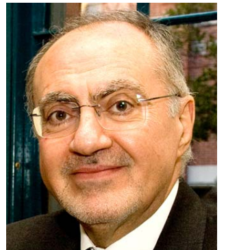
علي عبد الامير علاوي

بغداد - الزمان راي وزير المالية علي عبد الامير علاوي،ان اعادة هيكلة المصارف عاينها استحواذ القطاع الحكومي على العمل المصرفي ويتيح فرصة للقطاع الخاص المساهمة في تطوير موارد الاقتصاد،فيما اقترح البنك المركزي ، اعتماد نظام الدفعات الالكترونى ، وقال علاوي خلال معرض المالية والخدمات