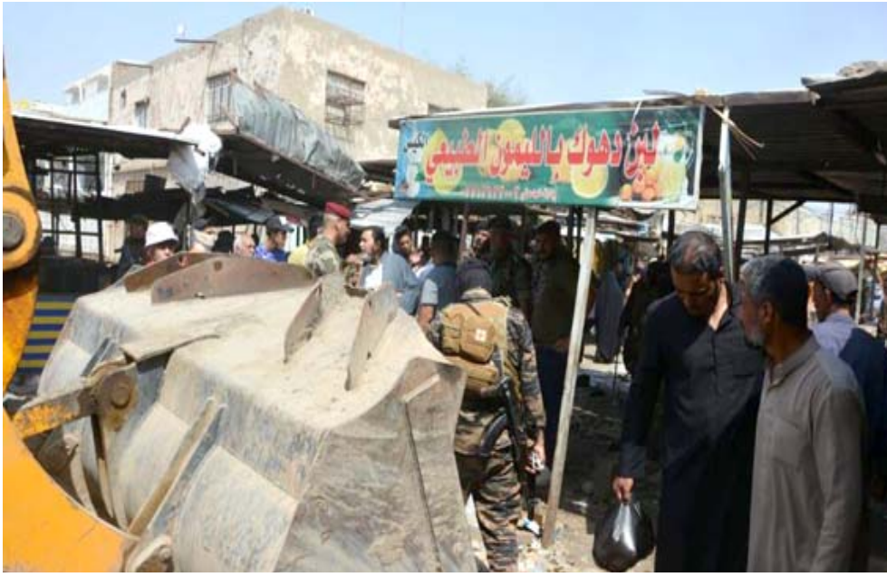
تجاوزات: فرق الامن تزيل التجاوزات في العمارة

وتحويلها الى مناطق سكنية واستثمارية، وقال الجبوري ان (مستشار رئيس الوزراء لشؤون الخدمات، أعلن موافقته على تطبيق القرار، مبيناً ان المحافظة وبلدية الموصل ستعمل على اعداد مبيناً ان (الحملة رفعت تجاوزات لمشروع اراضي الغزلاني، وتوفير الأراضي وتخصيص اخرى للمجمعات السكنية ، التي تعمل على معالجة أزمة السكن). في غضون ذلك، باشرت مديرية شرطة ميسان، برفع التجاوزات على الأرصفة والشوارع والأسواق في