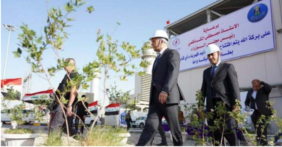
مراسم : الكاظمي خلال افتتاحه محطة كهربائية في ذي قار

هذه الدول، وقال ان (مجلس الوزراء (العمل على تطوير محطة الأتبار، ولقت في ان (الحكومة بلتت جهوداً استثنائية في استخدام الطاقة، ووضعت استراتيجية جديدة تعتمد على تطوير الكفاءة، والاستفادة من خبرات الشباب في الكهرباء، مينا