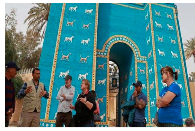
سياحة : سواح أجانب أمام بوابة عشتار في بابل