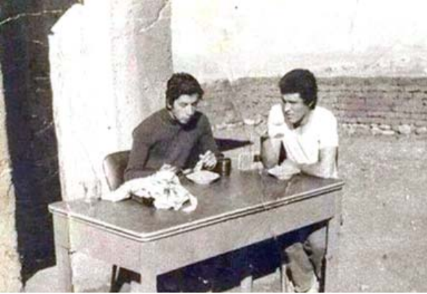
الساهر في لحظة تآدرة أثناء عمله في النشاط المدرسي