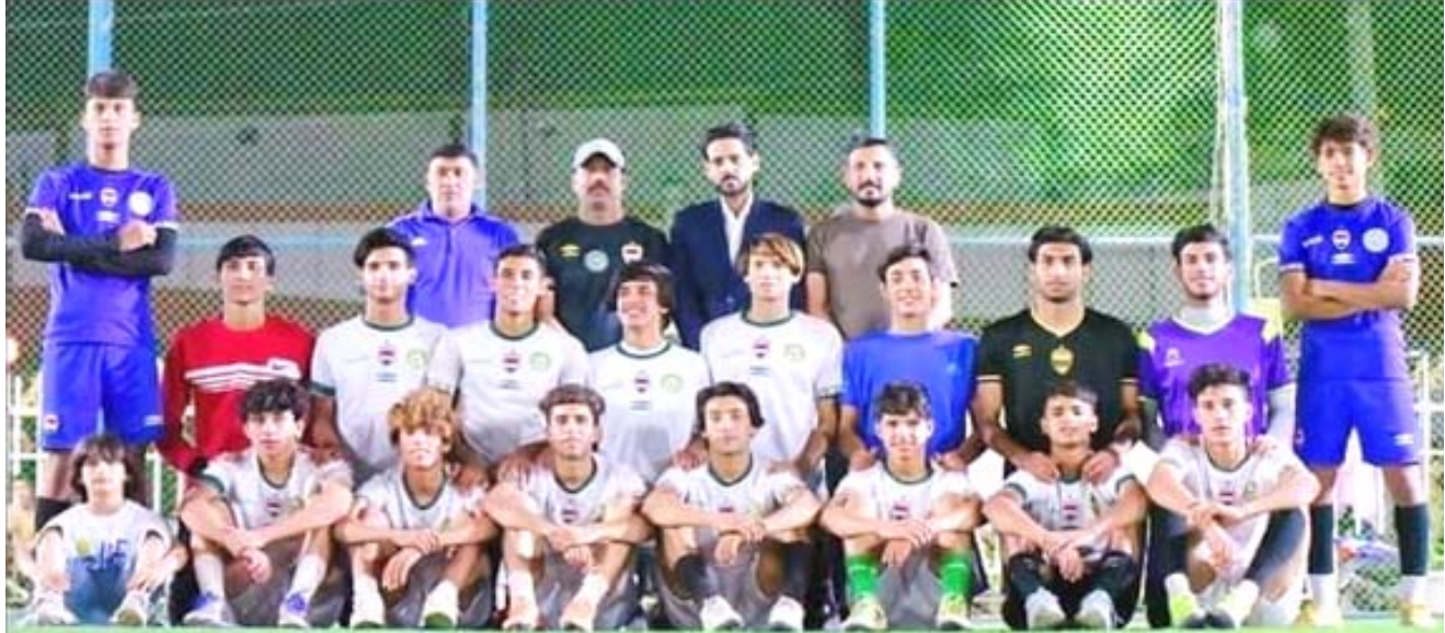
تكريم: محافظ ذي قار يكرم فريق الناصرية بعد تأهله للممتاز