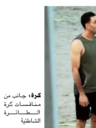
كرة: جانب من منافسات كرة الشاطئية

إلى المباراة الودية تعتبر الأولى للمنتخب الوطني ضمن المعسكر التدريبي المقام في جمهورية مصر العربية.