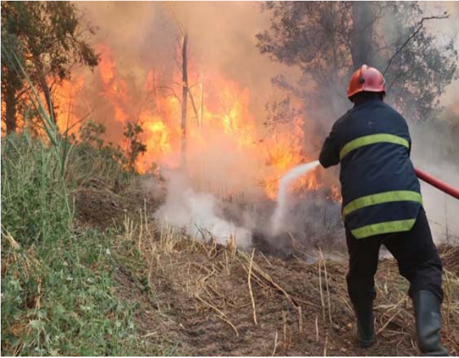
حريق: الدفاع المدني يطفى حريق غابات الموصل

الامنية والمرور والمواطنين . واثر هذا الحادث البيئي المأساوي يبادر مواطني محافظة نينوى الغيارى الى تنظيم حملة تشجير كبرى في غابات الموصل بعد الانتهاء من اطفاء الحريق ورفع الاشجار المتضررة منها . وساهمت فيها منظمات المجتمع المدني وجمعيات ومؤسسات ومشااتل ونشاط ومواطنين حيث بلغت عدد الاشجار المنزعت بها والتي ستزرع في الحمسة الاف الشتلات والكل عازم على عودة الحياة الى رثة الموصل في غاباتها الساحرة .