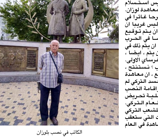
الكاتب في نصب بلوزان