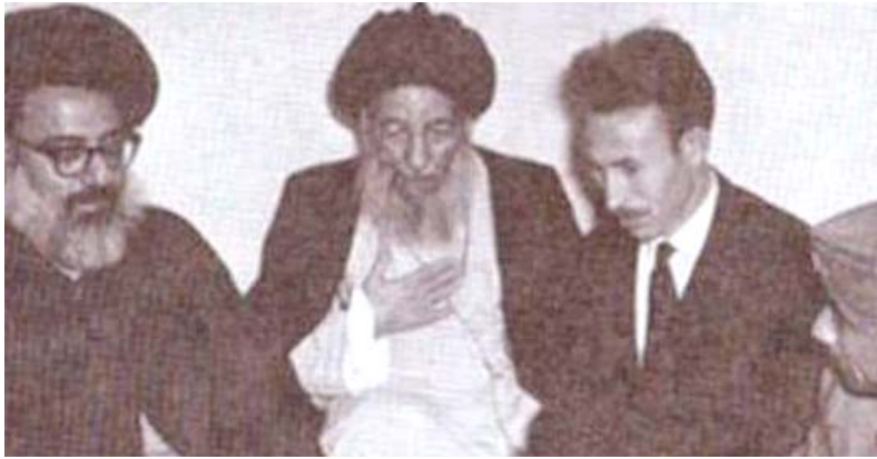
الرئيس الراحل هواري بومدين يزور المرجع الديني الاعلى السيد محسن الحكيم لتقديم شكر الجزائر على فتوى الجهاد المناصرة لشعب الجزائر