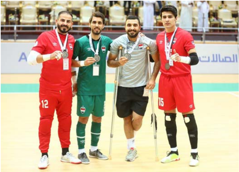
كأس: صالات العراق يحزن الميدالية الفضية في كأس العرب