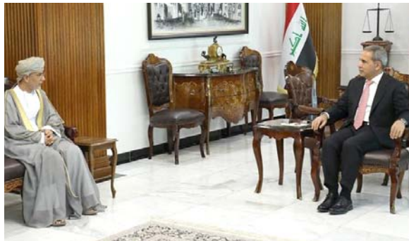
بغداد - قصي منذر

ناقش رئيس مجلس القضاء الأعلى فائق زيدان، مع السفير العماني لدى بغداد حامد بن أحمد، المقترحات الخاصة بالتعاون القضائي بين البلدين، وذكر بيان للمجلس تلقته (الزمان) أمس أن زيدان وابن أحمد بحثا خلال اللقاء الذي جمعهما في مبنى القضاء، المقترحات الخاصة بالتعاون القضائي بين البلدين. واستقبل زيدان في وقت سابق وزير العدل سالار عبد الستار، وجرى بحث معالجة إشكالية إشغال المغارات المشتركة بين المحاكم والوحدات التابعة للوزارة. وأصدرت محكمة جنابات الرصافة، حكما بإعدام متعصب طفلة في منطقة الحسينية. المغارات المشتركة بين المحاكم والوحدات التابعة للوزارة. كما قضت محكمة جنابات ميسان بالسجن 15 عاما بحق المتهم ص. ع. عن جريمة اشتراكه مع متهمين آخرين بالتخطيط وتفجير دار القاضي أحمد فيصل خفاف قبل اغتياله. وذكر البيان أن المحكمة استخدمت بحق المسؤول، فضلا عن شخصين آخرين في نفس القضية وفق أحكام المادة 340 من قانون العقوبات، مع إيقاع الحجز الاحتياطي على الأموال المنقولة وغير المنقولة لهم ومنع سفرهم، كون الجريمة واقعة على المال العام. كما تمكنت الهيئة من ضبط أجهزة طبية قاتلة عن كمنافسة، خلافا لتعليمات التعاقد.