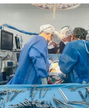
الناصرة - باسم الركابي نجحت اول عملية طبية لزراعة قلب صناعي في مركز الناصرية، وذلك للمرة الاولى في العراق والشرق الأوسط. وقال مصدر طبي في دائرة صحة ذي قار، اسس، ان (العملية جرت لمرضى من اهالي محافظة المنشي عمره ستون عاماً، اصيب مؤخراً بمرض فشل القلب)، مشيراً إلى (الاتفاق مع فريق المثني على القدوم إلى العراق في مركز الناصرية، لغرض إجراء عملية مشتركة مع فريق طبي عراقي)، وأوضح ان (زراعة القلب جرت للمرة الأولى في العراق، وذلك بعد زيارة رئيس الوزراء محمد شيان السوداني إلى المانيا، نظراً للحاجة الملحة إلى تحسين الخدمات الصحية والعلاجية في المستشفيات، وإجراء العمليات المعقدة من هذا النوع، مبيناً ان (العملية استمرت لمدة خمس ساعات)،