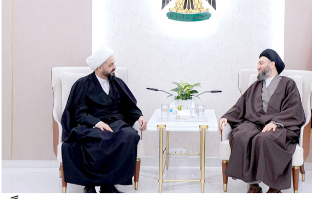
لقاء: عمار الحكيم وقيس الخزعلي خلال لقاءهما أمس

بغداد - ابتهاج العربي يقود رئيس تيار الحكمة الوطني، عمار الحكيم، حراكا بشأن تطورات المشهد السياسي والأمني، داخليا وخارجيا. فقد التقى خلال اليومين الماضيين كلاً على انفراد القائم بعمال وزير الخارجية الأمريكي، وإمين عام عصابة اهل الحق. وقال بيان اسس ان (الشيخ قيس الخزعلي، أكد اهمية تشكيل مجالس محلية وفق رؤية تنسيق مع مناهج الحكومة)، واذف الحكيم، (استقبلنا الخزعلي، وتبادلنا وجهات النظر بشأن تطورات المشهد السياسي والاستحقاقات المقبلة، وسبل دعم الحكومة في تنفيذ برنامجها وتقديم الخدمات، واثام الطرفان، بنجاح الانتخابات المحلية، فمضين (المواقف والجهود التي بذلت لإنجاحها، وعلى رأسها موقف الحكومة والمفوضية والأجهزة الامنية)، واذا (الاهمية تشكلت المجالس المحلية وفق رؤية خدمية تتسق مع مناهج الحكومة، مع ضرورة تمكين شخصيات تتسم بالكفاءة والنزاهة لإدارة المحافظات)، وعن الشأن الفلسطيني، جدد الحكيم والخزعلي الدعوة إلى وقف إطلاق النار وإنهاء المعاناة الإنسانية وفتح الممرات، مطالبين (دول العالم بتحمل مسؤوليتها تجاه ما يجري من إبادة جماعية لشعب عازل ومحاصر، غالبية من النساء والأطفال). وكانت السفارة الأمريكية لدى بغداد، أيدت رومانوسكي، قد أعلنت الاتفاق مع الحكيم على ضرورة وقف الهجمات التي تستهدف منشآت الولايات المتحدة في العراق. وأكدت في تغريدة لها على موقع اكس، ان (حادثة مهمة جرت أمس مع الحكيم والقائم بعمال نائب وزير الخارجية الأمريكية فيكتوريا تولاند، حيث اتفقا على وقف الهجمات على المنشآت الأمريكية في العراق، وزيادة المساعدات الإنسانية لشعب جريح الحفظ على السلام في جميع أنحاء المنطقة). وكان مستشار الأمن القومي قاسم الأعرجي، قد التقى عبر دائرة تلفزيونية،