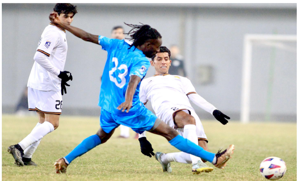
مباراة: لحظة من إحدى مباريات دوري المحترفين العراقي