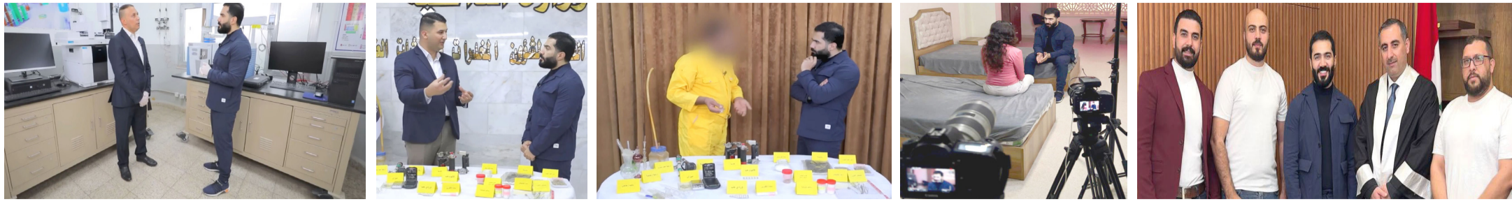
برنامج: لقطات من حلقة (كلام الناس) عن آفة المخدرات