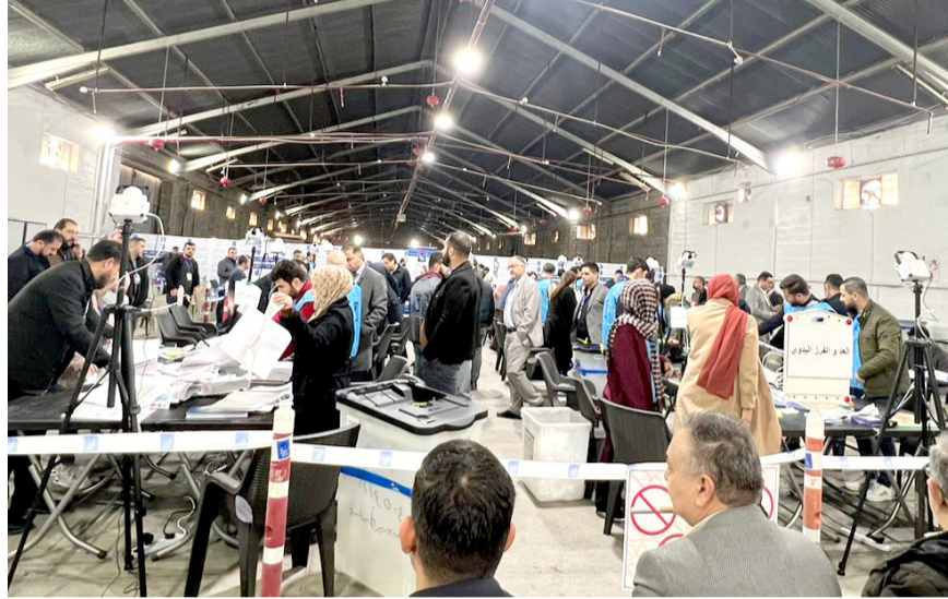
عد وفرز: موظفو مفوضية الانتخابات يواصلون عد وفرز الأصوات في المحافظات

بغداد - ندى شوكت قالت المفوضية المستقلة للانتخابات أمس أن عمليات العد والفرز اليدوي التي تجري في 16 مركزا للتطبيق بالمحافظات غير المنتظمة بإقليم والتي عددها 15 محافظة، تجري على قدم وساق، والتناوب مطابقة حتى الآن منذ بدء العملية صباح الثلاثاء، وأكدت أن السوداني أكد (خلال اللقاء، ستنتج بوقت قياسي في بعض المحطات وخاصة بمحافظة الكوفة، وإرساله وديالى ونيوى). وأعلنت المفوضية أمس عن إنجاز عملية العد والفرز في محافظات ذي قار والديوانية وميسان وابل وكركوك ودهوك واربيل، وأكدت أن (هذا الإنجاز شمل 70 محطة من أصل 116 محطة). ويبدأ توشك المفوضية على غلق هذا الملف. وفي خطوة وضعت بالمناقشة عقد الإطار التنسيقي اجتماعه الاعتيادي الإربعاء الماضي بحضور رئيس الوزراء محمد شيان السوداني لمناسبة تشكيل مجالس المحافظات وانتخاب محافظين جدد. وقال بيان أسس أن (الإطار التنسيقي عبر عن شكره للشعب العراقي الأبي الذي التزم باستحقاقه الدستوري وسامح بشكل فاعل في الإزالة بصوتها بكل حرية). وتمنّى الإطار التنسيقي الدور الذي اضطلعت به الحكومة في تنفيذ ومراقبة الانتخابات بشكل آمن والمفوضية العليا المستقلة للانتخابات على أداءها المميز والوقوف الامنية الياسنة لتأديتها دورها بأكمل وجه). وأضاف البيان أن (الاجتماع أعلن عن تشكيل كتلة الاطارات التنسيقي الابي الذي التزم بالاستحقاق وتشكيل المجالس للانتخابات لاسراع بتشكيل المجالس المحلية لتقديم الخدمات استمرارا واستكمالا