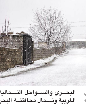
المفزة للرمال والأترية بعض مناطق القاهرة الكبرى والوجه الغربية وشمال محافظة البحر

الأحمر، والذي يؤدي إلى تدهور مستوى الرؤية الأفقية على السواحل الشمالية الشرقية ومنذ القنساء وسيناء وشمال الصعيد. وشددت على (مرضى الجيوب الأنفية وحساسية الصدر ارتداء الكمامات أثناء الخروج من المنزل)، مشيرة إلى (إمكانية سقوط الأظفار على مناطق من السواحل الشمالية الغربية وشمال الوجه البحري، تكون خفيفة على مناطق من أقصى جنوب سلال جبال البحر الأحمر).