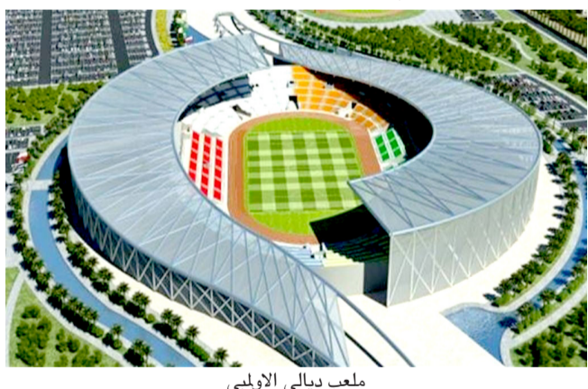
ملعب ديالى الاولمبي

ديالى - سلام الشمري اعلن وزير الشباب والرياضة احمد المبرقع، استئناف العمل بمشروع ملعب ديالى الاولمبي بقيمة 30 الف مترمربع، وذلك خلال زيارته الى محافظة ديالى برفقة عدد من السادة المسؤولين المحليين والملاك المتقدم للوزارة وجمع من رجال الاعلام والصحافة. وقال الوزير في بيان تلقته الـ (الزمان) ، ان العمل في مشروع المدينة الرياضية تم استئنافه بصورة كاملة بعد توقف دام لمدة زمنية طويلة، وبق اول ركيزة اليوم في الملعب الرئيسي سعة 30 الف مترمربع والملعب الثانوي سعة 2000 مترمربع وملعب التدريب لجميع المتابعة ستكون مستمرة لجميع التفاصيل ونامل ان يسير العمل بصورة جيدة وفقا للتوقيتات والتصاميم المعلقة . ملف الملاعب وعبر المبرقع خلال اللقاء الذي جمعه بالصحافة من المحافظة ومديرية الشباب والرياضة ان (ملف الملاعب والاعمار بنال دعم الحكومة مركزيا كجزء من اهتماماتها الكبيرة بهذا القطاع الحيوي من جانب ولتكون محافظة ديالى التي تمتاز بمواهبها الشبابية الكبيرة عند مستوى الطموح لما يحققه هذا المنشأ الكبير من اضافة مهمة ) . ويتضمن مشروع ملعب ديالى الاولمبي انشاء ملعب سعة 30 الف مترمربع مع ملاعب تدريبية عدد 2 احدهما سعة 500 مترمربع، والاخر سعة 500 مترمربع، مع فندق 4 نجوم سعة 75 سرير ويحتوي المشروع انضا على مسبح وحدائق ومواقف للسيارات، فضلا عن تاهيل مقتربات المشروع والمداخل .