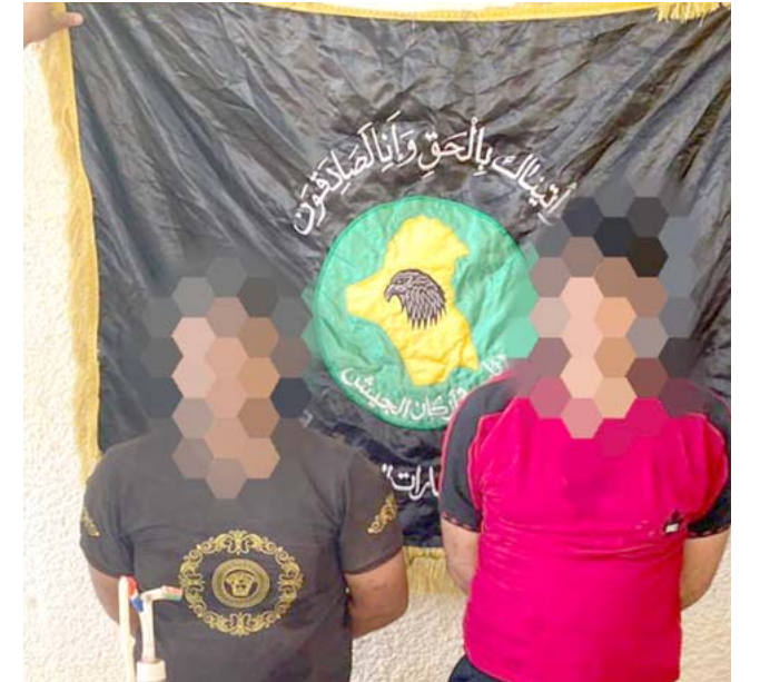
اعتقال القوات الامنية متحلق داعشيين في بغداد

بغداد - قصي منذر برغم مرور أكثر من ستة اشهر ، ما زال مصير موازنة العام الجاري المجهول بسبب تعنت الفاسدين.