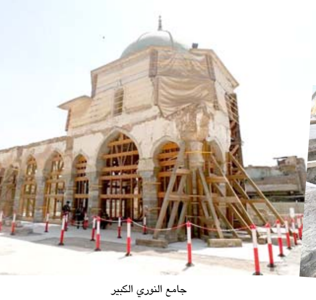
جامع النوري الكبير