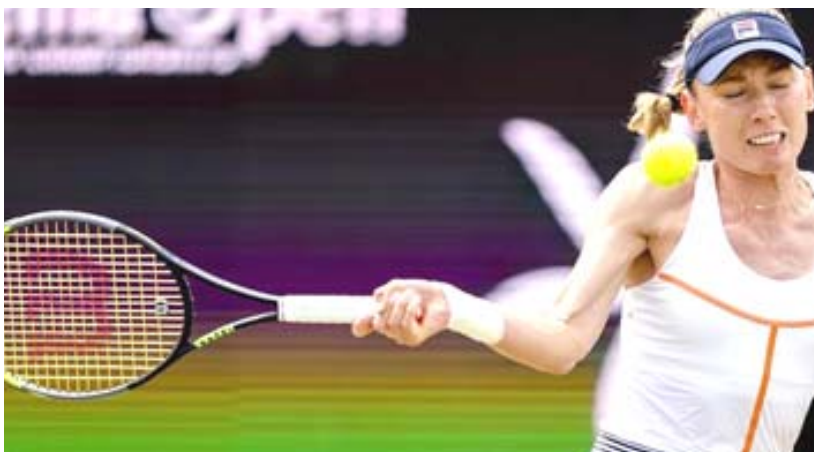
الروسية إكاترينا ألكسندروفا توجت بطلة سيراتوخيمبوس الهولندية