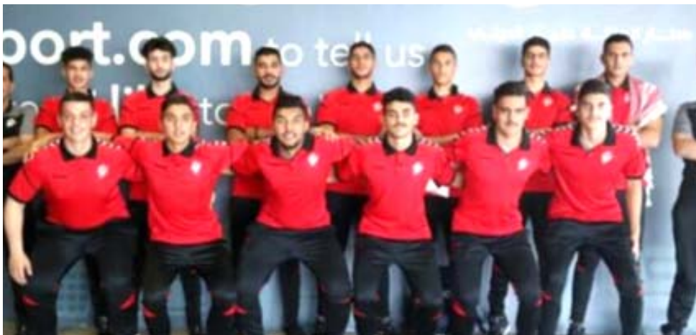
بطولة: يد الأردن الشاطئية تتوجه إلى اليونان للمشاركة بطولة العالم