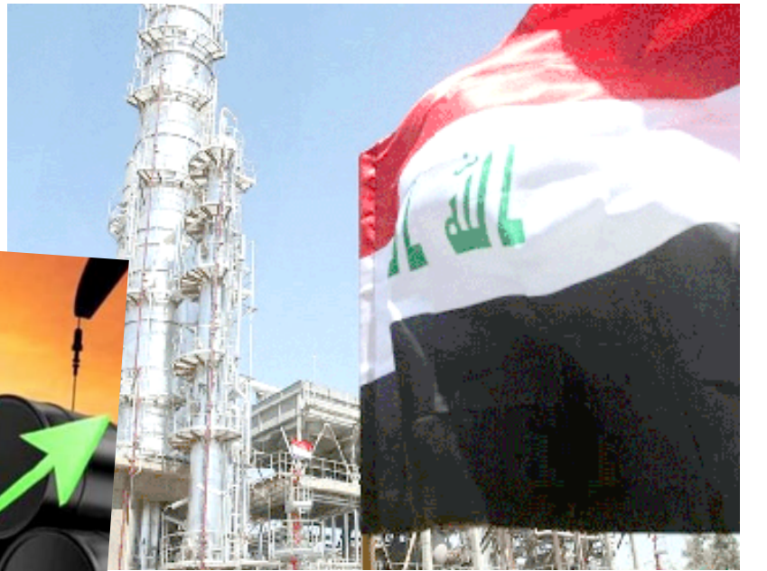
حقن نفطي عراقي

مجمع الإيرادات النفطية بلغت 45 ترليون دينار، والإيرادات غير النفطية بلغت ترليونين دينار بينما بلغت مجمل المصروفات الجارية بنحو 29.7 ترليون دينار..