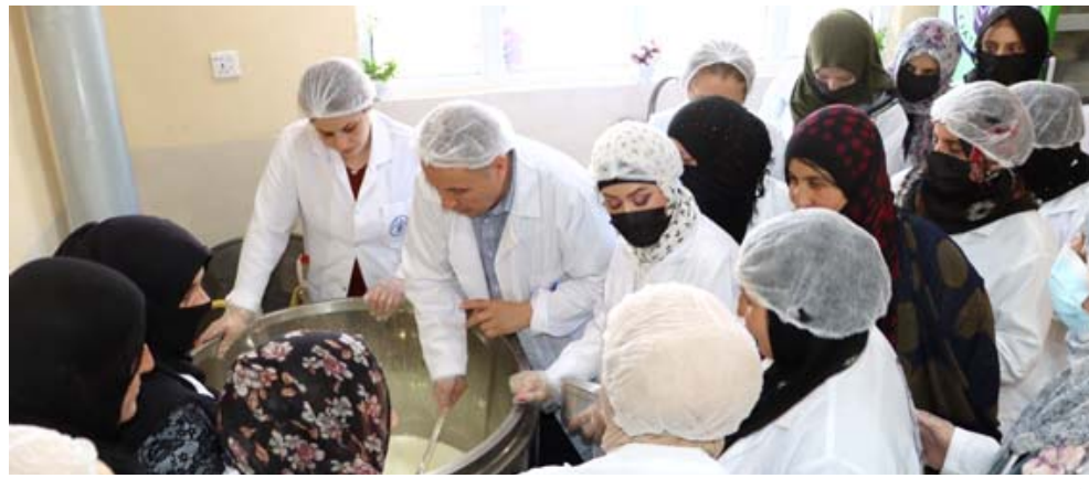
تدريب : عاملات من زمار خلال دورة الفاو