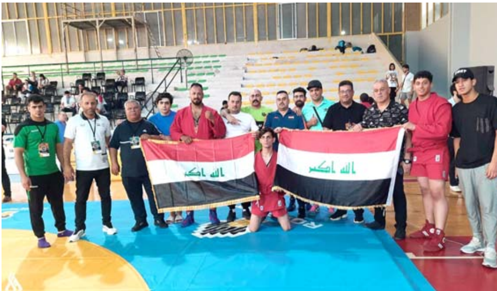
بطولة؛ منتخب العراق للسامبو والجوجيتسو الذي احرز العديد من الأوسمة في بطولة دولية

بغداد- الزمان أحرز منتخب العراق للسامبو والجوجيتسو، ست ميداليات برونزية، 4 ميداليات منفا لفة المتقدمين وميداليتان برونزية لفة الشباب. وكان المنتخب العراقي قد أحرز ميدالية برونزية الخميس لفة