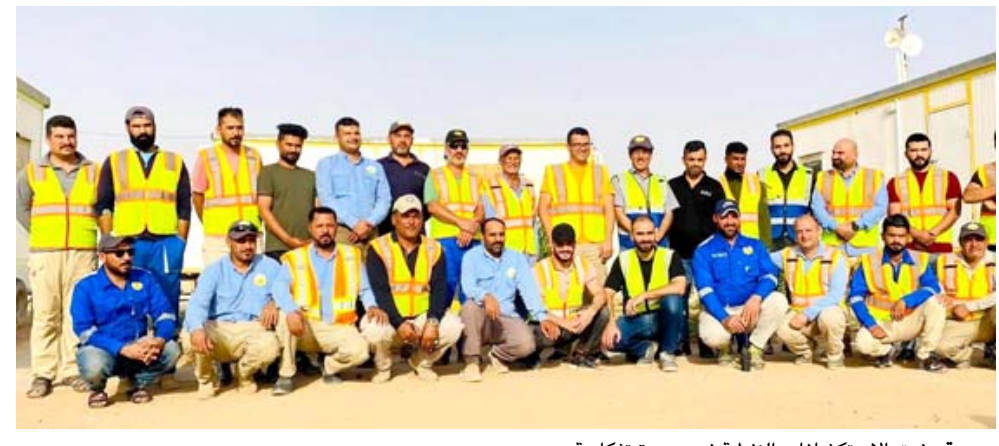
صورة: فرق الاستكشافات النفطية في صورة تذكارية

ثنائي الأبعاد بواقع عمل بلغت عدد نقاط الطاقة فيه 64196 أي بنسبة إنجاز 99.31 بالمئة) . وأضاف أن (مساحة رقة المشروع تبلغ 120.2761 كم 2 ويقع في الجزء الجنوبي الغربي من العراق وضمن الحدود الادارية لمحافظه المثنى . وأضاف إن هذا الإنجاز يضاف إلى رصيد إنجازات شركة الاستكشافات النفطية بشكل خاص وإلى شركة