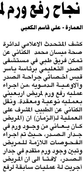
محمد محمد صادق الصدر

بليغاً في مقارعة نظام الاستبداد مجسداً بروحه العظيم الجهاد، ليقدّم أعلى مراتب المحبة والاحترام لكل من رئيس الوزراء العراقي ورئيس البرلمان محمد الحلبوسي، الشبان العراقيين بذكري إستهاد السيد محمد صادق الصدر، وقال الكافاني في تغريدته تابعها (الزمان) أمس (كان لوقفتها الشجاعة العميقة الأثر في التأسيس لمبادئ العدل ورفض الدكتاتورية، سؤكداً أنه من هذه المواقف الصلبة تستمد الأمم قوتها ورسوخ هويتها بوجه الظلم والبطغيان). فيما قال صالح في تغريدة أخرى ( نستذكر درساً