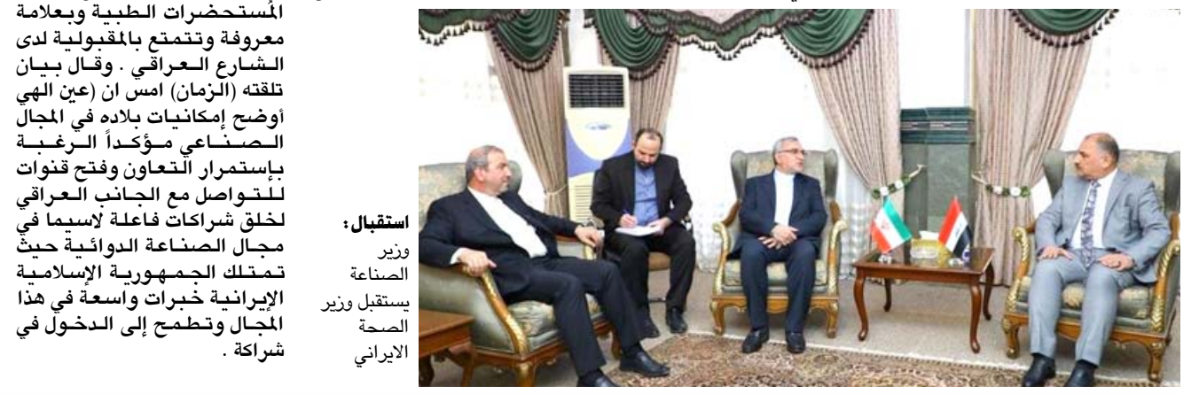
استقبال وزير الصناعة يستقبل وزير الصحة الإيراني

بغداد - الزمان التقى وزير الصناعة والمعادن شهل عزيز الخباز ووزير الصحة الإيراني بهرام عين الهوى والوفد الرفاق له لبحث تعزيز فرص