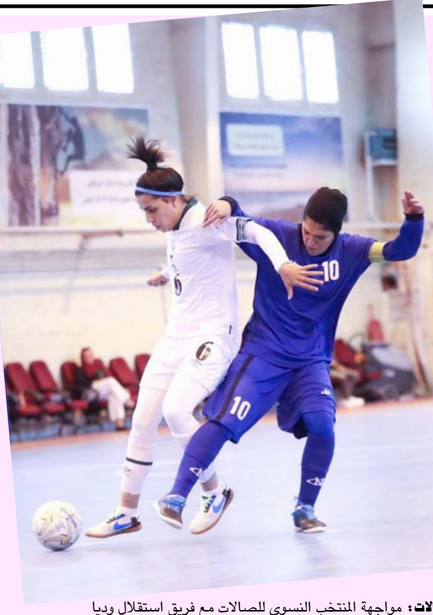
صالات؛ مواجهة المنتخب النسوي للصالات مع فريق استقلال وديا