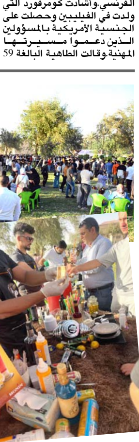
مهرجان لاكلك: ضيفت حدائق أبو نؤاس مهرجان بغداد للاكلك لدعم المشاريع الصغيرة حيث شارك فيه شباب وشابات من يعلون شغفا بالمطبخ ولعدم توفر فرص عمل أخرى وتتوعد المعروضات بين اكالات شعبية بسيطة وحلويات ومجنجات.