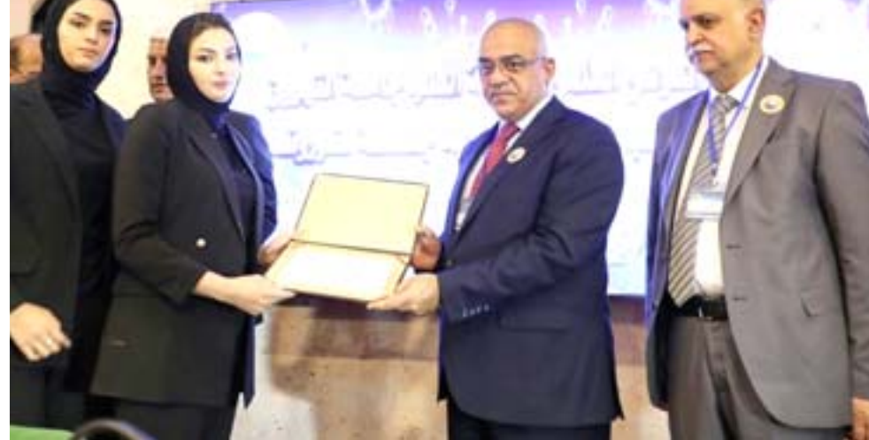
تكريم: جانب من حفل تكريم ذوي الشهداء في مؤتمر كلية طب النهرين

بغداد - (مركز الكاظمة نظم حملة توعية للمراجعين في المراكز الصحية المذكورة بالتعاون مع جمعية الهلال الأحمر ضد الحمى النزفية قبل الوصول إلى مرحلة حرجية). في سياق متصل حضر وزير التعليم العالي والبحث العلمي نبيل عبد الصاحب المؤتمر العلمي لكلية الطب في جامعة النهرين. وقال بيان تلقته (الزمان) أمس إن (الوزير ركز على منجز الباحثين العراقيين في المجال العلمي الطبي الذين تفوقوا أكثر من 13 ألف بحثاً علمياً). وأضاف أن (الوزارة مستمرة على مواصلة الجهود العلمية ومواجهة المتغيرات، لتسليط الضوء على منجزات الباحث المتخصصة بالطب، وأوضح أن (الشركات العالمية وإخضاع البحوث للمعايير والمقاييس تحقق اهدافاً وفق الطرق المعتمدة في الجامعة والمراكز البحثية الرصينة)، وأشار إلى أن (المؤتمر تضمن مشاركة باحثين من داخل