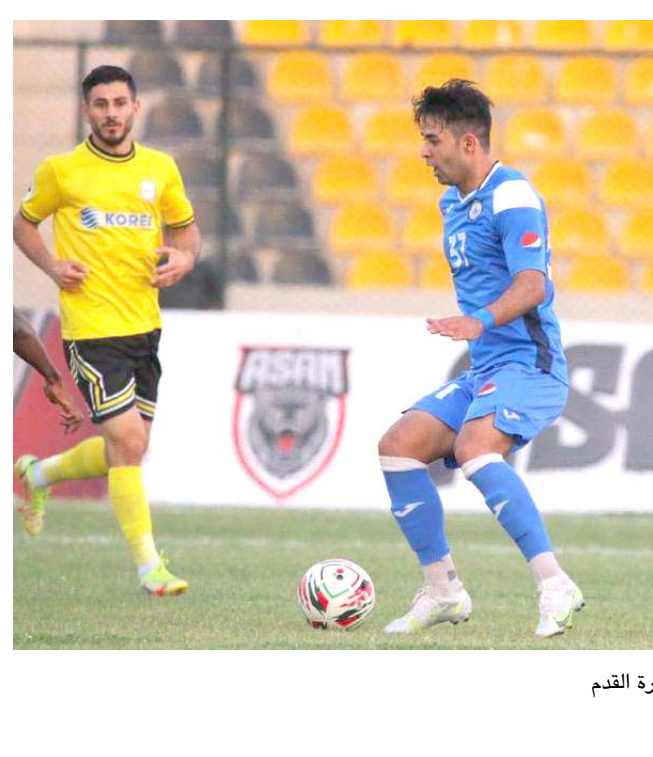
دوري: جانب من مباريات الدوري الممتاز بكرة القدم