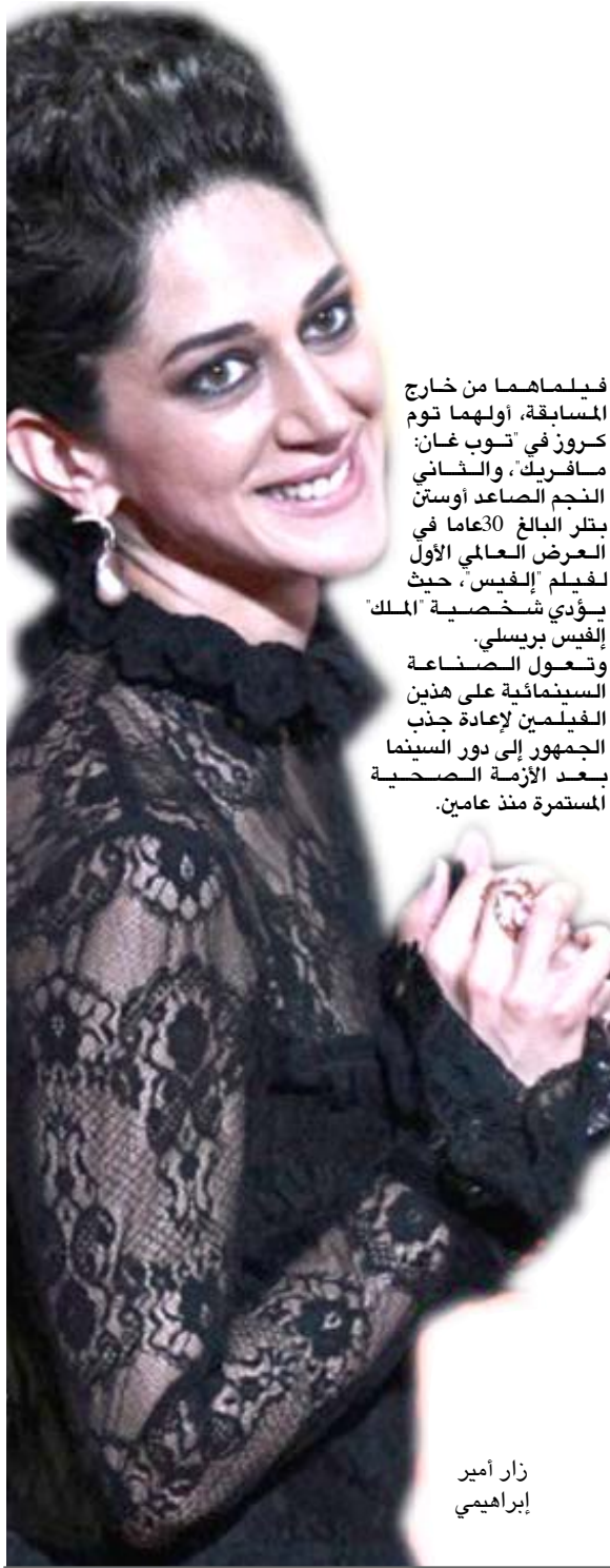
زار أمير إبراهيمي

فرنسا 2008 بعد فضيحة جنسية. وفاز المخرج السويدي من أصل مصري طارق صالح (50 عاماً) بجائزة أفضل سيناريو عن فيلمه "صبي من الجنة"، وهو عمل تشويقي سياسي ديني ينتقد أداء السلطات المصرية في عهد الرئيس عبد الفتاح السيسي ويغوص في عالم أبرز المؤسسات المعنية بالإسلام السنّي. وكانت بلجيكا من أبرز الراعيين في المهرجان، إذ بالإضافة إلى فوز لوكاس دوت بالجائزة الكبرى، حصل الأخوان داردين الميالن إلى حصلوا على جائزة أفضل فيلم على جائزة خاصة من لجنة التحكيم عن "دي إيت ماوتنوتن" بالمنافسة مع "إي أو" وهو فيلم عن حياة جيرزي سكوليموسكي. وفيما كان للحرب في أوكرانيا حضور بارز خلال المهرجان من خلال تضمينه عدداً من الأفلام للمخرجين الأوكرانيين، وافقته برسالة مقاومة للرئيس فولوديمير زيلينسكي من كيف، خرج المخرج الروسي سيرجيبينيكوف خاوي الوفاض. وبعد أن أصبح رمزاً للفن الروسي في المنفى، تمكن المخرج المناهض لنظام فلاديمير بوتين من الحضور للمرة الأولى إلى مهرجان كان السنّي بحضور نجمين عرض