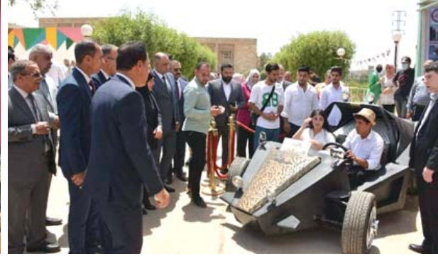
نشاط : عرض مسرحي ومعارض تقنية لطلبة كليتي الإعلام والفنون التطبيقية