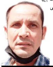
حيدر عبد الخضر

مشاركتنا في تشييع الرمز الوطني والشاعر الكبير مظفر النواب .. الذي تحول تشييعه الى كرنفال وطني وشعبي لتعزية الفاسدين ورفضهم والهتاف ضد القتل والصلصم واعداء الوطن والثقافة.. ابتدا الكرنفال من مقر اتحاد اديباء وكتاب العراق مرورا بساحة الاندلس وشارع السعدون الى ساحة التحرير ... النواب كان صوتنا الثور والتمرد ورفض الظلم والاستبداد وهكذا كان شباب تشرين اليوم ومجموعة من مثقفي وناشطي الوطن الذين اعدادوا روح وقلب مظفر النابض بالوطنية والتحدى والثبات باستثناء بعض التصرفات غير المنضبطة التي حدثت نتيجة سوء التنظيم والاحتكاك بين مجموعة من الشباب والعناصر الأمنية .. رسالة الى كل السياسيين الديكالي والمتطولين التركوا لنا الثقافة ورموزها الحقيقية .. يكلمنا ما سرقتهم ونهبتهم من احلامنا وتاريخنا وخيراتنا ومضاميننا وحاضرنا... السومري.