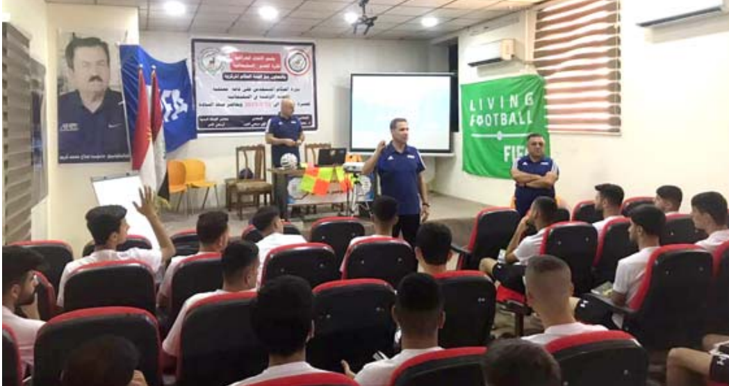
مورة: جانب من الدورة التحكيمية التي اقامها اتحاد الكرة

مجموعات والمحسوبيات والتدخلات آسيا لكرة القدم تحت 23 عاماً، التي تستضيفها أوزبكستان، مطلع شهر حزيران المقبل، المنتخب الأولمبي والكويتي.