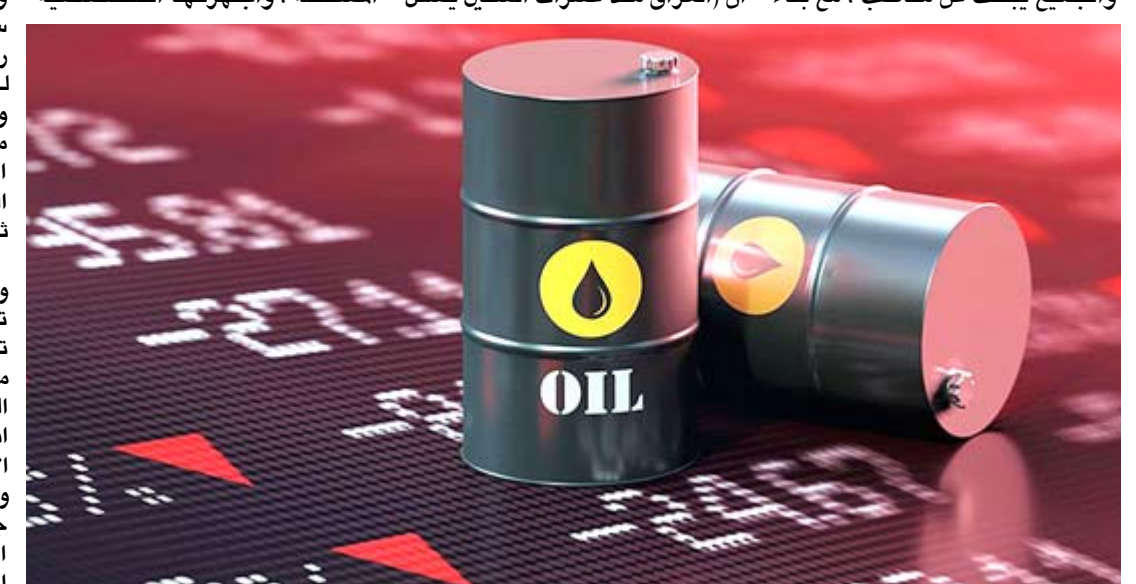
مؤشر : مخطط لمؤشر أسعار النفط

بغداد - رجم الشمري ضربت سبعة أشهر على انتخابات تشرين الأول 2021، دون أن يتمكن مجلس النواب من اختيار رئيس جمهورية وتشكيل حكومة ، حيث لم تتمكن اعلی كتلة سوى الحصول على 16 بالمئة من عدد مقاعد البرلمان ، ترك ذلك طرق للسيسر بالتحالقات انتهت بتجمعين متضادين مختلفين ، وساد الجمعت واقع الحال دون وجود لعقد جلسات ورقابية وتشريعات ، والجميع يبحث عن مناصب ، مع بقاء