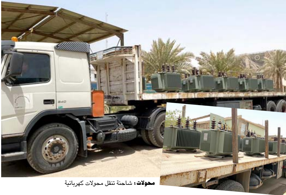
محولات : شاحنة تنقل محولات كهربائية

دائرة المشاريع في امانة بغداد أعمال صيانة ومعالجة المناطق المتضررة في شارع فلسطين من محطة وقود الشارع باتجاه مجسر بيروت). وحسب بيان تلقته (الزمان) أمس إن (هذا العمل بالتنسيق مع مديرية مرور الرصافة حيث يبدا من 7 صباحا حتى 1 ظهرا.