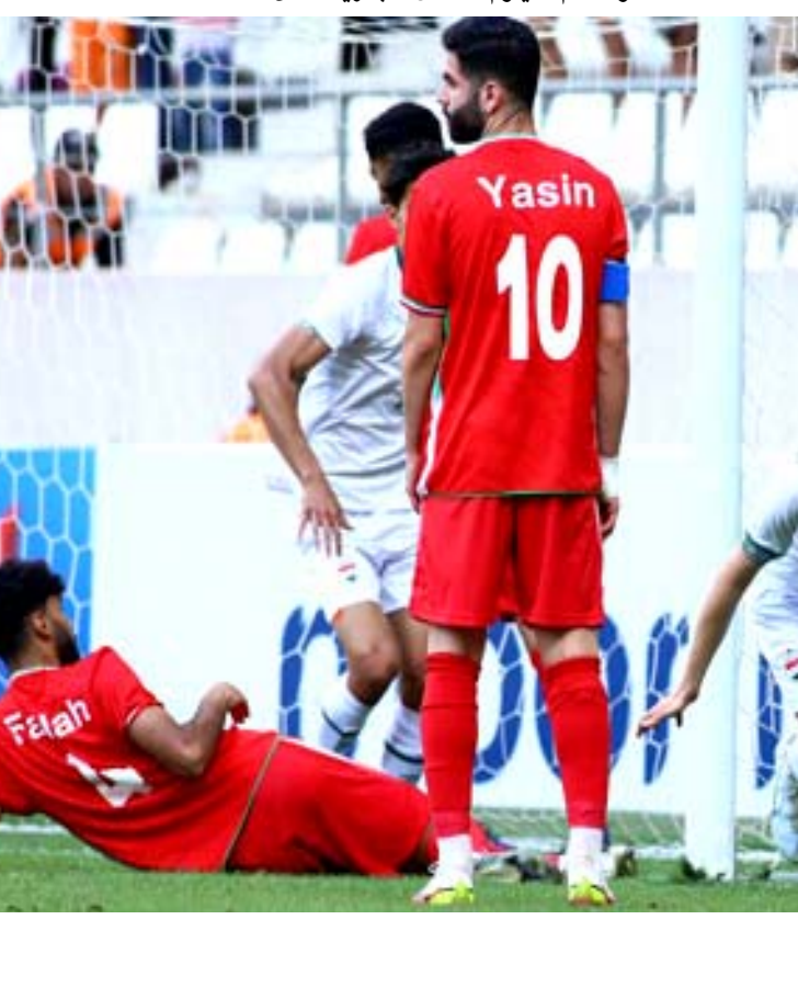
مباريات المنتخب وتقام اليوم خمس مباريات من

ومهم ان يعمد المدرب الى زج اكبر عدد من اللاعبين وصولا لتحقيق توليفة قادرة على تمثيل الفريق والتطلع الى المشاركة بقوة والمنافسة على لقب البطولة لكن الاول تقديم نفسه كما يجب في تصفيات المجموعة ومن المباراة الاولى الاربعة امام الاردن كون الفوز سيكون مفتاح النجاح امام الكويت واسرائيل وهي مهمة لم تكن سهلة اطلاقا واهمية الحرص على تقديم الاداء المتميز والمخلم بعدما اتضح صورة الاعبين والفريق بعد فترة اعداد مناسبة قبل تحقيق الفائدة من المباراتين الاخيرتين امام ايران الفريق المتكامل والذي قدم مستوى منطوق بفصل مهارات عناصره بوضوح واختيار اللعب معه كان مناسباً واختيار صحيح.