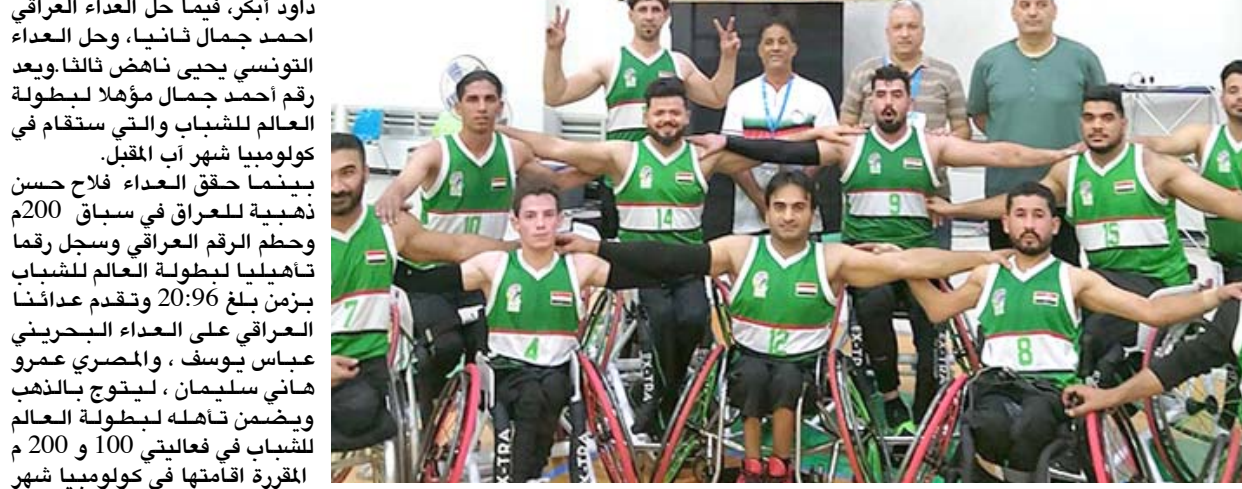
سلة: المنتخب العراقي لسلة الكراسي

بغداد- الزمان مدينة بوكيت التايلندية، فيما تتاهل السلة الكراسي العراقية الى بطولة العالم بعد فوزه الصعب على نظيره ماليزيا بنتيجة 50 نقطة مقابل 47 نقطة. حقق كذلك الفوز في المباراة السابقة على المنتخب السعودي في بطولة آسيا الجارية احدثها في