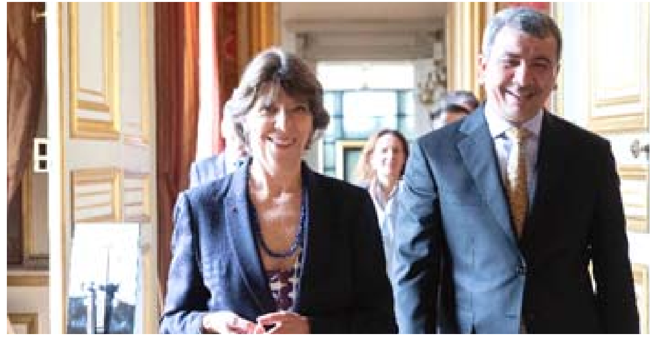
لقاء: وزير النفط خلال لقاء وزيرة الخارجية الفرنسية في باريس

باريس- (أ ف ب) - أكدت باريس وبغداد نيتهما تعزيز التعاون في مجال الطاقة، في وقت يبريد الأوروبيون الحد من شرائهم النفط والغاز الروسيين على خلفية الحرب في أوكرانيا وشددت فرنسا أيضاً على تمسكها بعراق مستقر فيما لا يزال هدفاً لتدخلات أجنبية مع عملية جديدة للجيش التركي في شمال هذا البلد تستهدف الأكراد، فضلاً عن تنامي النفوذ السياسي لإيران المجاورة.