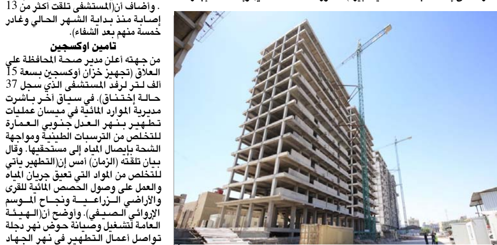
مشروع : مجمع سكني قيد الانشاء

ميسان - على عباس الكبي بحث رئيس هيئة الإستثمار يوسف الأساري مع شركة الصريفى للمقاولات التعاون المشترك لبناء وحدات سكنية في ميسان. وقال بيان تلقته (الزمان) أمس إن (الأساري ومدير الشركة على الصريفى للمقاولات العراقية بحثا الإتفاق في مجالات السكن والطاقة والبنى التحتية وتنفيذ مجموعة مشاريع إستثمارية في المحافظة). وقل عن البيان تأكيد الأساري دعم الهيئة للشركات العراقية والإجنبية المستثمرة. بدوره أكد الصريفى (قدرة الشركة على إنشاء مجمعات سكنية كبيرة).