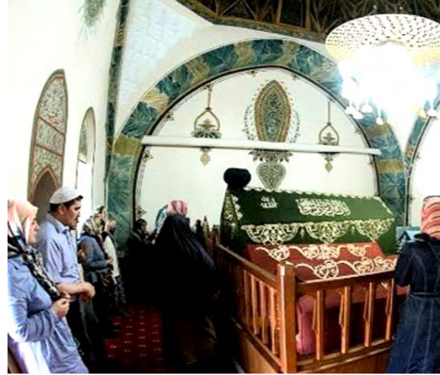
تراء: معالم جميلة في الأناضول

جدرانها وسقوفه الخشبية العالية التي يتدلى منها ثريات الكريستال التي تحيط بها مصابيح كبيرة إضافة الى محراب مصمم بطراز إسلامي البغدادي القديمة ليحتسي القهوة التي اشتهر الأتراك في إعدادها بطريقة مختلفة عن كل دول العالم ثم تناول أطباق الحلويات والمثلجات والمرطبات الصيف قبيل إقامة الصلاة وهو منبر صمم بشكل لافت للنظر إذ استرخت فيه روحية النقوش الإسلامية مع روحية تصاميم الكنائس القديمة إضافة لروح عال ابيض من الحجر هو عبارة عن ساعة توقيت كبيرة تم تصميمها بشكل جميل تقع في أحد الأركان التي تطل على المسجد وعند التجوال بين أروقة وممرات المكان ستفوقك راحة المشويات الطبية الشهية والأطعمة الشرقية المتوفرة الى المطاعم والكافيتريات بكل درجاتها السياحية المختلفة التي تعتبر أماكن جذب سياحي مهمة لكثير من الزائرين لما تقدمه من