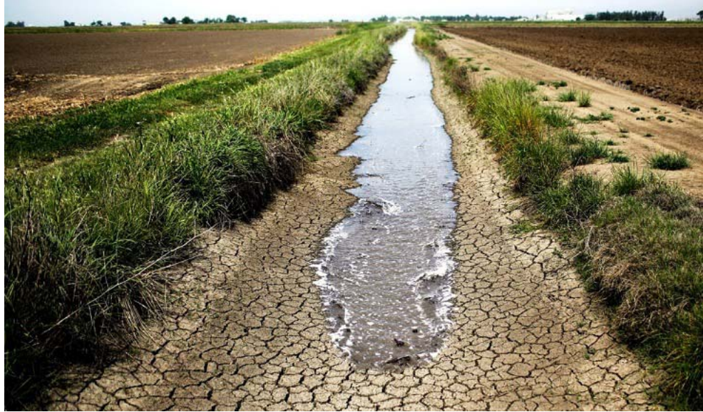
جفاف : جدول مائي يشكو الجفاف

الدولار الأميركي، في حين إن الطلب الحالي على الدولار أعلى من الانخفاضات بعام (2020) في سياق متصل بحث علاوي مع وفد من الإتحاد الأوربي تعزيز التعاون المالي والإقتصادي. وقال بيان تلقته (الزمان) إن اللقاء الذي جرى بمقر الوزارة تضمن بحث حزمة الإصلاحات التي شرعت بها الحكومة العراقية في إطار الورقة البيضاء من جهته أبدى الوفد رغبته بتوسيع مساحة التعاون ومواصلة دعمه لخطة الحكومة العراقية الإصلاحية).