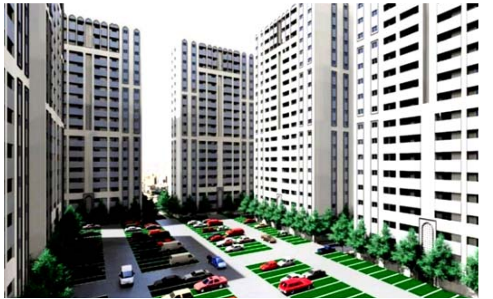
مجمع ، جانب من مجمع سكني تحت الانشاء

بعد سنوات قليلة يزدان أفق العاصمة بأكثر من 100 برج جديد وبارتفاعات تتراوح ما بين 17 إلى 39 طابق، وهو ماتشير له المشاريع اليه التي تنفذ حاليا وأبرزها :مبنى البنك المركزي العراقي الجديد المؤلف من 37 طابق و بارتفاع 170متر في منطقة الجادرية، برج الزيتون المؤلف من