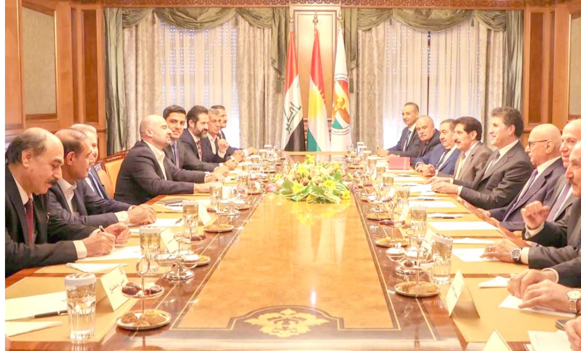
اجتماع: الحزبان الكرديان الرئيسان خلال اجتماعهما امس في اربيل