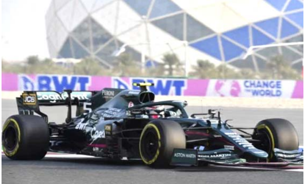
نماذج : احدى نماذج السيارات العالية

بولين- وكالات أكد أندري جرين، مدير المكتب التقني لفريق أستون مارتن، المنافس في بطولة العالم لسباقات سيارات فورمولا-1، ان الإزعاءات حول اقتباس فريقه تصميم سيارة ريد بول بعيدة تماما عن الحقيقة. واعتمد الاتحاد الدولي للسيارات (فيا) سيارة أستون مارتن، ولكن كريستيان هورن رئيس ريد بول أكد لشبكة "سكاي سبورتس" انه سيفتح تحقيقا داخليا، مشيرا إلى أن التقليد هو أكبر شكل من أشكال الإطراء. وكان أستون مارتن تعاقد مع دان فالوز رئيس قطاع