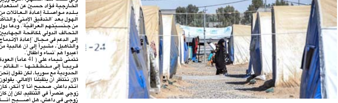
تاهيل - لفتة من مخيم ومركز الجدة للتأهيل المجتمعي

كانوا منتمين لعصابات داعش، في نهاية المطاف الحكومة العراقية هي التي أفرجت عنهم، فبجانب حياة شبيهة طبيعية، فيتبادلون الزيارات بدمعة وبغضاضة، يقولون إنهم لم يمتدوا أبداً إلى (الاعتناء) بأفكار مخالفة في إشارة إلى التطرف، بالتعاون مع مجموعة باحثين مختصين في الدعم النفسي، موضحاً (بوجود) في المركز فريق مختص بكيفية معالجة وصمة داعش، لدينا بغض العائلات أفرادها