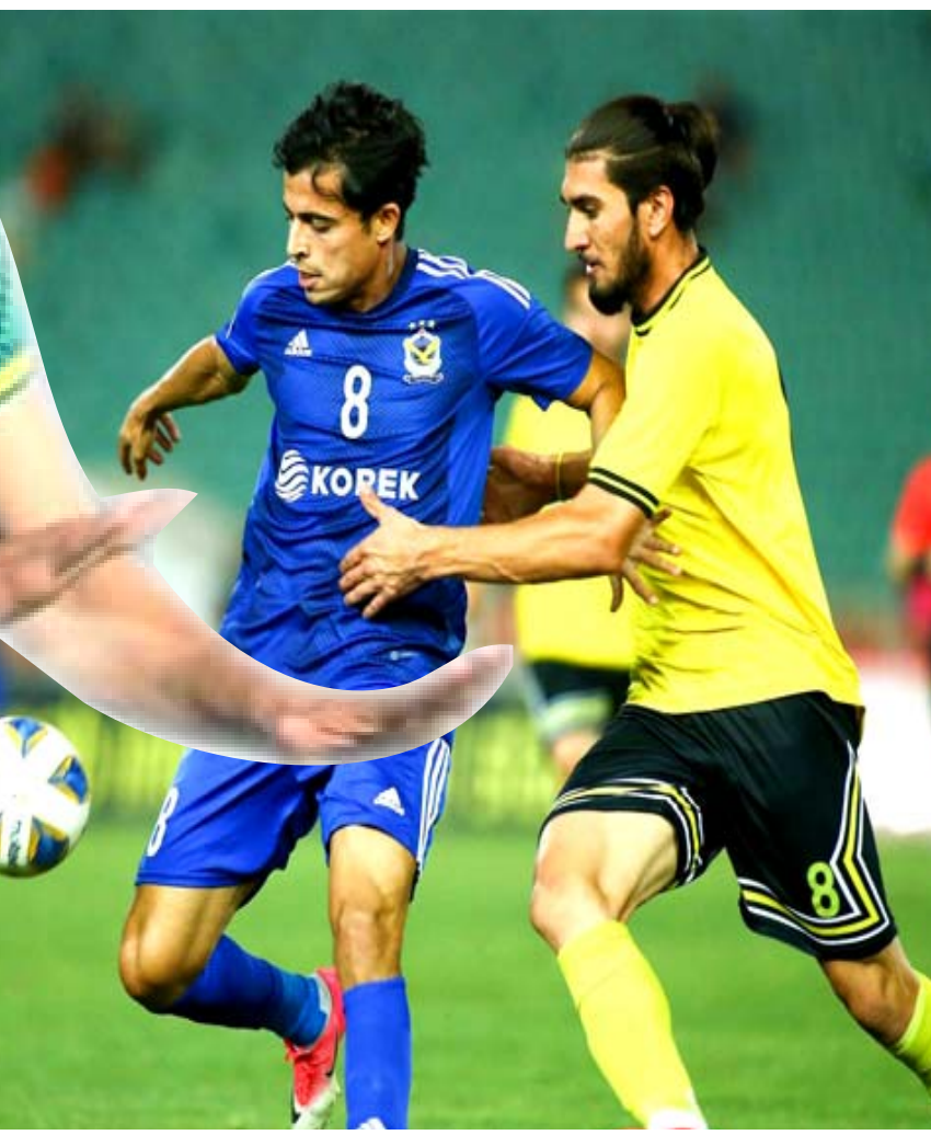
فوز: الكرة الجوية يفوز على اربيل بالمتام

على تراجع النتائج والمطالبة بحل الإدارة وحقق النقط فوزاً على زاخو في عقر داره بهدف فيمماخرج النجف بتعادل بلعوم الخسارة أمام نطق ميسان