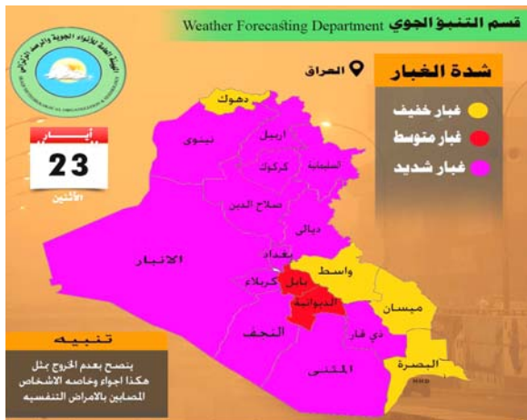
بغداد - قصي منذر

وجه رئيس مجلس الوزراء مصطفى الكاظمي بتعطيل الدوام الرسمي اليوم الاثنين بسبب سوء الأحوال الجوية جراء العاصفة الترابية المرتقبة. وقالت الأمانة العامة لمجلس الوزراء في بيان إن رئيس مجلس الوزراء وجه بتعطيل الدوام الرسمي في المؤسسات الرسمية، عدا الدوائر الصحية والإمنية والخدمية اليوم الإثنين، الموافق، للساعات العشر من شهر ايار، سنة 2022 بسبب سوء الأحوال الجوية، ودخول موجة من العواصف الترابية الشديدة إلى مناطق متفرقة من العراق.