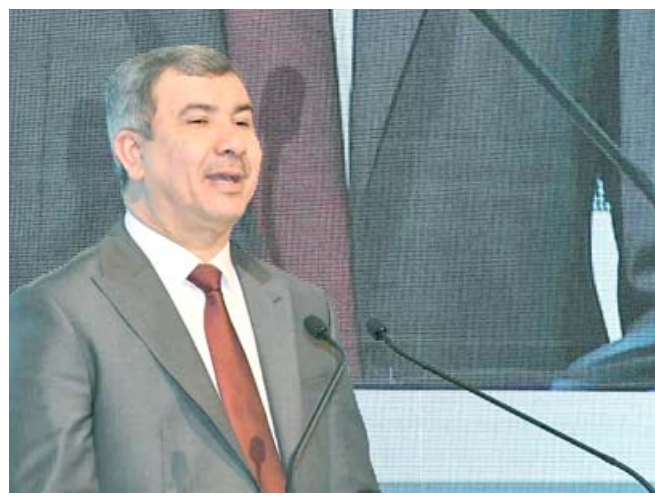
كلمة :وزير النفط يلقي كلمته في مؤتمر الشرق الأوسط للنظف والغاز

بغداد - الزمان كشف خبير اقتصادي، عن تحطى مبيعات العراق خلال الأعوام العشر الماضية حاجز الترليار دينار (1000 ترليون دينار)، دون أن يتحقق شيء ملموس على أرض الواقع أو حدوث انتقالية في مستوى المعيشة والبنى التحتية.