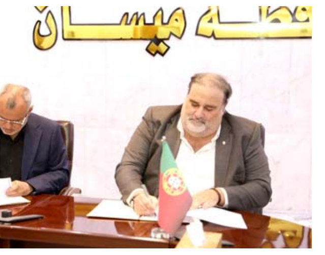
توقيع : الحكومة المحلية في ميسان توقع اتفاق تعاون مشتركاً مع شركة برغالية

واضاف ان (الاتفاقية وقعت مع وفد من المدينة مكون من نائب رئيس البلدية ومدير الشركة والوفد المرافق لهم و محافظ ميسان عدد من مراءه الواتر الحكومية العاملة في المحافظة). لافتاً الى ان (ممثل من المحافظة برفقة وفد عراقي قام بزيارة المستشفيات الحكومية الخاصة والمنشآت الرياضية والمرافق العلاجية والخدمية في البرغلة، كذلك اللقاء بسفير جمهورية العراق لدى البرغال الذي تطرق للعديد من المواضيع والمشاريع التي يمكن إبرامها بين البلدين).