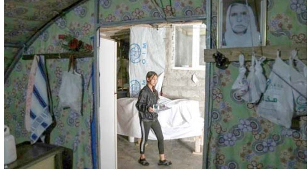
مخيم: نازح إيزيدي في مخيم شامشكر في إقليم كردستان

وبعد خمس سنوات على نهاية العمليات ضد تنظيم داعش، لم يعد بعد أكثر من 193 ألفاً من سكان سنجار، من الإيزيديين وأكراد وعرب، يعد إلى مناطقهم الواقعة في شمال العراق. ومطلع أيار الجاري، أرغم التوتر الأمني والاشتباكات بين الجيش ومقاتلين إيزيديين في المنطقة نحو 10 آلاف شخص على الخروج من جديد. ويقول تقرير المجلس النرويجي للاجئين إنه بالإضافة للتصعيد المستمر بين الجماعات المسلحة، فإن تحديات الوصول إلى المساكن والأراضي وحقوق الملكية تشكل عوائق كبيرة أمام المجتمعات النازحة. وأضاف التقرير أن نحو 64 بالمئة ممن شملهم الاستطلاع قالوا إن منازلهم تضررت بشدة، فن إشارة إلى استطلاع أجري في كانون الأول 2021 شمل 1500 شخص وأشار