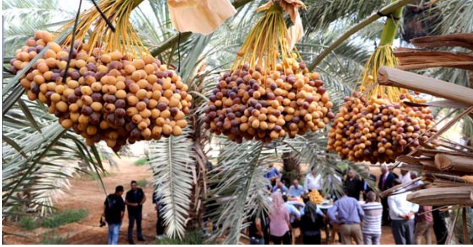
تمور: توقع انخفاض محصول التمور بسبب العواصف