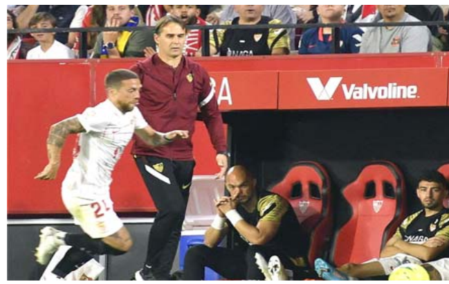
ليغا: مدرب إشبيلية جوليان لوبيتيفي في إحدى مباريات الليغا

□ برشلونة - (إ ف ب) - أعلن نادي برشلونة الجمعة إصابة مدافعيه أوسكار مينغيسا ومهاجمه الدنماركي