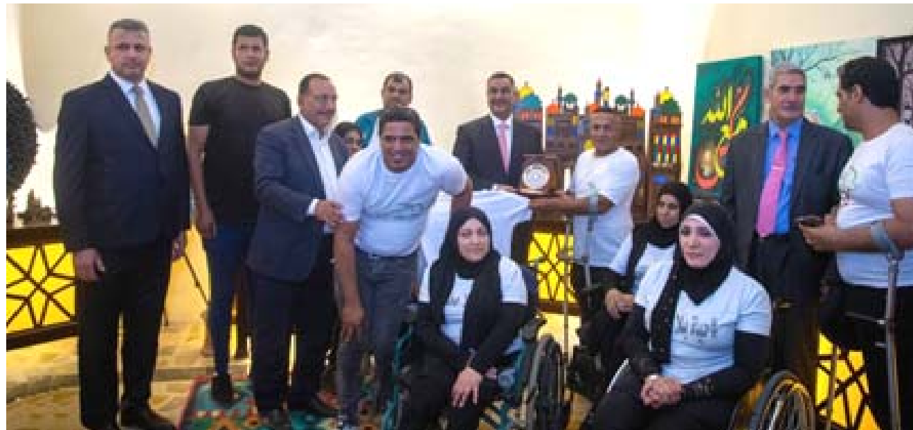
لقطة : محافظ البنك المركزي يتوسط ذوي الهمم في لقطة تذكارية