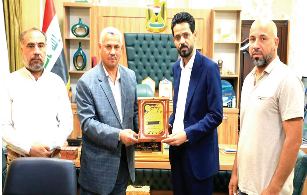
دعوى مدير الوقف السنني في ذي قار يقدم درعاً للمحافظ محمد هادي الغزي

التظاهرات البالغ عددها 26 حالة ، وان وزارة الصحة ارسلت التقارير الطبية للجرجي الى المستشفيات خارج العراق .لبنتهى بهذا ملف الجرحى ومعاناتهم ، وتابع ان (رئيس الوزراء وافق على مفاحة مجلس القضاء الاعلى لغرض تحويل الدعاوى الخاصة بالمختاهرين من قسم الارهاب الى الاقسام الشرطة المحلية لغرض تسليم جميع المطلوبين انفسهم بعد تقديم المحافظ طلب لانهاء هذا الملف العالق ) . مؤكد انه (حصل ايضا على موافقة رئيس الوزراء على تحويل احدى المقترحات التي تقدم بها لوضع الحلول ملف الخريجين المعنصمين ، بشأن توفير درجات اضافية من رواتب العاطلين لحن اقرار الموازنة واحالة الطلب الى وزارة العمل لدراسة). من جهة اخرى ،اعلن اسين بغداد علاء معن ، انجاز اكساء عشرة ملايين متر مربع من سوارع العاصمة ، مؤكداً قرب