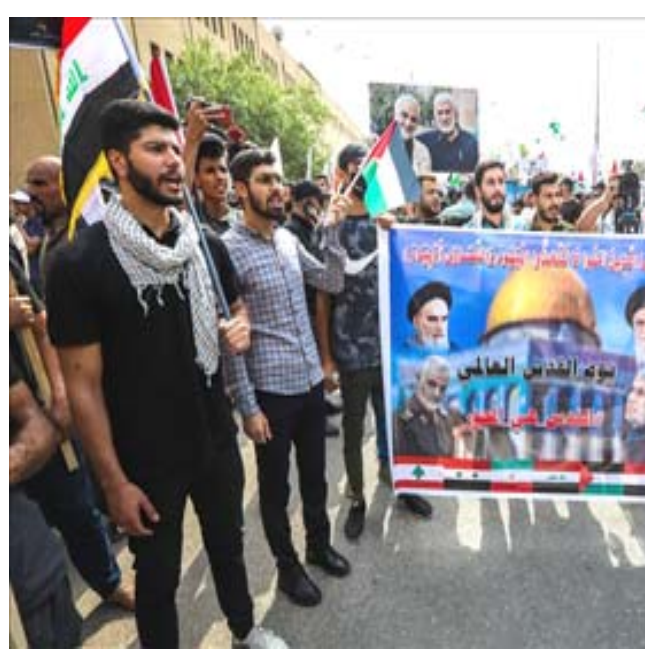
تضامن : وقفة تضامن في بغداد بيوم القدس العالمي

ستعود إلى احضان الأمة ولن تتخلى عن شبر واحد من أرضها من البحر إلى النهر) ، ولفت الى ان (وقوفكم أيها المقدسون ودفاعكم عن الأقصى والقدس يمثل حقيقة الوعد الإلهي