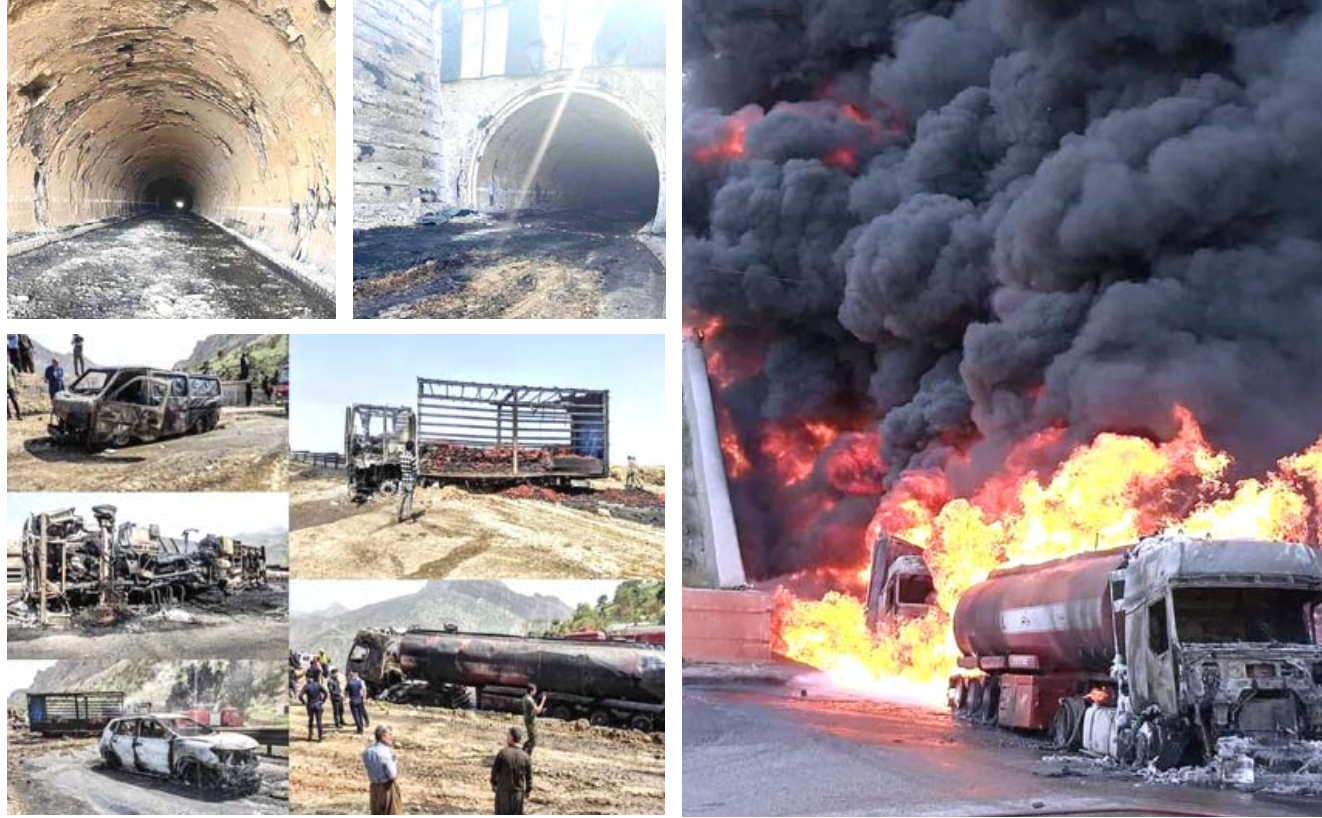
حريق : نفق دربديخان في السليمانية يخرج عن الخدمة بعد احتراق صهريج حمل الوقود وعددا من الشاحنات والسيارات المدنية

بغداد - الزمان قدم العلامة حسين محمد هادي الصدر والوزير البرلماني الأسبق ابراهيم بحر العلوم، التعازي بوفاته وزير الثقافة السابق عبد الأمير الحمداي ، الذي وري جثمانه الثرى اول امس . وقال الصدر في بيان تلقته (الزمان) امس ببلاغ الأسف والإلتعاب تلقينا نبأ رحيل الحمداي ، الذي كان واحداً من علماء الآثار اللامعين والوزراء العراقيين الوطنيين المخلصين الزهيين ، انه الانسان النبيل الذي تستهويك اخلاقيته وتأسرك انسانيته . واضاف (اننا اذ نعزي به العراق بنخس أسرته الكريمة وعارفي فضله ومحبيه بالمواساة بهذا المصاب الجلل ونضرم الى العلي الغدير أن يتغمده بواسع رحمته ورضوانه وأن يعوضه عن طويل معاناته اجمل تعويض ) . بدوره ، كتب بحر العلوم في تغريدة على تويتر ناعيا الحمداي ، على خسارتنا كبيرة برحيل شخصية مثقفة واعية لدورها في الانتصار