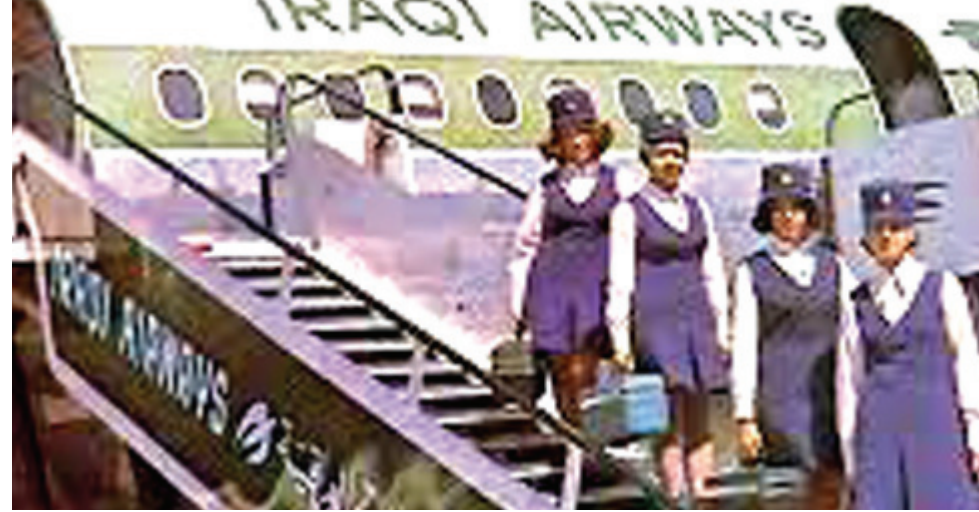
لقطة : مضيفات الخطوط الجوية العراقية في لطة ارشيفية

المسافرين . لم تكن هناك طائرات شحن متخصصة ومجدولة الى بداية الثمانينات حيث تم تاسيس شركة شحن متخصصة بين الخطوط الجوية العراقية والملكية الاردنية بطائرتين من طراز 707 بواقع طائرة واحدة لكل شركة وباسم العربية للشحن الجوي . وكانت الخطوط الجوية العراقية تضطر لاستئجار طائرات من شركات الشحن متخصصة اخرى لنقل الشحن المتزايد من المانيا (بيض الدواجن وافراخ الدجاج ) وبرحلات شبه يومية ويطائرات 707 المستاجرة من احدى شركات الشحن المصرية . وكذلك الحال لنقل الايسار من الولايات المتحدة ولحساب وزارة الزراعة ويطائرات 747 المستاجرة ايضاً . وفي نهاية الثمانينات تم إلغاء العربية للشحن الجوي واستردت العراق كانت تنقل جزء كبير من صادراتها على شكل غفش اضافي وبحمولة تصل الى اربعين طن وكان سعر الكيلوغرام الواحد بهذا الشكل 2.3 دولار وباقي ما يتيسر من المكان يخصص للشحن العادي ويسعر 1.1 دولار للكيلو غرام أي ان ايراد الكثير من الرحلات (طوكيو بغداد ) كان يفوق المليون دولار للرحلة الواحدة هذا عدد ايرادات الرحلة القادمة من بغداد ومن المسافرين المتحقيين من اسيا كيانكوك وكواينبور وكذلك الى طوكيو وسيئول يتوقف واحد من احد مطارات جنوب شرق اسيا .ويعد استلام الطائرات الاستراتيجة العملاقة ( 747 للنقل المختلط 258مסافر من 50 طن شحن او للمسافرين فقط 400 مسافر او للشحن فقط حوالي 100 طن ) مع امكانية تحويلها بسهولة ،تشنت الخطوط الجوية العراقية نشاطاً كبيراً في عمليات الشحن الجوي . في نهاية السبعينات وبعد تبشير هذه الطائرات الى طوكيو تسببت اسبوعية واحدة قاربت نسبة ائتلاء المكان المخصص للشحن 100 بالمئة والغريب ان