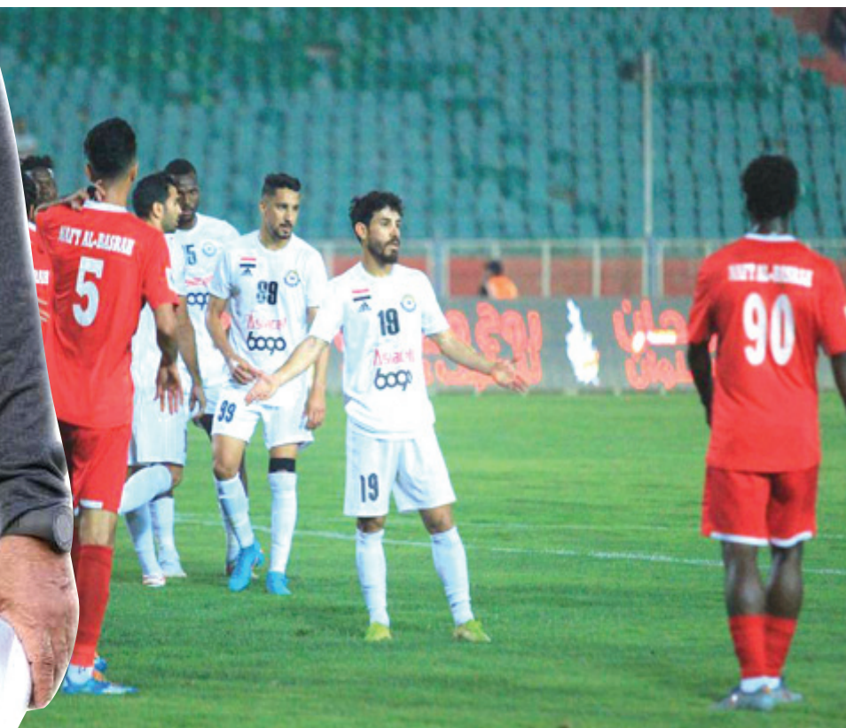
فوز الزوراء يحقق فوزاً مهماً على نفط البصرة في الماتن