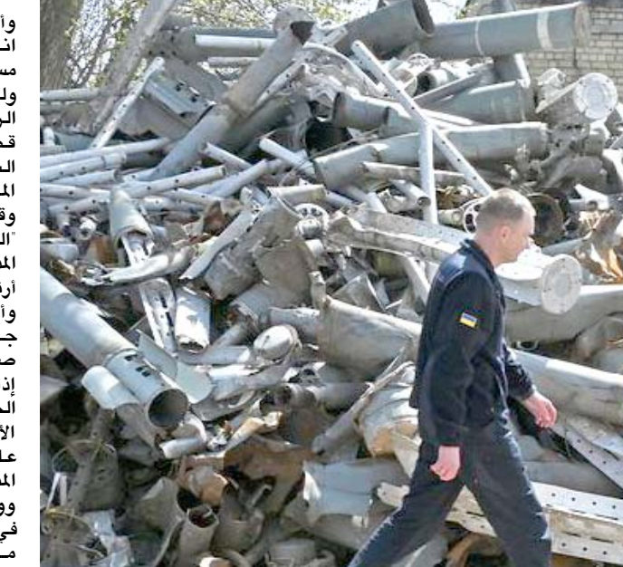
صواريخ: كومة من بقايا الصواريخ التي سقطت على مدينة خاركيف ومحيطها، جمعها عناصر خدمة الطوارئ الأوكرانية

فقد طلب الرئيس الأميركي جو بايدن من الكونغرس هذا الأسبوع زيادة الميزانية 3.3مليار دولار لزيادة شحنات هذه الأسلحة. وبدأت آثار ذلك تظهر على الأرض حيث تواجه القوات الروسية السمية صعوبات في بعض الأحيان. وهذا ما ينطبق على روسيا لوزوفا (وهي قرية تقع شمال خاركيف سيطر عليها الأوكرانيون بعدما كان الروس يقصفون المدينة اخلاقا منها. واعلنت وزارة الدفاع الأوكرانية إنه تم تحرير