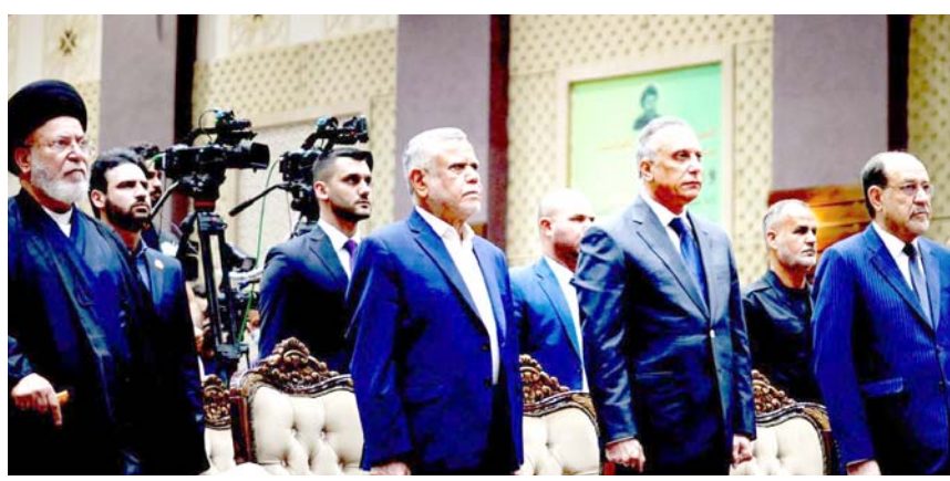
بغداد - الزمان

دعت فعاليات استذكار المفكر الشهيد محمد باقر الصدر الى اعتماد منهج الإصلاح والعدل في بناء عراق قوي ووحيد، لتحقيق تطورات الشعب على مختلف قوسياتهم ومذاهبهم، وقال رئيس الوزراء مصطفى الكاظمي في تغريدته على تويتر امس (ستذكار استشهاد الصدر الذي ناضل من أجل العدل وشكل فكره منطلقاً للإصلاح، واضاف (تزامناً تكرياً استشهاده مع يوم سقوط النظام في 19 نيسان، هو مناسبة متجددة للتذكير بضروة اعتماد منهج الإصلاح والعدل في صميم النظام السياسي لتحقيق تطورات الشعب). وشارك الكاظمي في الاحتفال المركزي لحزب الدعوة الإسلامية في الذكرى السنوية لاستشهاد الصدر واخته العلوية أمنة بنت الهدى من جانبه، دعا رئيس جمهورية برهم صالح، إلى توحيد الكلمة من أجل بناء العراق. وقال في تغريدته على