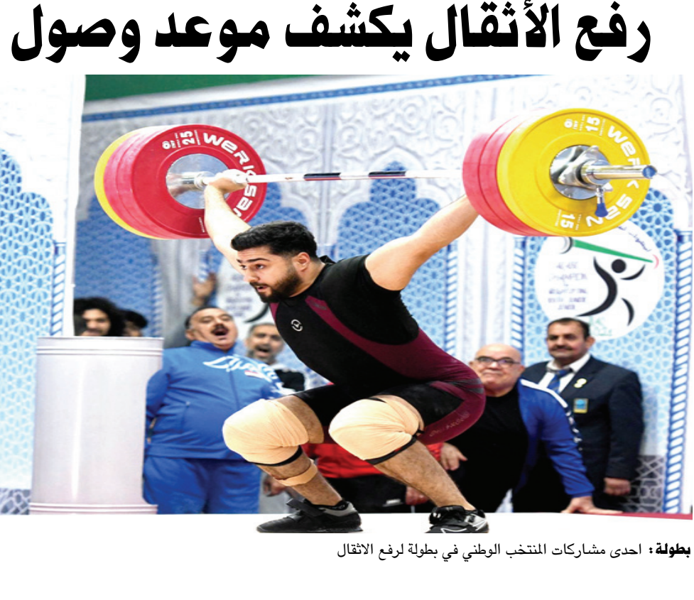
بطولة: احدى مشاركات المنتخب الوطني في بطولة لرفع الأثقال

سمات الدخول، مشيراً إلى أن الاتحاد العراقي سيتشاور مع المدرب بخصوص منهجه للمرحلة المقبلة وسبل تطوير الربايعين واختيار الأفضل منهم بغية توزيعهم بين البطولات التي سيشاركون فيها من بينها بطولة التضامن الإسلامي التي ستقام في مدينة قونيا التركية وبطولة اسيا في الصين، وهناك أيضاً بطولة العرب التي تضيقها البحرين مطلع تموز المقبل وتستمر حتى الحادي عشر من الشهر نفسه، ومن ثم منافسات اسيا للناشئين نهاية تموز المقبل. وأضاف صالح لدينا مشاركة مهمة في بطولة العالم للشباب في اليونان تحت 20 عاماً في الـ 28 نيسان الحالي، وسيتملنا فيها الربايع علي