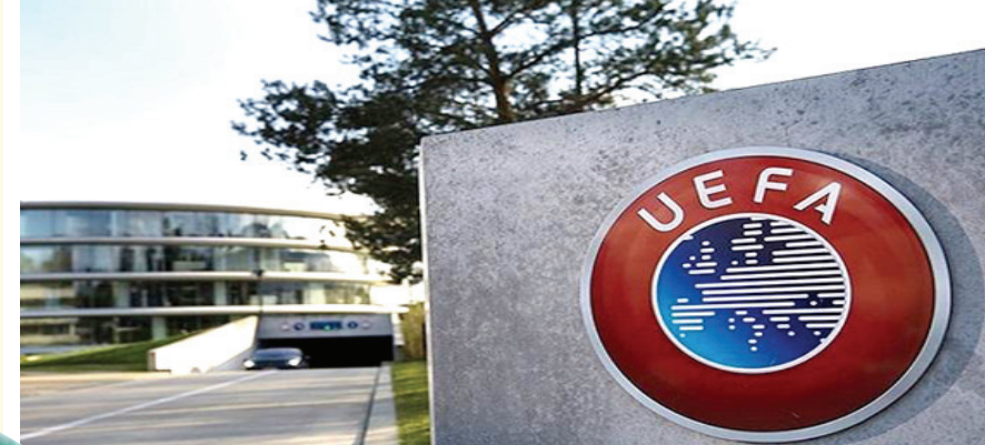
مبني: مبنى الاتحاد الاوروبي لكرة القدم

بغداد - الزمان أعلنت اللجنة التنفيذية للاتحاد الأوروبي لكرة القدم يوييفا، عن موافقتها على اللوائح الجديدة لتراخيص الأندية والإستدامة المالية في اجتماعها في مدينة نينون وقال يوييفا في بيان، ان اللوائح هي أول إصلاح رئيسي للوائح المالية للاتحاد الأوروبي لكرة القدم منذ ان تم تقديمها لأول مرة في عام 2010، ونقل الاتحاد الأوروبي عن رئيسه الكسندر تشيرنير قوله ان اللوائح المالية الجديدة للاتحاد الأوروبي لكرة القدم، التي تم تقديمها في عام 2010 خدمت غرضها الأساسي، لقد ساعدت في سحب الموارد المالية لكرة القدم الأوروبية من حافة الهاوية وأحدثت ثورة في كيفية إدارة أندية كرة القدم الأوروبية. ومع