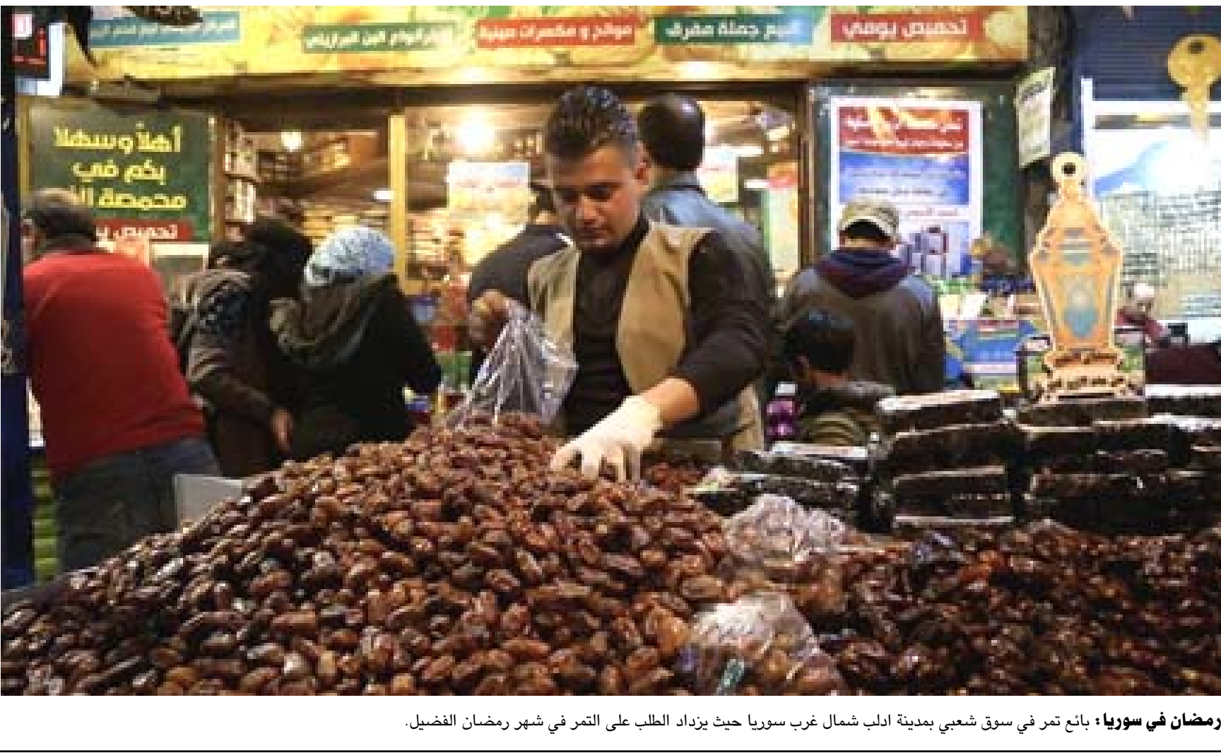
رمضان في سوريا : بائع تمر في سوق شعبي بمدينة ادب شمال غرب سوريا حيث يزداد الطلب على التمر في شهر رمضان الفضيل.

أوستن (الولايات المتحدة) (1 ف ب) - افتتح الملياردير إيلون ماسك - الخسيس مصنعاً جديداً لشركة تسلا في أوستن بتكساس، في احتفال حضره الآلاف وبدأ أشبه بحفلات نجوم الموسيقى. ويصل ماسك الذي يحتفل بنمو استثنائي تشهده شركته المتخصصة في تصنيع السيارات الكهربائية، إلى الاحتفال بمرور 15 عاماً على تأسيسه، بعد أن بدأ الشركة عام 2008. وتخللت عروض ترغيفية وأطعمة ومشروبات وموسيقى قدمها عدد من الفرق بالإضافة إلى إطلاق ألعاب تارية. ويقع المصنع المسمى غيغا تكساس على أرض تعادل مساحتها مئة ملعب كرة قدم، والمصنع الذي بدأ تشغيله منذ نهاية عام 2021 هو خاص مصنع ضخماً تابع لتسلا، إذ تملك الشركة أربعة أخرى في نيفادا ونيويورك وشنغهاي وبرلين. وأكد ماسك أن مبنى المصنع أطول من برج خليفة في دبي (أعلى مبنى في العالم)، مضيفاً أنه مصنع للسيارات الأكثر تطوراً على الإطلاق، إذ تدخل مواد التصنيع في جبهة لتخرج السيارة مصنعةً من الجانب الآخر. واستعرض الفريق العامل عدداً من منتجات الشركة المستقبلية كسيارة ساير تراك الكهربائية المقرر بدء إنتاجها عام 2023 والرسيوت أوتوموس بي.و.سي. ما لا يرغب البشر بالقيام به. ويعود ماسك مجدداً لتصنيع ريبوت، تاسمي مستقل بشكل كامل.