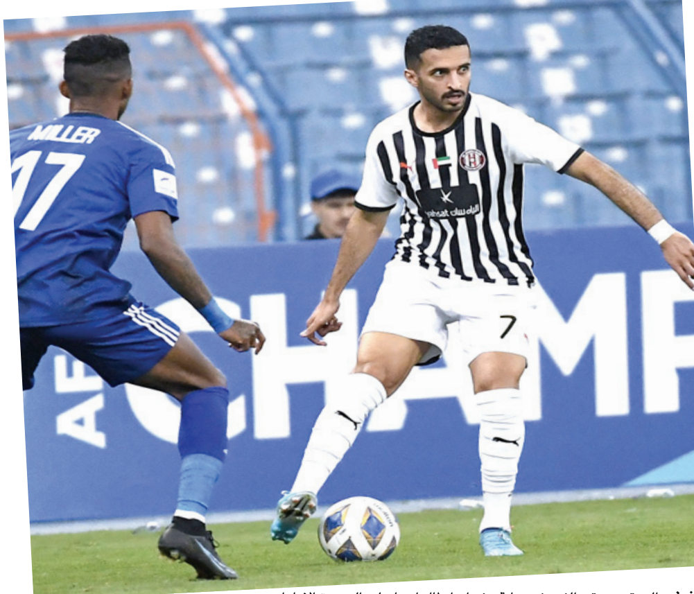
فوز: الصقور تحقق الفوز في بداية مشوار أبطال اسيا على الجزيرة الاماراتي

الدفاع والهجوم والتهديد وفي وضع مختلف كثيرا عن المستوى المتراجع محليا.