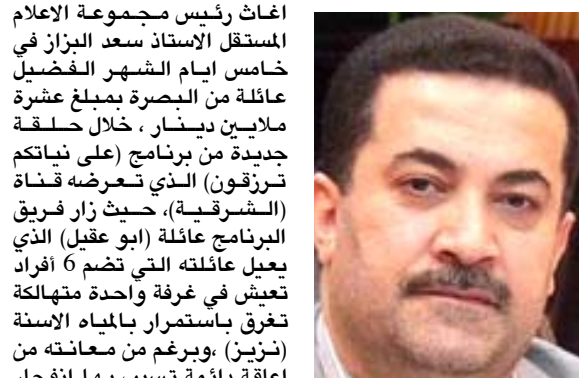
محمد شياع السوداني