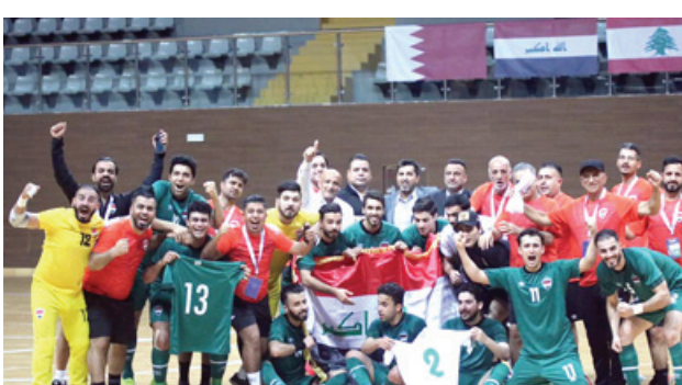
تأهل: فرحة المنتخب الوطني للصالات بالتأهل إلى نهائيات آسيا

تأهلات إلى نهائيات كأس آسيا، فضلاً عن مشاركة المنتخب الوطني للصالات ببطافة التأهل إلى نهائيات كأس آسيا، وصداقته للمجموعة بالرغم من تعادله مع البحرين وحصل العراق على إحدى بطاقتي التأهل بعد خسارة العراق في حالة تأخر الفريق لا تتعدى عن سبعة ولا تزيد عن عشرة لاعبين، مدة المباراة 30 دقيقة على شوطين وفي حالة تأخر الفريق عن موعد المباراة 15 دقيقة يعد الفريق منسحباً وتعتمد النتيجة لصالح الفريق الآخر بشرط 2-0 وجوده مكتحلاً. ونظام التأهل كالتالي: يتم اللعب بنظام المجموعات ويتأهل أصحاب المركزين الأول والثاني من كل مجموعة إلى الدور نصف النهائي. وتم الإعلان عن لائحة المسابقة وهي: قائمة الفريق لا تقل عن سبعة ولا تزيد عن عشرة لاعبين، مدة المباراة 30 دقيقة على شوطين وفي حالة تأخر الفريق عن موعد المباراة 15 دقيقة يعد الفريق منسحباً وتعتمد النتيجة لصالح الفريق الآخر بشرط 2-0 وجوده مكتحلاً. ونظام التأهل كالتالي: يتم اللعب بنظام المجموعات ويتأهل أصحاب المركزين الأول والثاني من كل مجموعة إلى الدور نصف النهائي.