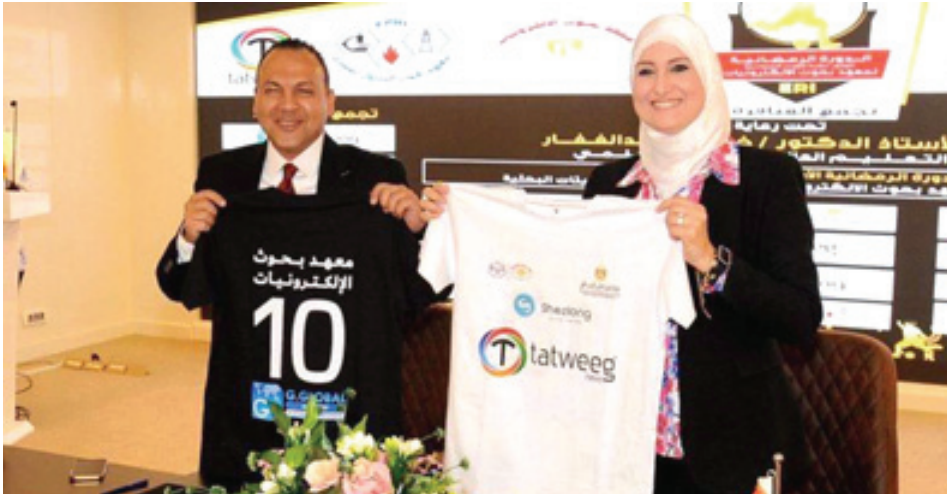
خماسية : بطولة خماسية في مصر للبيئات البحثية