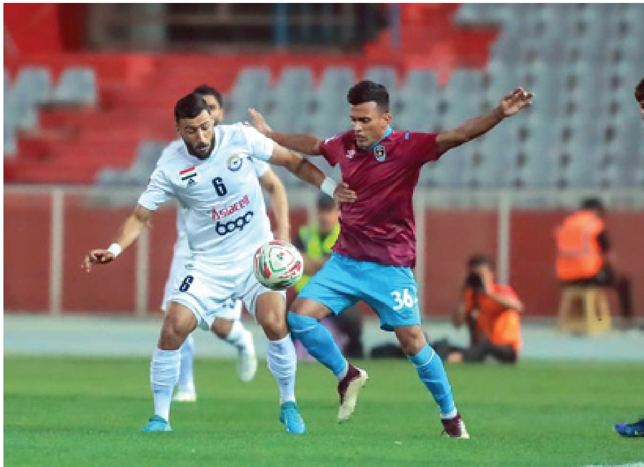
تعثر الزوراء، يتعثر من جديد امام نبط ميسان في الممتاز

تعادل الطلاب و توقفت نتائج الطلاب بعدما أنهوا اختيار نبط البصرة بالتعادل السلبي ليبقوا في الوصافة 53 قبل أن يواجهوا في مباريات أخرى تحديات الخروج للملاعب المحاصفات لكن الأهم متدارك النتيجة السلبية التي بيت لها اصحاب الأرض في تحقيق الفوز الثاني تواليا لكنهم رضوا في