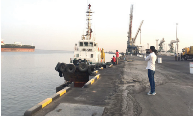
وصول: باخرة تصل ميناء البصرة