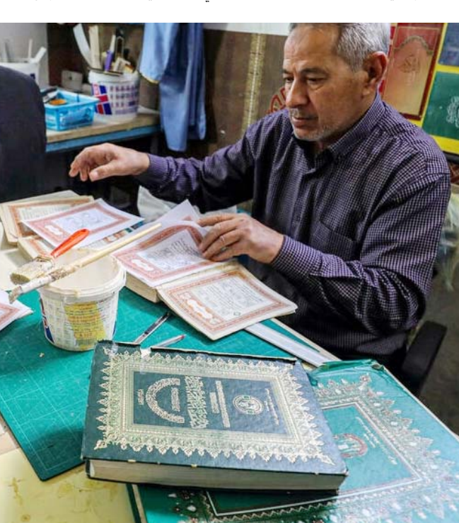
تاهيل: رجل يعمل على تاهيل مصحف قديم في إحدى الورش المخصصة للترميم في ليبيا

الشهر يأتي أعضاء هذا الفريق يومياً إلى طرابلس، ورشة فنية للمصاحف في طرابلس. عشرة أشخاص في العاصمة الليبية طرابلس لترميم المصاحف المرتبطة بمشاعر روحية خاصة خلال هذا