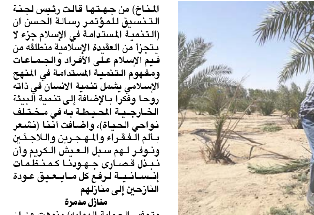
مكافحة: اهد منتسبي الزراعة يكافح سوسة النخيل

الأول لتغيير المناخ الذي استمر لمدة ثلاثة أيام وبحضور شخصيات دولية وممثل عن الأمم المتحدة وكذلك ممثلي المنظمات الإنسانية ومنظمات حقوق الإنسان وممثل منظمة منطوي الأمم المتحدة وعدد من الاقتصاديين الدوليين والباحثين من كافة أنحاء العالم، وقال بيان مركز صوت العرب الدولي للسلامة وخدمة الإنسان أن (المؤتمر كان بادارة وإشراف رئيس المركز الأمين العام للمؤتمر هادي آل نميس والذي كان موضوع المؤتمر عن التغيير المناخي وكيفية إيجاد الحلول للحد من تسريع