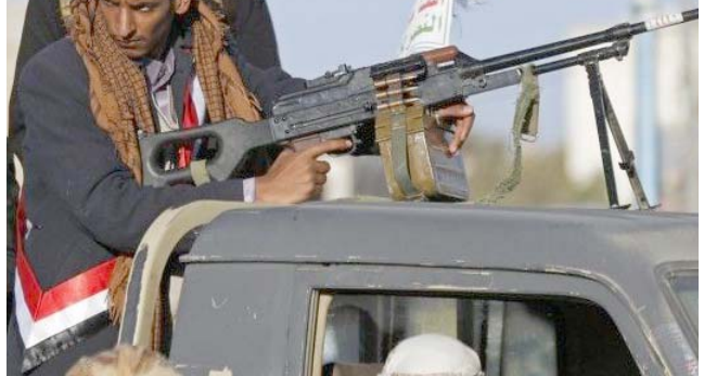
تسلح : مقاتلون حوثيين على سيارة مسلحة

وطنا لإهله جميعاً)، الى ذلك، اعلن وزير الخارجية الإيراني حسين أمير عبد اللهيان، أن التوصل إلى اتفاق في مفاوضات فيينا لإحداة الإتفاق النووي الإيراني لعام 2015 بين بلاده والقوى