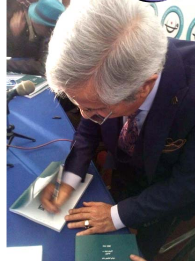
احتفالية: لقطات من حفل توقيع ثلاثة كتب في نقابة الفنانين