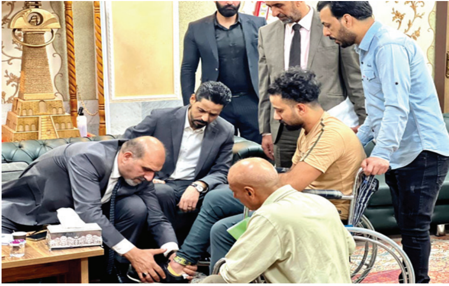
علاج: محافظ ذي قار يشرف على علاج الجرحى