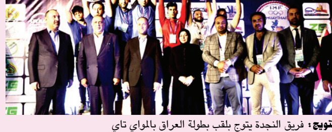
تتويج فريق النجدة يتوج بلقب بطولة العراق بالمواي تاي