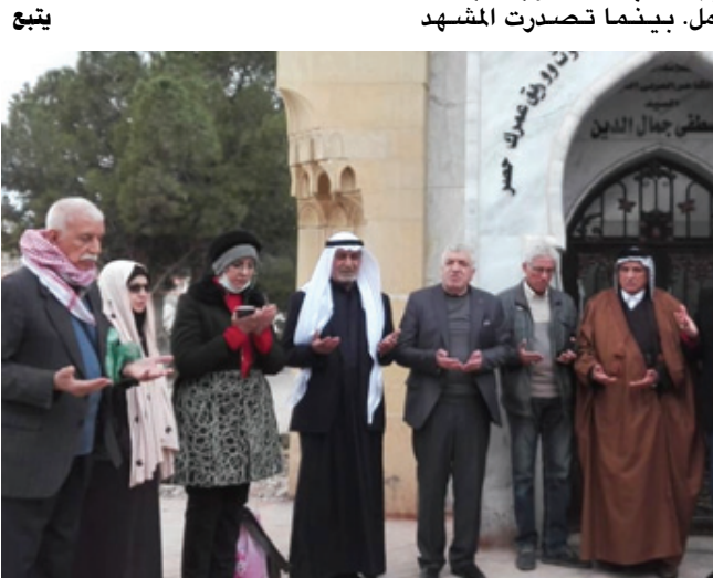
فاتحة: قراءة الوضع القاتح في مقبرة الغرباء،

ظهر يوم الاربعاء ، التاسع من شهر آذار 2022 كنت احط الرحال في مطار دمشق. ضمن مجموعة من الشخصيات الادبية والثقافية والاجتماعية. انتظمت تحت عنوان ( وفد رابطة المجالس البغدادية الثقافية ) . لا اعرف تسلسل هذه الزيارة في قائمة الجوارح للعراق مرات عديدة. وكانت اول زيارة في نهاية عام 2003. اي بعد احتلال العراق باشهر . ضمن وفد كبير : اعلامي وثقافي واجتماعي. وتكررت الزيارات واكثرها لأغراض العمل المكتبي والنشر. وفي السنوات : 2006، 2009 اقامت بشكل دائم في سوريا. اخترت منطقة الهامة ومدى لغرض الإقامة. ونهاية عام 2009 انتهيت الإقامة الدائمة ، ورجعت للعراق . لكنني عدت لزيارة سوريا بين