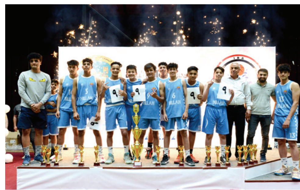
سلة : جانب من تتويج فريق الحلة للناشئين بكرة السلة

بغداد- الزمان توج فريق نادي الحلة بطلاً لبطولة دوري الشباب لكرة السلة بعد فوزه على فريق نادي الخطوط في المباراة النهائية 71 - 83 نقطة على فريق زاخو في نصف نهائي دوري الشباب لكرة السلة . بينما تاهل فريق الخطوط الى المباراة النهائية على حساب فريق الحي في مباراة حملت طابع الندية لتقارب النقاط والاداء للفرقتين انتهت بنتيجة 62-66 .