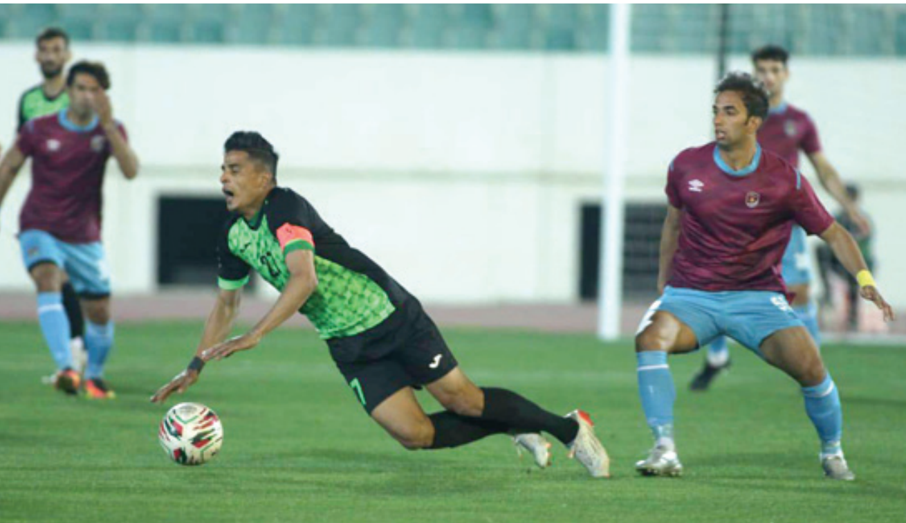
مواجهة: احدى مواجهات فريق النفط في الدوري الممتاز

من فوز كبير على الكرخ ويكون قد استعد في فترة السابغ ساسر سعيد . بقوة .