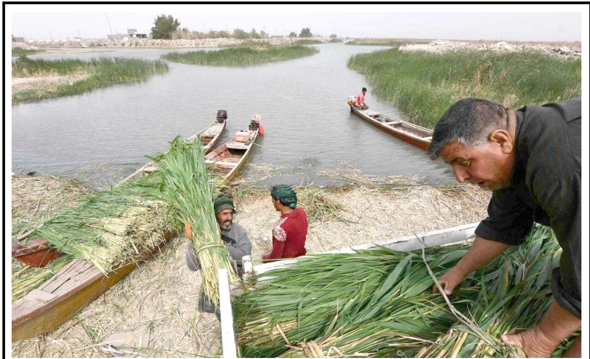
اهوار: اهالي بيداون بحصاد القصب في اهوار ذي قار

بوجودها في البرلمان او خارج البرلمان). مؤكداً (يجب تحقيق التوافق الذي يسعى اليه قادة الإطار التنسيقي عقب مناورة بالثلث الضامن ومنع انعقاد جلسة انتخاب مرشح انقاذ وطن لرئاسة الجمهورية حيث يعول كلا الطرفين على النواب المستقلين للضحي بالاستحقاقات دون خرق المدد الدستورية في جلسة يوم الأربعاء المقبل ، وسط تحذيرات من استمرار الانقسام السياسي الذي قد يؤدي الى اعلان حكومة طوارئ ، في وقت دعا رئيس