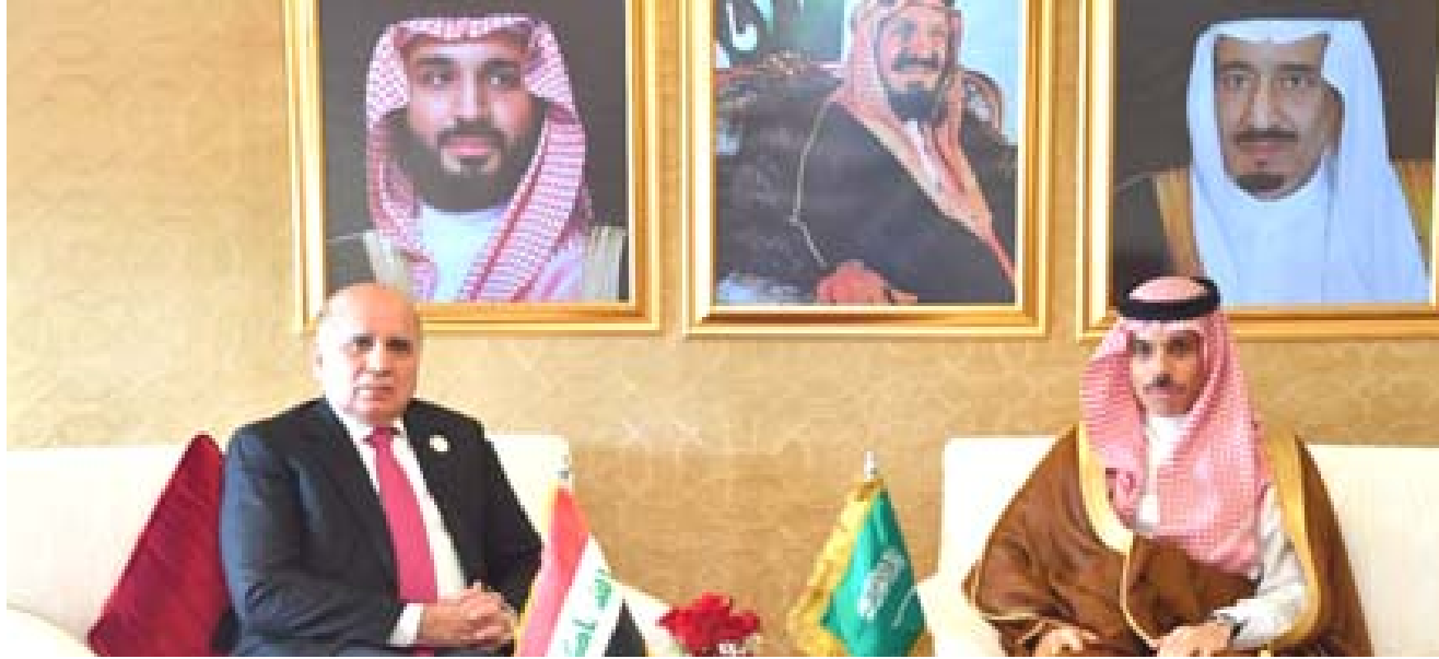
لقاء وزير الخارجية بلقي في الدوحة نظيره السعودي أمس

مصدرين للقلق لدى جميع المستويات الحكومية والسياسية والشعبية. ورقة بيضاء مشيرا الى ان (الهيئة الورقة البيضاء) تتجسد بإعادة التوازن للاقتصاد العراقي ووضعه على مسار يسمح للدولة باتخاذ الخطوات المناسبة في المستقبل لتطويره الى اقتصاد ديناميكي متنوع يخلق الفرص للعراقيين ليعيشوا حياة كريمة باقتراح مجموعة من الإصلاحات والسياسات الشاملة، وحماية