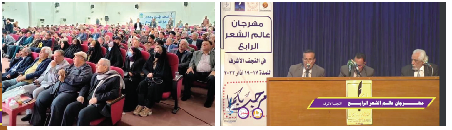
مهرجان ، جانب من جلسات مهرجان عالم الشعر في النجف