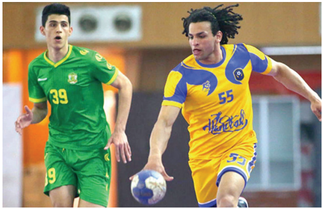
يده جانب من منافسات دوري اليد الممتاز

بغداد- الزمان 32 وفوز فريق نادي ديالى على فريق نادي السليمانية بنتيجة 23-27. كما فاز فريق نادي البصرة على فريق نادي كربلاء بنتيجة 24-34، وجرت امس الجمعة ضمن منافسات الدور ذاته ثلاث