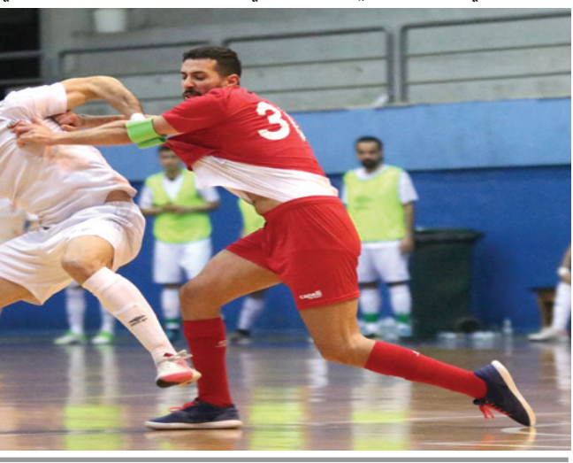
كرة: مباراة العراق ولبنان في كرة الصالات

بيروت - الزمان تغلب منتخب كرة الصالات، على نظيره اللبناني في مباراة ودية اقيمت في قاعة نادي السد