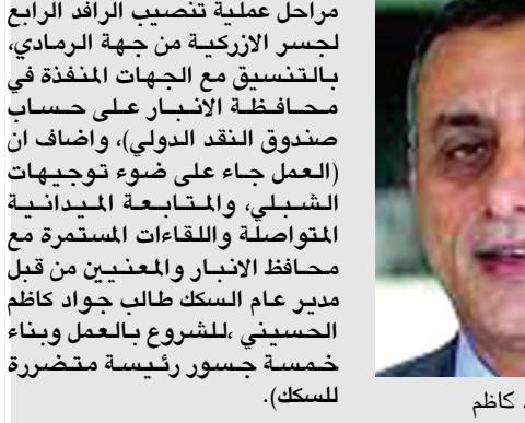
طالب جواد كاظم

بغداد - خلوه محمد بحث مدير عام الشركة العامة لنقل المسافرين والوفود في وزارة النقل كريم كاظم حسين ، مع ممثل البنك الدولي ، تطوير واقع النقل ورسم الخطط الخاصة بدعم مشاريع النقل الجماعي في العراق. وقال بيان تلقتّه (الزمان) امس ان (اللقاء ناقش خطط الشركة التي تسعى لتطبيقها خلال المدة المقبلة ،كما تم التطرق لامكانية دعم مشاريع النقل والخطط الخاصة بالنقل الجماعي في بغداد والمحافظات الاخرى من خلال ما يقدمه البنك الدولي ) . واكد حسين ان (هذه الجهود تأتي لوكالة التطور الحاصل في مجال النقل وضمن التوجهات الحديثة للوزير ناصر حسين البندر، والخطط التي ترسمها ادارة الشركة ، وسعيها المستمر للنهوض بواقع النقل الجماعي في البلاد