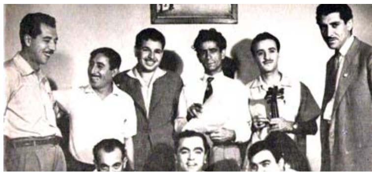
مبدع راحل: مسيرة الراحل رضا الشاطي غنية بالأعمال المتميزة