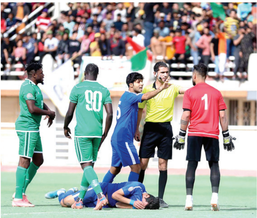
كرة: إحدى منافسات دوري الدرجة الأولى لكرة القدم

طالما مهمته تتحدد في الصراع على الإلتقاء المحلي التي تشكل نقطة الإنطلاق نحو المشاركة الخارجية المهمة جدا وظهرت مشاكل الفريق سوية و لم يقدر ان يتغلب عليها اوبدشو الذي يجد الامور غاية في الصعوبة خصوصا اليوم في الإختبار الآسيوي امام اصحاب الارض المدججين بالمتفرفين والإمكانات العالية .