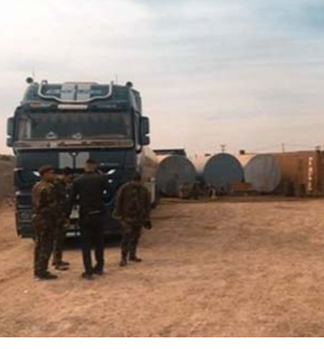
تهريب ؛ ضبط مراب لتهريب النفط في الكمية

الاحادية في وزارة الداخلية، عملية تهريب 7محولات للطاقة الكهربائية في نينوى. وقال بيان تلقته (الزمان) امس انه (من خلال المتابعة المستمرة لقواطع المسؤولية، تمكنت مفازز الوكالة ومن خلال ورود معلومات استخباراتية من القاء القبض على احد المتهمين، الذي ضبط داخل مركبته سبع محولات للطاقة الكهربائية معدة للتهريب في مرورهم بالطرق النيسمية هرباً من سيطرة السدة بالمحافظة)، مؤكداً ان (العملية تاتي تدخل ضمن خطة حماية المنتج وعلية رسم كمركي ، وقد تم اتخاذ الاجراءات القانونية اللازمة، الى ذلك كشفت هيئة النزاهة العامة، عن مخالفات قانونية في منح رخصة استثمارية لمشروع ضخّم في محافظة نينوى. وذكر بيان تلقته ( الزمان) امس ان (ملاكات مديرية تحقيق نينوى، التي انتقلت إلى هيئة الاستثمار في المحافظة، رصدت مخالفات قانونية رافقت عملية منح الرخصة الاستثمارية لإنشاء مشروع سكني ومدينة