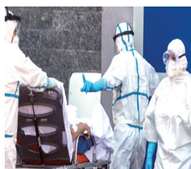
علاج: أطباء يعالجون مصابين بكورونا

باريس- (أ ف ب) - أدت جائحة كوفيد-19 إلى وفاة أكثر من 18 مليون شخص في العالم بين بداية 2020 ونهاية 2021 في حصيلة أكبر بثلاث أضعاف من الأرقام الرسمية، كما كشفت دراسة نشرتها مجلة 'ذي لانست' أمس الجمعة. وقال معدو الدراسة إن الإحصاءات الرسمية حول وفيات كوفيد-19 لا تقدم سوى صورة جزئية عن العدد الحقيقي للوفيات المرتبطة بالوباء في العالم. وكان كوفيد-19 على الأرجح أحد الأسباب الرئيسية للوفاة في 2020 و 2021 وتتحدث الأرقام الرسمية عن 5.94 ملايين وفاة في العالم بين الأول من كانون الثاني/يناير 2020 و 1 كانون الأول/ديسمبر 2021 لكن دراسات عدة قالت إن العدد الحقيقي أكبر من ذلك بكثير وحاولت تقديم الحصيلة الإجمالية للوفاة بشكل أفضل.وأخر هذه الدراسات تلك التي نشرتها 'ذي لانست' وقدرت عدد الوفيات ب 18.2 مليون شخص في