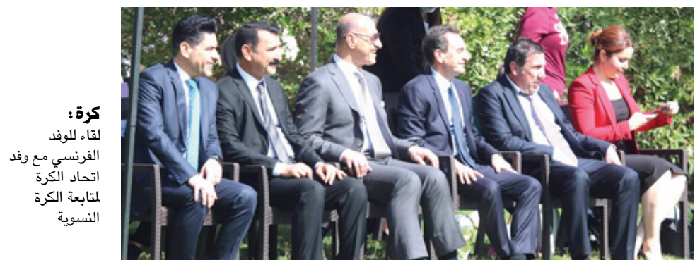
كرة : لقاء الوفد الفرنسي مع وفد اتحاد الكرة المتابعة الكرة النسوية

المشروع هو تطوير وتأهيل القيادات الإدارية النسوية وإشراك المبررات والحكومات مع كل المحافظات في معاشيات مع نظيراتها الفرنسية، كذلك المساهمة والمشاركة في المسكرات التدريبية بالتنسيق بين الاتحادين العراقي ونظيره الفرنسي لكرة القدم بالتعاون مع السفارة الفرنسية في العراق. من جهته، أعرب السفير الفرنسي في العراق، ايريك شوفالبييه، عن سعادته بتوقيع اتفاقية التعاون، مؤكداً إن