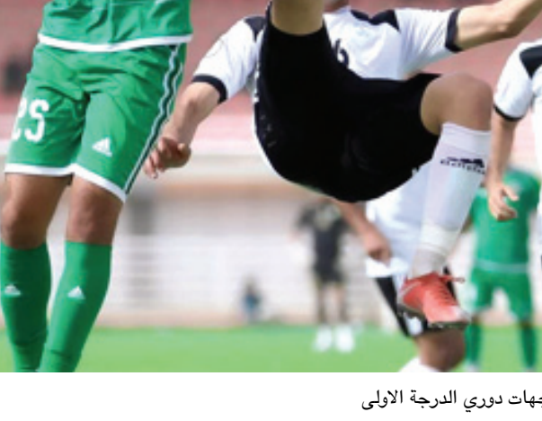
دوري : احدى مواجهات دوري الدرجة الأولى

ودية زامبيا حصل الإتحاد العراقي لكرة القدم على موافقة الإتحاد الدولي الفيفا بإقامة المباراة الودية بين منتخبنا الوطني ونظيره الزامبي في الثامن عشر من الشهر الحالي والتي سيحضرها ملعب المدينة الدولي تحضيراً لمواجهة الإمارات وسوريا ضمن التصفيات المؤهلة لمونديال قطر 2022. يذكر أن الجهاز الفني للمنتخب الوطني قد أعلن، في وقت سابق، قائمة اللاعبين المستدعاة للأنظار والمؤلفة من 28 لاعباً، على أن تُقلص إلى 46 لاعباً قبل مواجهة الإمارات وسوريا.