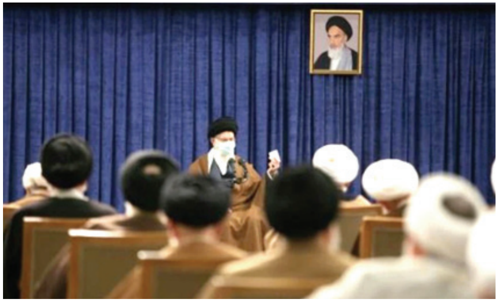
استقبال: المرشد الأعلى الإيراني على خامنئي يستقبل أعضاء مجلس خبراء القيادة

القدرة الوطنية للبلاد، كانت إيران ستواجه مخاطر كبيرة اليوم. وإضافة إلى البرنامج النووي، تدي دول غربية تقدمها الولايات المتحدة وإسرائيل، العدوان السودان وعربية، وبرنامجهما للصواريخ الباليستية. وضعت إيران استراتيجية واضحة للإرتقاء الخسيس أن تكرار اتهامها بالتحلل في شؤون دول عربية بشكل عقبة أمام تحسين العلاقات، وذلك تعليقا على بيان عن اللجنة الرباعية العربية المؤلفة من السعودية والإمارات والبحرين ومصر.