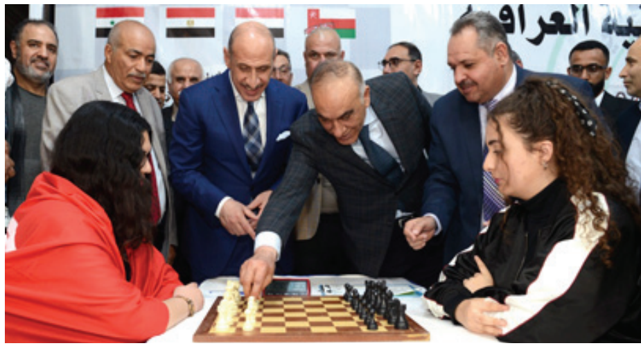
بطولة : جانب من افتتاح بطولة الشطرنج بحضور حمودي ورجال ورجال عديرة : حطشان سليم

والصومال وسوريا ولبنان وفلسطين واليمن وعمان والبحرين والعراق البلد المنظم للبطولة. وقال رئيس اللجنة الاولمبية الوطنية العراقية رعد حمودي ان احتضان بغداد لهذه التظاهرة العربية هو دليل على قدرة العراق لاستضافة المحافل الدولية بنجاح وحضور مثل هكذا عدد من الاشقاء العرب يؤكد رغبة الجمع على التضامن مع العراق في رفع الحظر الشامل عن الرياضة في البلاد. و اضاف حمودي ان الحصار المفروض على الرياضة العراقية اصبح لا مبرر له في ظل وجود الامن والاستقرار الذي ينعم به عراقنا الحبيب من شماله الى جنوبه مقدما في الوقت ذاته شكره الى كل من اسهم في انجاح هذه البطولة. واحتتم حديته قائلا ان استضافة العاصمة بغداد لبطولة العرب بالشطرنج هو نصر آخر يضاف لانجازات الرياضة العراقية التي بدأت تتحقق خلال الالة الاخيرة وتنتقل لتحقيق المزيد في المستقبل القريب.