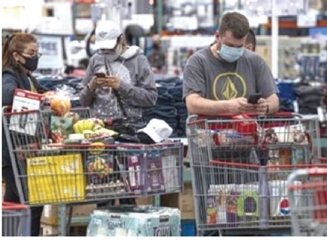
سلع: أميركيون يقبلون على شراء سلع بعد ارتفاع أسعارها