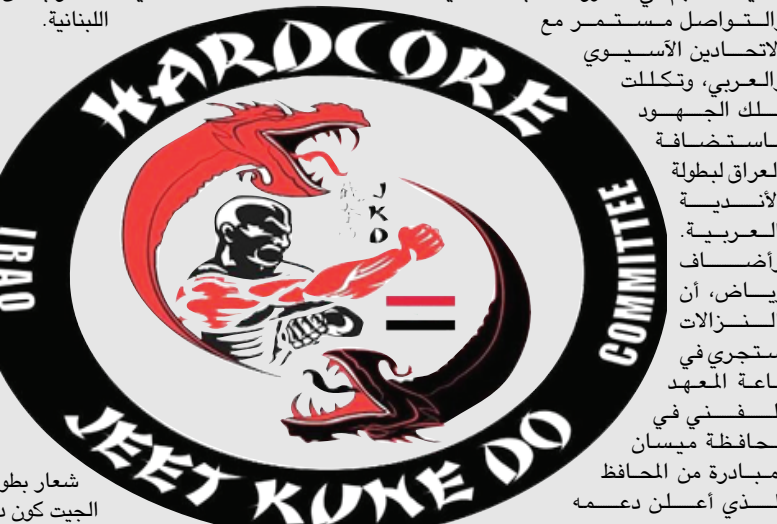
شعار بطولة الجيت كوندو