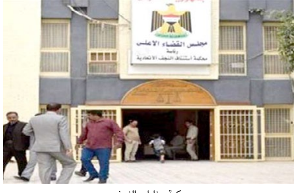
محاكمة جنائيات النجف

بغداد- الزمان أصدرت محكمة جنائيات النجف حكماً بالسجن المؤبد بحق أحد المجرمين بعدما ضبطت بحوزته 6 كيلو غرامات من المواد المخدرة عن جريمة المتاجرة بها. وذكر بيان لمجلس القضاء الأعلى أمس أن (المجرم القبي القبض عليه من قبل مفاز الشرطة المختصة في مفاز غماس بعدما ضبطت بحوزته مفرو غماس بعدما ضبطت بحوزته 6 كيلو غرام من المخدرات المخدرة كانت مخبأة بداخل سيارته).