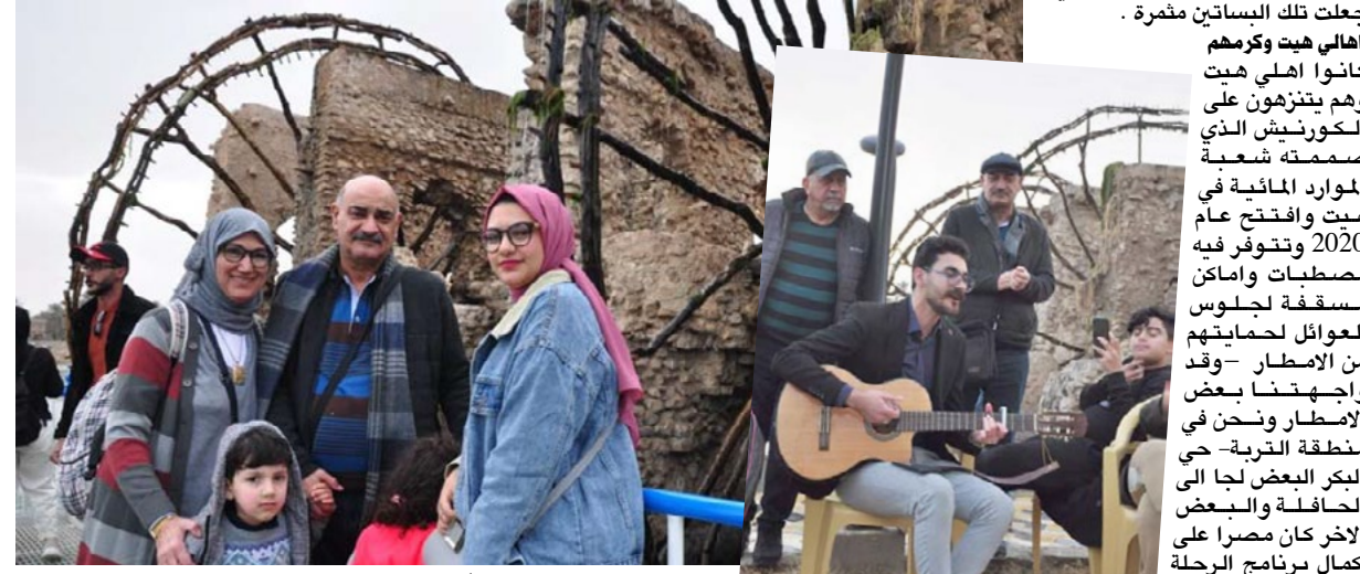
نواعير: العوائل تلتقط صوراً أمام نواعير هيت

بمسك الختام عزف وغناء الفنان موفق عماد. وانا كنت من ضمن المشاركين بالفعاية على الرغم من الامطار الخفيفة: كان الإهالي يقفون علينا التحية بعد احتجاب شيء نحن نبوتنا قريبة ومفتوحة للضيوف، الكورنيش بحاجة الى خدمات مثل النظير في المشاكل التي تواجه المنتج من الجسر فالبعوض يشكو من تاخير اكامل الكورنيش .