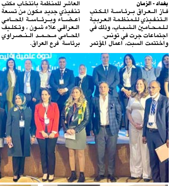
اجتماع: اعضاء المؤتمر خلال اجتماعهم في القاهرة

بغداد- الزمان فاز العراق برئاسة المكتب التنفيذي للمنظمة العربية للمحاميين الشباب، وذلك في اجتماعات جرت في تونس. وأختتمت السبت، أعمال المؤتمر