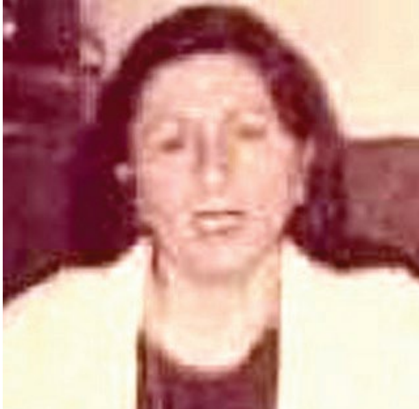
سعيدة يونان صليوة

الوزيرة تلتقت (الزمان) امس ان (تتخل الطلبة بين المديريات العامة للتربية يتم بعد تقديم ما يثبت نقل محل سكن الطالب هو وبغية افراد عائلته بغض النظر عن واقع الحال في ما يخص النجاح او الإكمال، وكذلك يتم نقل الطلبة داخل المديرية في حال نجاح الطالب او إكمالها في محلاتها نصف السنة بدرس (أو درسين) ، و اضاف (يمنع نقل الطلبة من المدارس المسائية إلى المدارس الصباحية أو من المدارس الحكومية إلى المدارس الأهلية)، مؤكداً ان (تسلم طلبات النقل سيستوف بعد 31 آذار الجاري، على ان يتم تزويد مراكز فحص الدراسة الإعدادية والمتوسطة بجميع موافقات النقل لغرض تعديل بيانات الطلبة)، وتابع ان (المديريات العامة للتربية تتحمل مسؤولية خلاف ما جاء بكتاب الوزيرة).