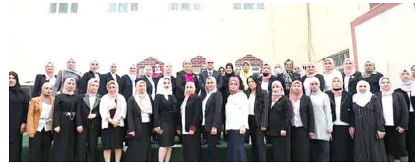
زيارة : وزير التربية يزور اعداية الحريري للبيات مناسبة عيد المعلم

العمل الجاد من اجل النهوض بقطاع التربية في العراق، سواء من خلال سد الفجوة الموجودة في الابنية المدرسية، او من خلال الاهتمام بدعم الملاكات التدريسية والتعليمية، وتوفير بيئة أفضل للتعليم). ودعا (الاسرة التعليمية في العراق، الى بذل المزيد من الجهود من اجل تحسين مستوى التعليم، والحفاظ بركب الامم التي سبقتنا في هذا المجال، متمنياً للجميع المعلمين والمدرسين والأساتذة، النجاح والسداد، وان يحفظ الله العراق وامله من كل سوء). وكانت وزارة التخطيط قد أعلنت عن إنجاز 2160 مدرسة خلال العام الماضي ضمن الموازنة الاستثمارية للمحافظات وصناديق الاعمار تصدتها البصرة مواقع 444 مدرسة لثلاثي نينوى 346 مدرسة، ثم بغداد 144 وتولت كربلاء 6 مدارس فقط فيما كانت حصة وزارة التربية 124 مدرسة. وأكدت الامانة العامة لمجلس الوزراء، وجود مشروعين لمعالجة الحاجة لبناء أعداد جديدة من المدارس والحاجة لبناء المزيد منها وهذا الدور، يستدعي من الجميع،