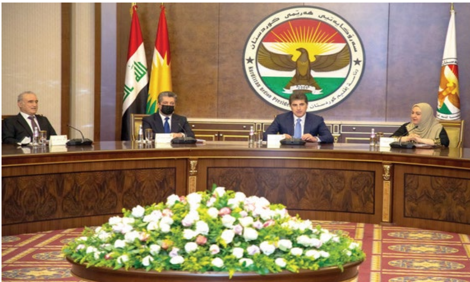
اجتماع، جانب من اجتماع رئاسات الاقليم

الإجراءات القانونية والدستورية اللازمة، وسيستمر مجلس قضاء الإقليم بالعمل من موقعه الدستوري مع المراكز القضائية العراقية للدفاع عن دستورية حقوق كردستان، وتابع ان (حكومة الإقليم هي دائماً مستعدة لحل المشاكل على اساس الدستور وتتواصل الحوار البناء مع الحكومة الاتحادية). حل مشاكل في غضون ذلك ، استقبل رئيس حكومة كردستان ، وفداً عسكرياً أمريكياً برئاسة كبير المستشارين العسكريين والملحق العسكري في السفارة الأمريكية لدى بغداد الجنرال كيث فيليبس. وذكر النيان ان (اللقاء، تطرق الى الوضع العام في العراق، بالإضافة إلى مناقشة سبل توطيد العلاقات بين الإقليم والولايات المتحدة، كذلك تأكيد أهمية تعزيز التنسيق بين قوات البشمركة والجيش ، على (المواجهة الإرهاب)، وانفى الوفد وزيراً للإصلاحات الجارية في وزارة البشمركة، ولا سيما التقدم الحاصل في توحيد وحدات القوات، كما شدد على ضرورة المضي في دعمها وإسنادها).