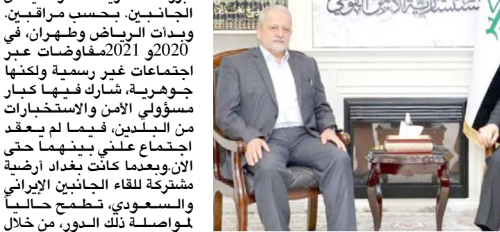
بغداد - فائز جواد مستشار الامن الوطني يلتقي رئيس جامعة الدفاع الإيرانية

بغداد - فائز جواد تحتضن بغداد، جولة المفاوضات الخامسة بين السعودية وايران في اطار التفاهم وإعادة العلاقة التي طبعها بعد طيعة دامت 6 سنوات، فيما اكد مستشار الامن القومي قاسم الاعرجي انه متفائل بهذه الجولة المرتقبة، وذكر بيان تلحقته (الزمان) امس ان الاعرجي استقبل في بغداد، رئيس جامعة الدفاع الوطني الإيرانية اللواء اسماعيل أحمدى والوفد المرافق له، وجرى بحث العلاقات العراقية الإيرانية وسبل تطويرها من خلال التعاون المشترك في المجالات التي تخدم