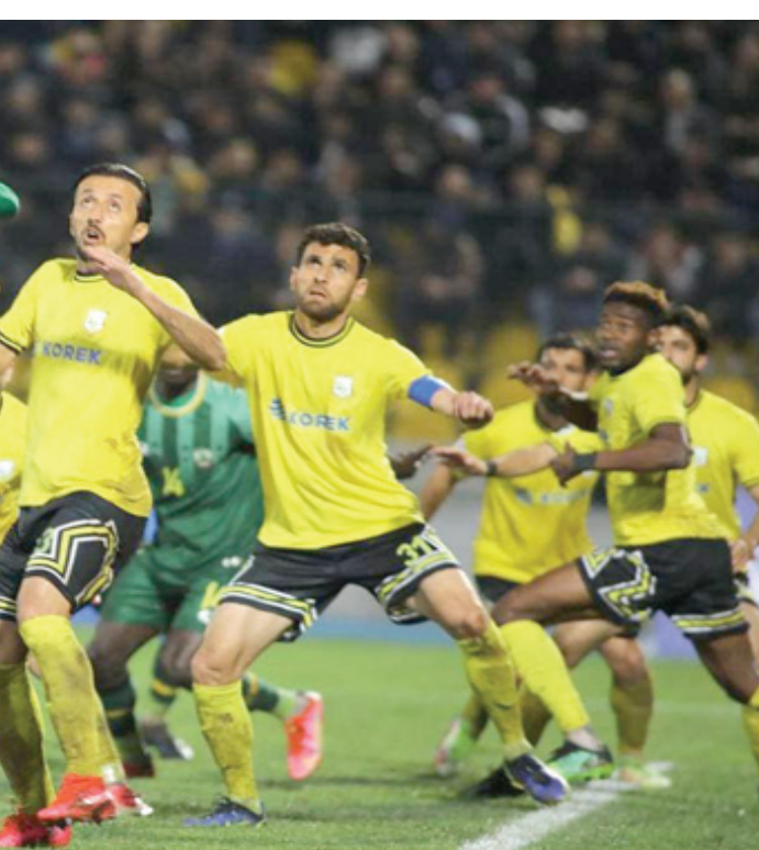
فرق : لقاء ملي، بالاجازات الرياضية بين فرقي الشرطة واربيل

وجدير بالفوز عندما دخل ورفع وجسد شعار الانتصار الذي حققه بفضل الاداء الجماعي للاعبين الذين اتفقوا على تحقيق النتيجة وتجنب مشاكل المباراة التي شهدت احتكاكات بدينية كثيرة