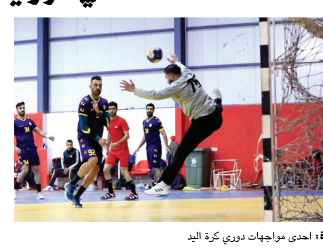
كرة : إحدى مواجهات دوري كرة اليد