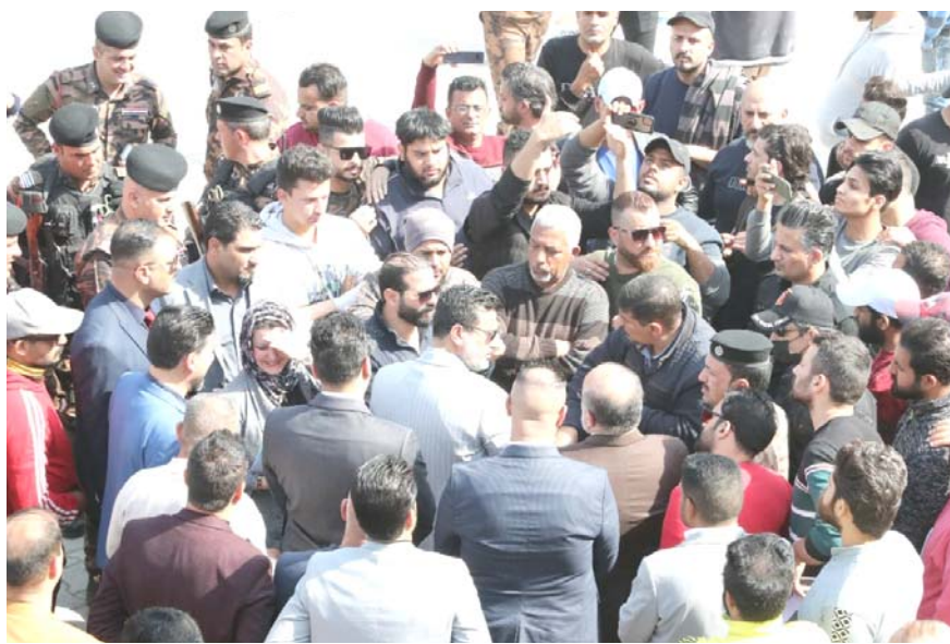
تظاهرة: أهالي ذوي الهمم يتظاهرون أمام مبنى وزارة العدل بوقف الاعانة الشهرية