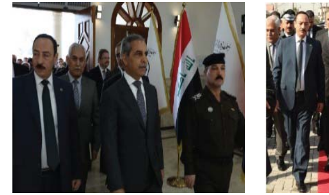
افتتاح فائق زيدان بفتح محكمة استئناف نينوى

بغداد - قصي منذر نيونوف - سامر الياس سعيد