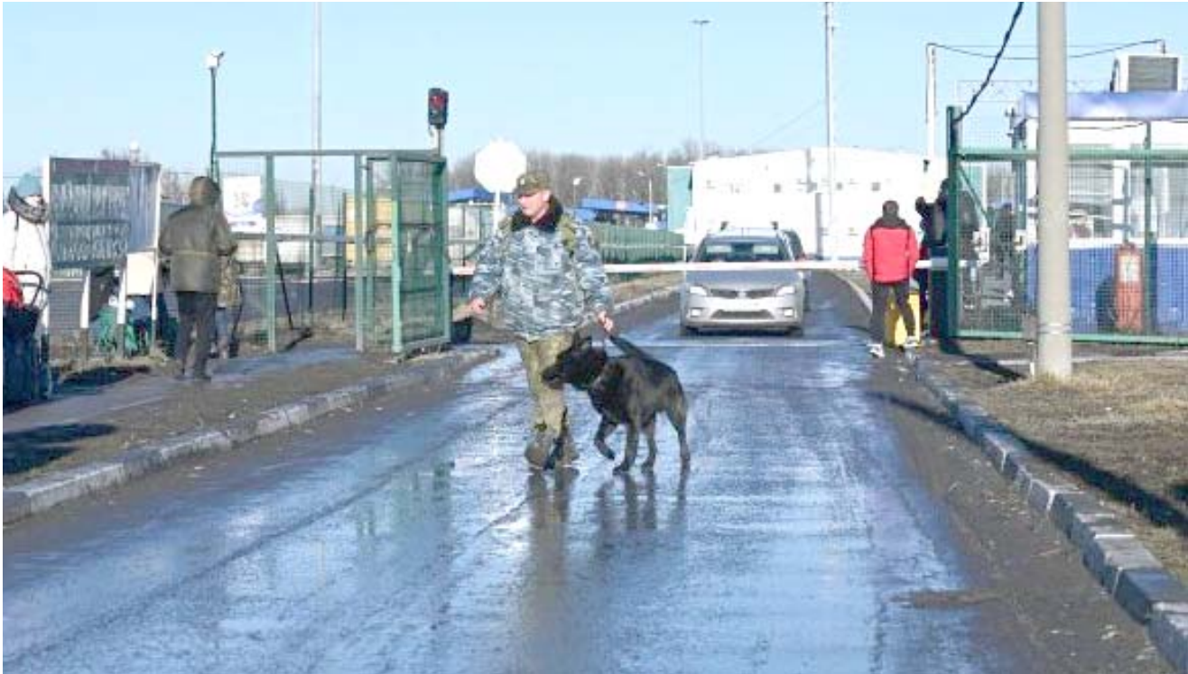
امن: عنصر امني في مركز حدودي روسي

البنتاغون الجمعة أن أكثر من 40% من القوات الروسية المحتشدة على حدود أوكرانيا اتخذت وضعية هجومية، مشيراً إلى أن مرحلة زعزعة الاستقرار التي تقودها روسيا في هذا البلد بدأت وقال المسؤول إن الولايات المتحدة رصدت منذ الأربعة أسابيع من أن روسيا اتخذت خطوات روسية باتجاه الحدود الأوكرانية وتحذر واشنطن منذ أسابيع من أن روسيا ستختلج حاداً ما على الحدود الأوكرانية لتبرير غزو جارتها، وهو ما تنفيه موسكو. وكرر وزير الخارجية الأميركي أنتوني بلينكن الأحد التأكيد أن كل شيء "يشير إلى أن روسيا توشك على غزو أوكرانيا".