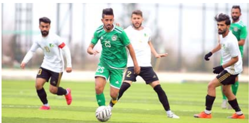
مواجهات: احدى مواجهات الدوري الممتاز لكرة القدم

مرحلة الحسم ويتفوق وثبات والمضي قدما بالمشاركة المطلوبة. تعادل سامراء والصناعة واجه المنتخب سامراء محنة الاصور والتعثر مجددا امام جمهوره الذي ندب حظه العائر لعدم استطاعة الفرقة في تحقيق ولو فوزا واحدا ورغم مرور الجولات بسرعة وتظهر معها مشاكل البقاء بعد العودة الموسم الحالي الافضل في مسار مشاركاته التي تعود لجدلية الثمانيات وقد يتحدث بعض الانصار همسا انها لم تكن عودة موفقة وكان الافضل البقاء في الاولى المرشح للعودة إليها بعدما ادرك التعادل بصعوبة امام الصناعة الاخر الذي حصل على نقطة من ثلاث مقابلات وقد يواجه مشاكل اكبر في ظل تصاعد الصراع مع بداية مرحلة الحسم لكحه لازل افضل الوافدين. خسارة الكرخ ولم يتمكن لاعبو الكرخ من الحفاظ على تقدمهم بـ 37 والعمل على مواجهة الامور بحذر شديد قبل تلقي هدف التعادل 40 وتقبل الخسارة من النقط قبل نهاية المباراة بدقيقتين لتذهب الفوائد مباشرة للضيف المجتهد حيث الفوز والتقدم سابعاً في افضل موقع منذ بداية الدوري حينما استمر محافظاً على صحوته مع اسقاط الكبار ورفع سقف التحديات بوجه الكل امام فرسة التقدم لمكان افضل وهو مرشح له بعدما واصل تقديم الاء والتحسن في كل شيء