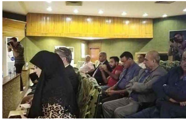
حوارية : جانب من حوارية النخبة