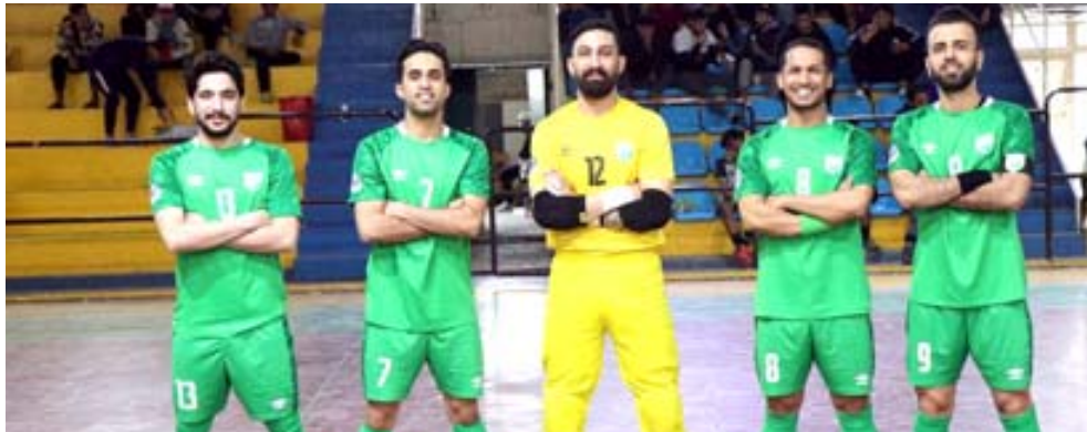
صالات: فريق نفط الوسط لكرة الصالات

وفوز فريق نادي نطف البصرة على مضيفه امانة بغداد بنتيجة 2-0. كما فاز فريق الشرطة على ضيفه فريق المرور 7-5 وفاز الجنوب على مضيفه غاز الجنوب 1-2 وحقق فريق نادي الظفر الفوز على ضيفه فريق نادي الشرقية بنتيجة 4-1 بتسعة اهداف مقابل خمسة اهداف.