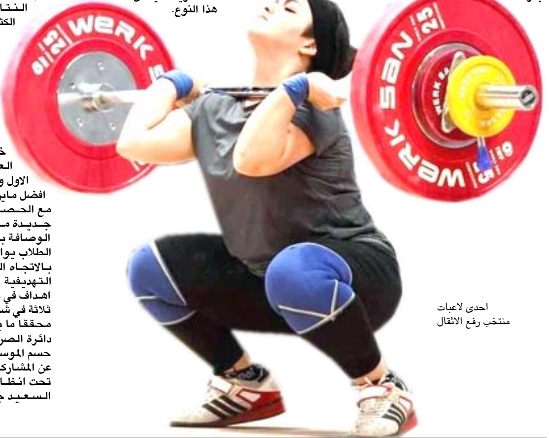
احدى لاعبات منتخب رفع الأثقال