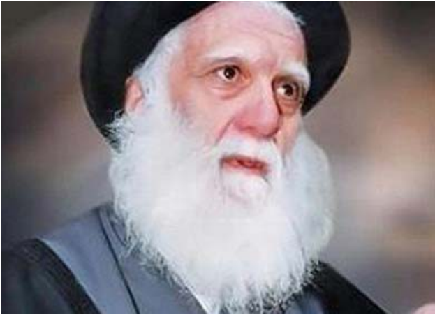
محمد صادق الصدر

الصدر وقال في تغريدة على تويتر، إن (الشهيد الصدر كان صرخة الحق التي انارت طريق الحرية، المجد لذكره الخالدة والسلام لروحه الطاهرة)، وكتب رئيس الوزراء مصطفى الكاظمي في تغريدة على تويتر ان (السيد الصدر قاد انتفاضة قول الحق عند سلطان جائر، وعلى خطى الأئمة الأطهار، استرخص الحياة إزاء الطغيان، فكان من الذين صدقوا ما عاهدوا الله عليه)، وأضاف (سلاماً على ذكره الخالدة في ركب شهدائنا الأحرار)