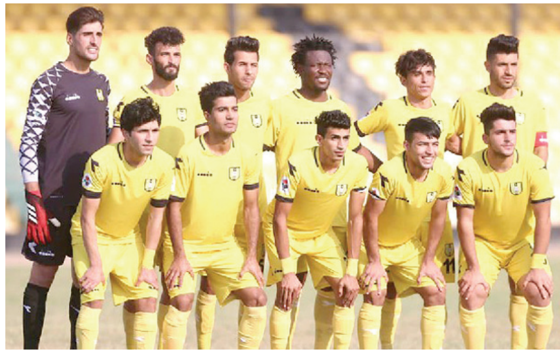
فريق: صورة جماعية لفريق نادي الكرخ لكرة القدم

تضمن دور واهتمام النادي واستعدادها لإبناء النادي الذي دخلوا عنا حيث كانت الاحتفالية التي أقامها النادي بالذكرى السنوية للراحل كريم سلمان قد لانت اهتمام الشارع الرياضي الى جانب المرحوم صباح الكرخي الإداري المخابر الذي كان بحق لوبل النادي اداريا وبشهادة الرئيس ونائبه.