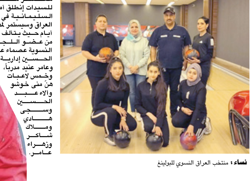
نساء: منتخب العراق النسوي للبولينغ