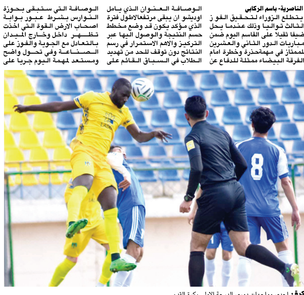
كرة: احدى مواجهات دوري الدرجة الاولى بكرة القدم

الوصافة الععنوان الذي يامل اوديشو ان يبقى مرتفعاًلطول فترة الذي يؤكد يكون قد وضع مخطط ضيفاً قليلاً على القاسم اليوم ضمن مباريات الدور الثاني والخشرين للممتاز في مهمةحذرة وخطرة امام الفرقة البيضاء ممثلة للدفاع عن