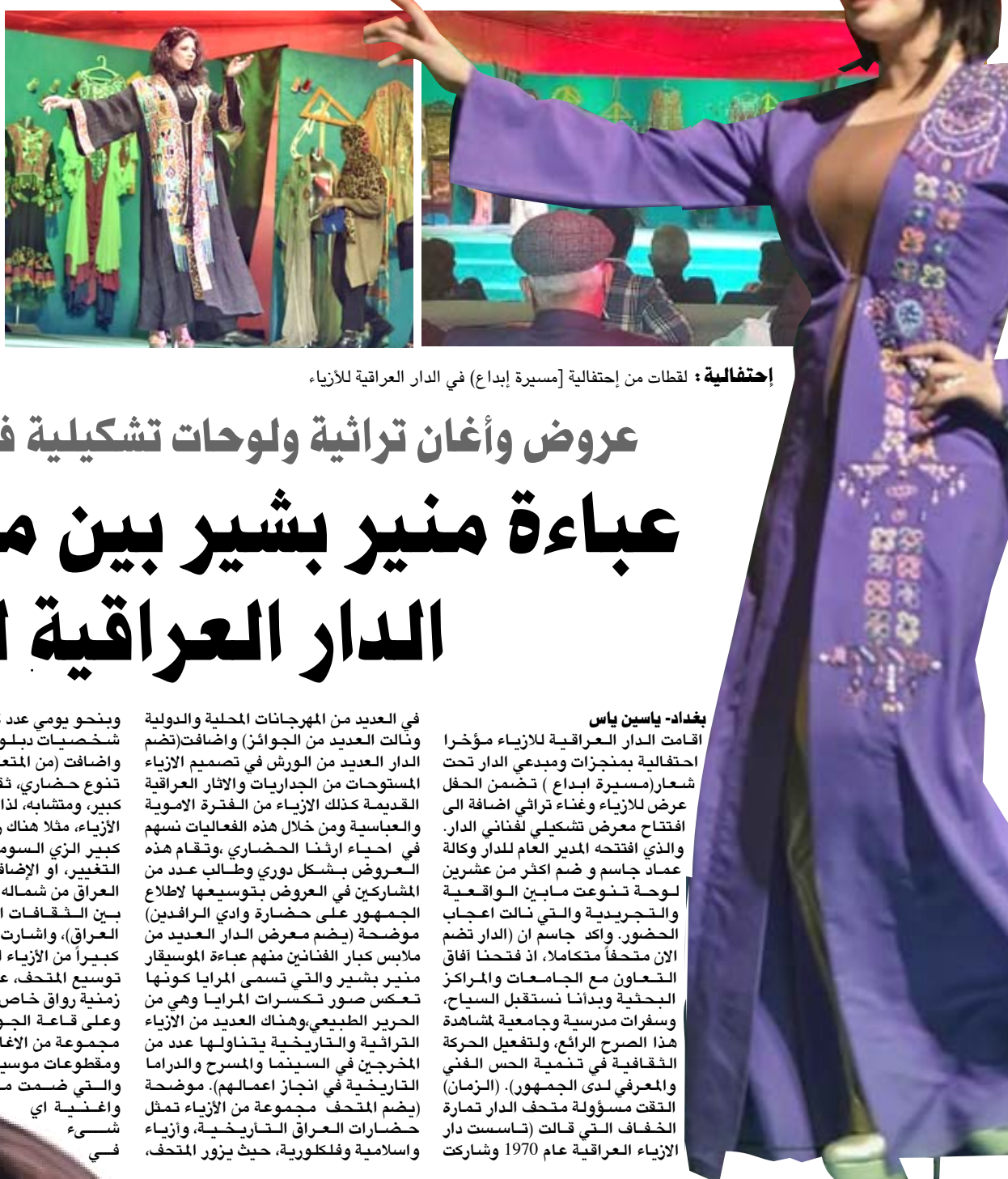
إحتفالية: لقطات من إحتفالية [مسيرة إبداع] في دار العراقية للأزياء