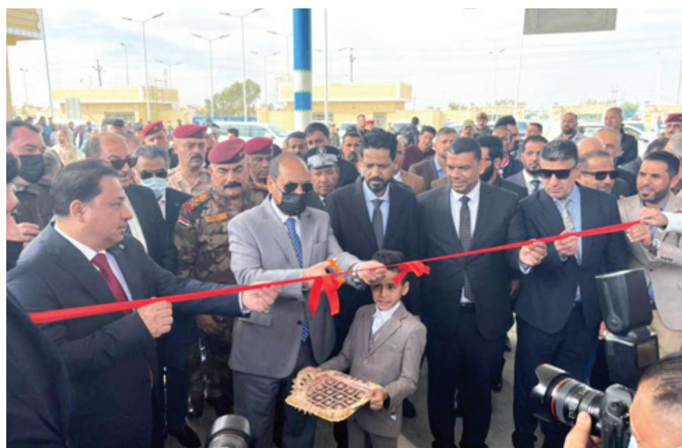
إفتتاح وزير النقل يفتتح مرأب الناصرية الموحد

وقال ان الاجتماع المشترك، جاء لمناقشة عدد من القضايا المتعلقة بالوضع الأمني، مؤكداً على ضرورة العمل بروح الفريق الواحد وتوحيد مهام الأجهزة الأمنية وتعزيز دورها في الحفاظ على الأمن والاستقرار بأحفاظة، وعدم الانزلاق لربح الفوضى. وأشار الى ان الاجتماع خرج بعدد من القرارات التي تخص الجانب الأمني في المحافظة نحو تعزيز السلم الأهلي ومراعاة مصالح جميع أبناء المحافظة.