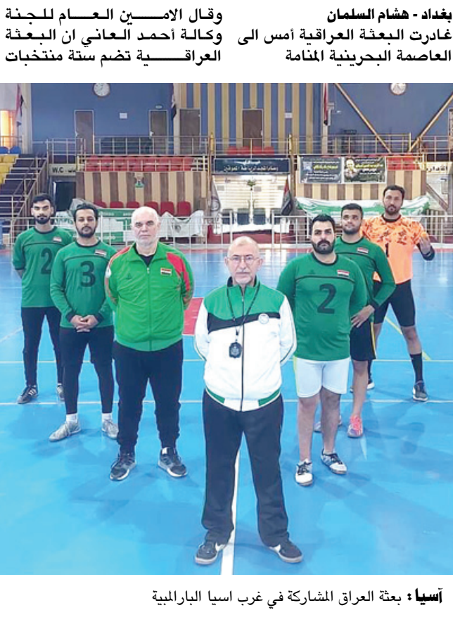
آسيا: بعثة العراق المشاركة في غرب آسيا البارالمبية