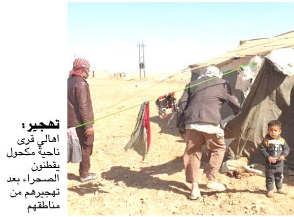
تهجير: اعالي قرى ناحية مكحول بظنون الصحراء، بعد تهجيرهم من مناطقهم

حاتم انه (ستتم إعادة العوائل النازحة من منطقة الصد في جبال مكحول البالغ عددها 95