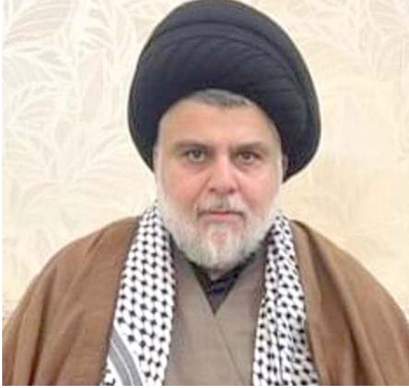
رسالة: الصورة التي وزعها أحد أقرب مساعدي مقتدى الصدر وقال مراقبين انها تطوي على رسالة بعد لقاء قاتني

وكان الصدر قد أكد عقب لقاءه قاتني تمسكة بتشكيل حكومة أغلبية من خلال تغريدته كتب فيها، (لا شرقية لا غربية.. حكومة أغلبية وطنية). ووزع احد ابرز مساعديه صورة وهو يضع بيشماغاً عراقياً تحت عباة، فسرت على انها رسالة زيارة يقوم بها قاتني للعراق منذ الشهر الماضي في مسعى لردم الفجوة بين قوتي الاطار التنسيقي بشأن تشكيل الحكومة المقبلة. وأفادت تقارير اخرى وصفت بالتسريبات بالقول ان (الصدر رفض في لقاءه مع قائد فيلق القدس الإيراني اي حديث عن تشكيل الحكومة وابلغه ان ذلك شأن عراقي داخلي). ودعا الصدر (إيران دعم العراق كدولة من دون التدخل بتفاصيله الداخلية، كما أكد الصدر له باننا نرفض كل التدخلات الخارجية بهذا الاتجاه).