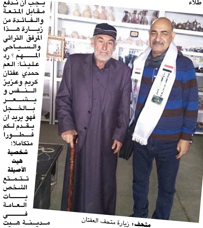
متحف : زيارة متحف عفنان

المباني قديما بشكل اساسي حديث لغراض تجنب التشنقات، ولم اكن اعرف بانني سوف اجد متحفاً للتراث الشعبي هو (متحف الشهيد احمد عفنان للتراث) ليكون 2 إلى مدينة (هيت)، لم يخطر على المهجرة والحليلة، كان الاستقبال مدينة هيت التي تعد العاصمة السياسية للشيوخ ابن مراحل تاريخية متعددة، وتذكرت الكاتب المختر للجبل الراحل مدني صالح كذلك كنت متشوقاً لزيارة منطقة (الشاقوفة) حيث لا زالت النواعير منذ 400 عام وهي تدور لتنقل المياه من نهر الفرات الى البساتين التي تقع في موقع اعلى من النهر واسترجعت معلومة توضح ان كل حضارات العراق والمعامل العمرائية الاثرية كانت لمدينة هيت بصفة فيها لأنها كما يطلق عليها (مدينة النار) وجاءت التسمية لوجود عيون (القبير) التي يتم فيها طلاء