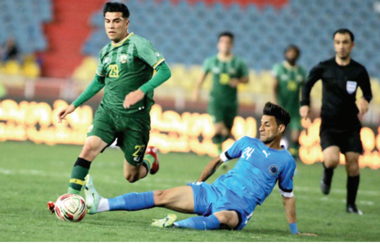
خسارة فريق الطلبة يتعرض الى خسارة من متصدر الترتيب