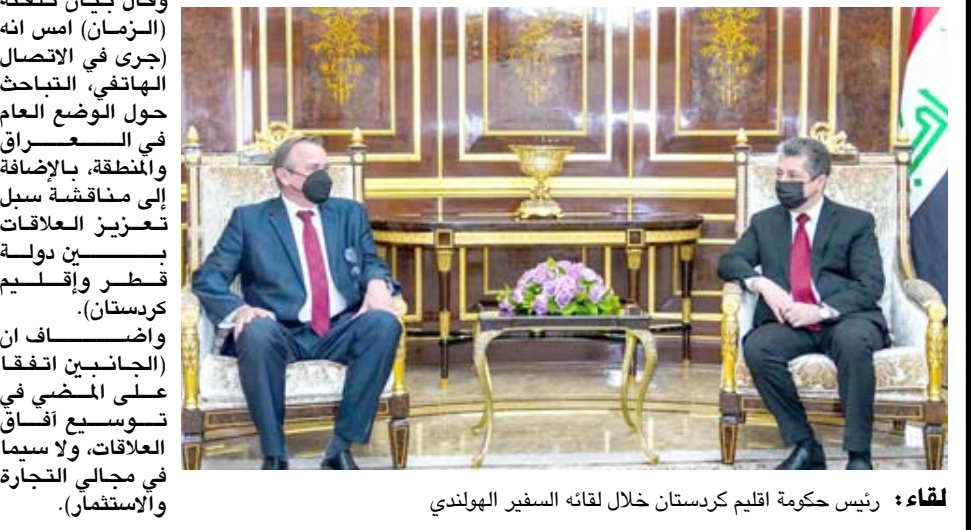
لقاء : رئيس حكومة إقليم كردستان خلال لقائه السفير الهولندي

وقال بيان تلقته (الزمان) امس ان السفير الهولندي ثمن الإصلاحات التي تجريها التنفيذية الوزارية التاسعة، ولا سيما الإصلاحات في مفاصل وزارة العيشمركة، معرباً عن استعداد بلاده لتعزيز العلاقات مع إقليم كردستان، وخاصة في المجالين الاقتصادي والاستثماري.