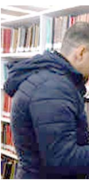
مكتبة : باحث يستطلع الكتب في احدى مكتبات الموصل بعد عودة الحياة لها