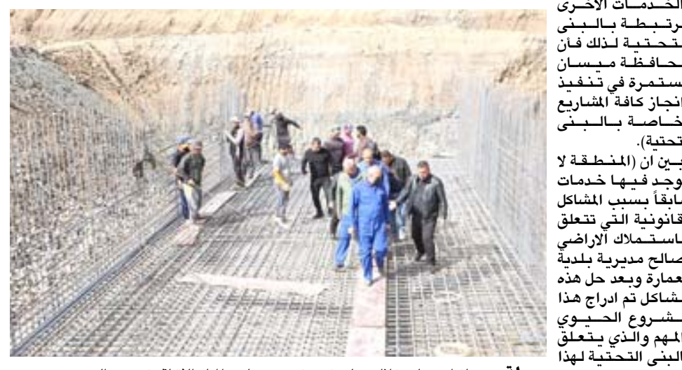
جولة : محافظ ميسان خلال جولته في مشروع مجاري المياه الثقيلة في حي الصدر

المباشرة بمشروع انشاء مدرسة سعة 18 اوصاف وان شاء الله خلال الخطة المقبلة سيتم شمول الحي بالخدمات الصحية وجميع القطعات. واضاف ان (اعمال المشروع تتضمن انشاء محطة ومد خطوط ناقلة وشبكات مياه الامطار والمياه الشفينة وتشبيد مانهولات مختلفة الاحجام مع محطات الرفع وخطوط السدق والمضخات الغاطسة).