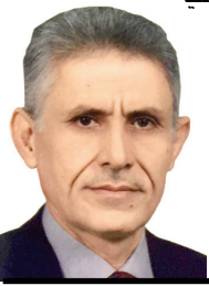
صلاح الدين الجنابي

أُعْلِبُ الزعماء السياسيين البارزين إذا لم نقل كلهم نسمع ونرى منهم يومياً في جميع وسائل الإعلام التقليدي والالكتروني ووسائل التواصل الاجتماعي ما يحدثون به عن الزنازة والشُغفافية والعدل والإصلاح ومحاربة الفساد والحكم الرشيد وانصاف المظلومين ، رعاية الفقراء والمحتاجين ، وتثبيت ركائز النظام، وعدم القضاة ، وترصين التعليم والبناء والإعمار، وضبط السلاح، ولا نهاية لر(الوار) إذا أردنا كتابة كل ما يقولون . السؤال المهم والمحوري هنا إذا كانوا متفقين على قول هذه العبارات والمفردات ما هو المناع أن يجلسوا على طاولة واحدة ويرسموا صورة واقعية لتطبيقها على الأرض من خلال العمل المخلص والوطني لإيقاف التدهور وإنقاذ الناس من البحيرة والتمسكت وعدم الثقة بالمستقبل والارتياك والخوف من جهة وينفذوا أنفسهم من الحرج والتأريخ الذي لا يرحم من يتصدى ولا يستطيع العبور بالنأس لنبر الأمان من جهة أخرى ، ويتكبدوا أوقالهم بالأفعال . وهنا نذكر حديث معلماً وقائداً محمد (صلى الله عليه