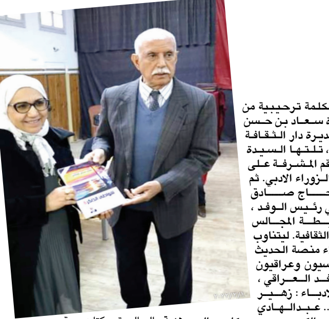
هيدية : السلام يقدم كتابه هدية

شبكة الثقافة الوسط الثقافي التونسي تابع لفعاليات الوقد العراقي . و لان للعراق مكانة اثرية لدى الشعب التونسي عامة ، ولدى المثقفين اصة ، فقد استجبت اسميات ثقافية ، واولها في مبنى بلدية مساكن حيث كان لقاء ترحيبي بالوفد اعقبته دعوة غذاء اقامها مجلس البلدي بمساكن على شرف الوفد . وفي مساء نفس اليوم ، حل الوفد في امسية ثقافية في صالون الزوراء ادبي بدار الثقافة بمساكن . وفي تلك التاليسه الاثرية ، كانت كلمات وقصائد وقراءات شعرية للادباء التونسيين وللادباء اعضاء الوفد العراقي . تخلل ذلك عزف واغاني للفرقة التونسية . وابدع الموسيقار الاعم ، عضو الوفد ، الدكتور سامي هيبال بالعزف وتقديم وصلات راقيّة غنائية ، تفاعل معها الجمهور التونسي . ابتدأت