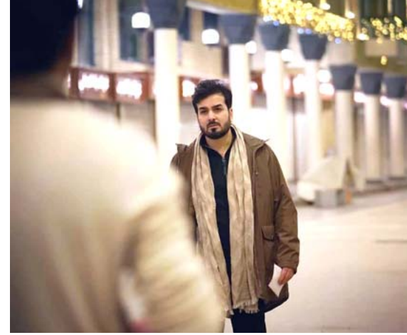
مسيرة : لقطات من مسيرة بسام مهدي الفنية