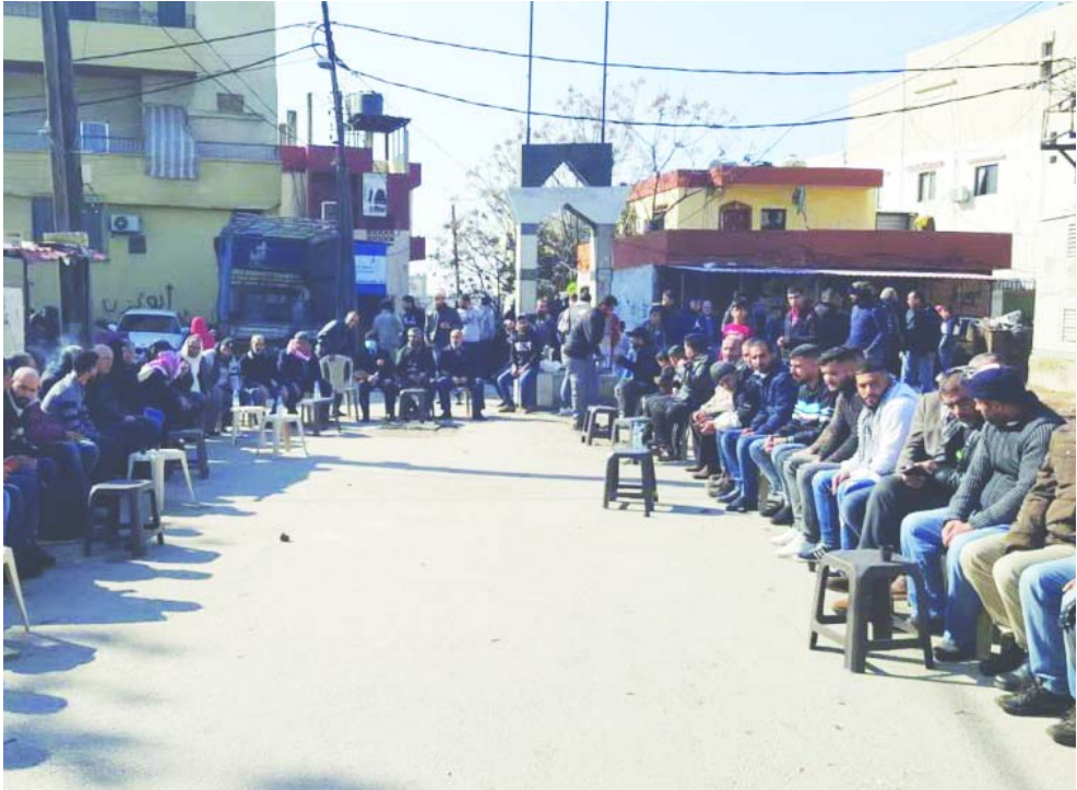
عزاء للبنانيون يصيرون مجلس عزاء في طرابلس

الملاحقة من جهة وجراء الظلم الذي لحق بابناء طرابلس من الملاحقين في ملفات أمنية. عند سؤالها عما اذا كانت تخشى الحشافة بتنظيم داعش في العراق، اجابت والده عمر بتاتر بال تأكيد لدي خوف من كل شيء، لكن اكبر مخاوفه ان يعود الى الدولة اللبنانية. وتابعت ان يموت في المكان الموجود فيه افضل من ان يعود الى هنا، حتى لو كان ذلك يعني انني اتمكن من رؤيته مجدداً.