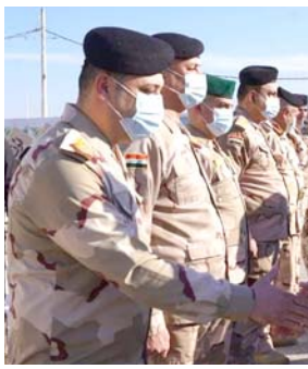
مصافحة: فالح الفياض يصافح قادة الامن في ديالى

قوات الحشد تواصل تقديمها على قدم وساق في جزيرة البو مروص من أجل تحقيق أهدافها المرسومة بالكامل، مبيناً أنه (تم تدمير عدة مضافات لخصائص داعش في الجزيرة تحتوي مواد غذائية وعاكسات لتوليد الطاقة الكهربائية ومواد لوجستية أخرى). وأضاف أن (عناصر هذه الجزيرة بسبب كثافة الأشجار فيها للهروب والتخفي من الملاحقة الأمنية)، مؤكداً أن (قوات الحشد تواصل لليوم الثاني على التوالي عملياتها لتفتيش جزيرة داغش).