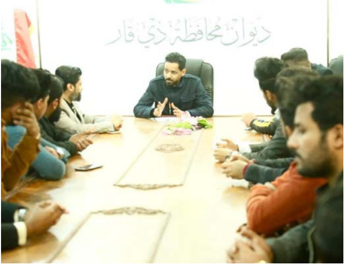
اجتماع : محافظ ذي قار يترأس اجتماعاً