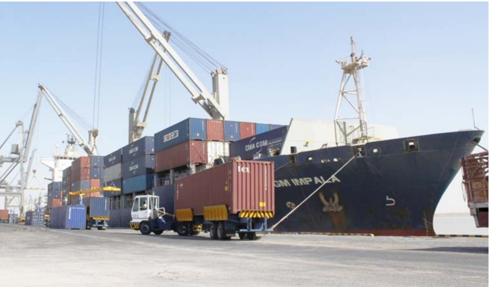
ميناء : بوخر تجارية في ميناء أم قصر

استهداف منظر وقال احمد سليم، انه تم إلقاء القبض على أحد المشتبه بهم في استهداف مطار بغداد الدولي، بالتعاون مع قيادة عمليات ديالى والأجهزة الاستخبارية الموجودة هناك، أثناء محاولته الهروب إلى خارج بغداد وديالى. وأضاف أن (هذا الشخص الثاني بعد من المشتبه بهم في استهداف المطار). والاستقرار في جميع مناطق العاصمة بغداد وحزامها الأمني