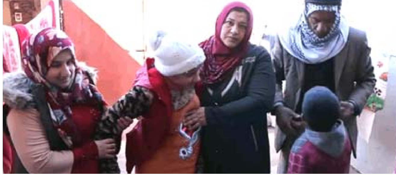
إصابة: الطفلة المصابة بسبب معلمة في نيوى

الذي اختار ان يمتحن هذه المهنة، عليه ان يكون مريضاً آنسانياً قبل ان يكون معلماً او مدرساً، وان يراعي ظروف الطلبة في كل الاحوال المتغاثم العلمي من دون اذى). وقد وافقت ادارة نيوى للتربية والتعليم على ان (الطفلة والتلاميذ جميعهم امانة في رقابتنا ولن ننسج احد بالتجاوز او ابدانهم مطلقاً وسنكون اسند الامن ليصالحهم الى متغاثم العلم من دون اذى).