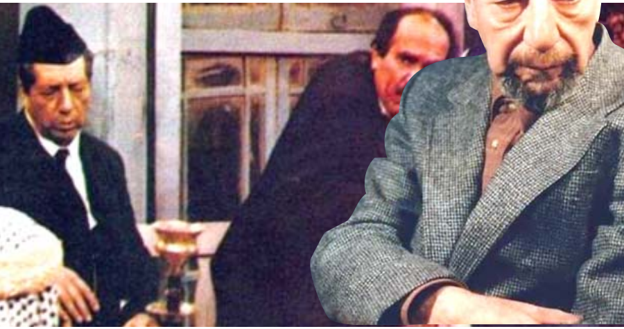
مسيرة: محطات من مسيرة خليل شوقي الفنية