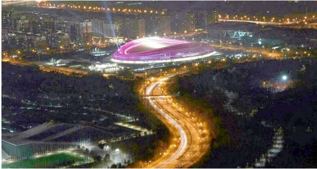
شريط جليدي؛ صورة جوية لمسار مسابقات التزلج السريع (الشريط الجليدي) في بكين