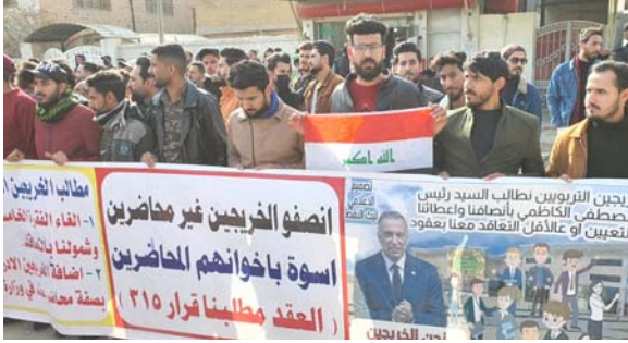
بغداد - الزمان

يواصل معتصمو من حملة الشهاديات العليا حضورهم، امام مبنى وزارة التعليم العالي والبحث العلمي، مطالبين بمعادلة شهاداتهم الحاصلين عليها من خارج العراق وشمولهم بالاجراءات القانونية في الحصول على استحقاقهم العلمي، وقال المتحدث باسم المعتصمين انهم (يواصلون الاعتصام منذ اشهر دون ان يحصلوا على نتيجة او يخرج مسؤولو المفوضتهم)، وناشدوا (وزير التعليم العالي بتشكيل لجنة لهذا الغرض واتخاذهم من معاناة البقاء امام مبنى الوزارة في ظروف جوية صعبة كالبرد الشديد والاطار)، واكدوا (تقديم لائحة مكتوبة بمطالبهم جرى تسليمها امس الى ادارة الوزارة، وانتظرون البت بها). وكان المعتصمات من خريجي التربية في