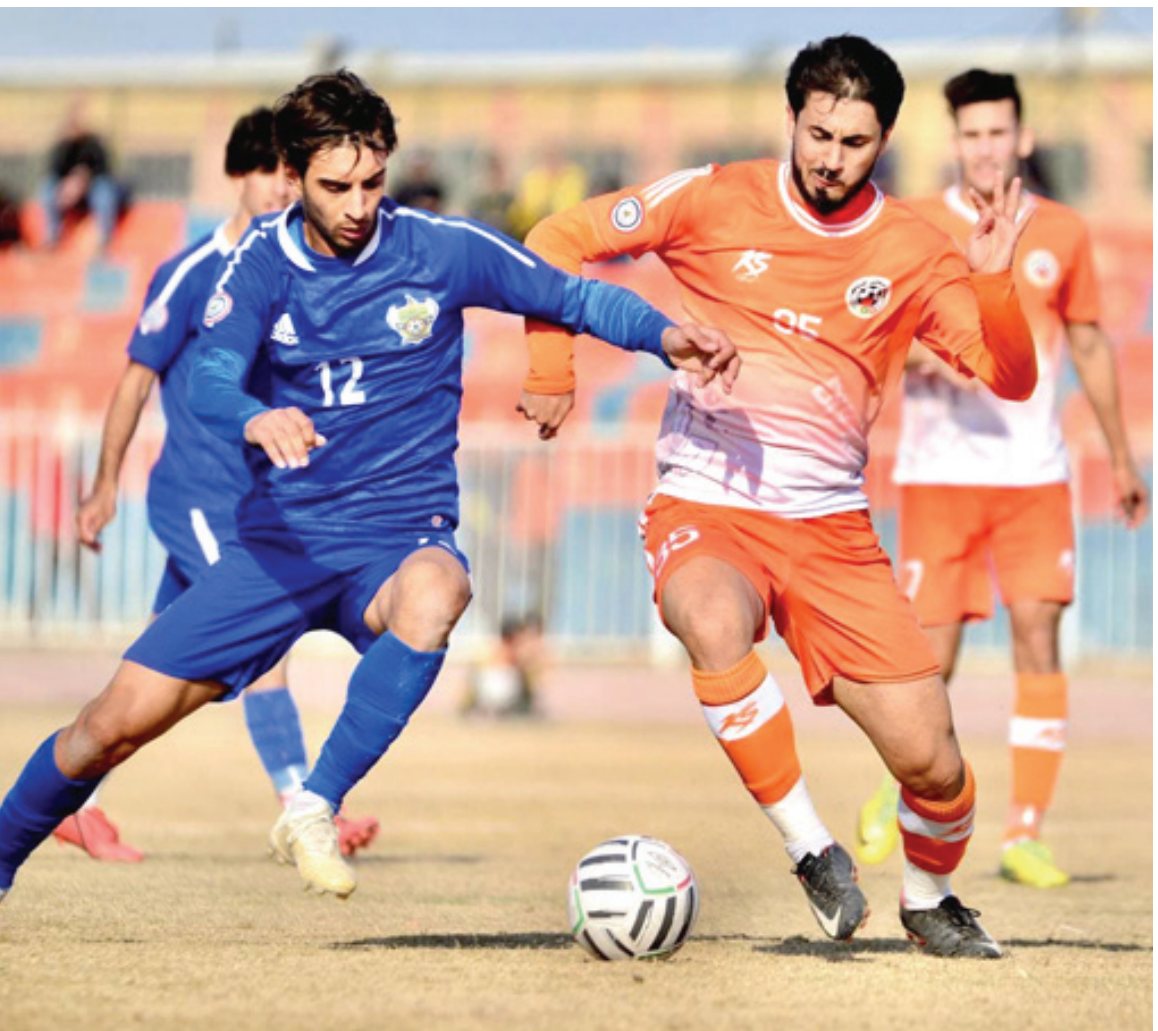
مواجهات : احدي مواجهات دوري الدرجة الاولى بكرة القدم

بأمل الخروج بكامل النقاط املا في تفادي البقاء في منطقة الهبوط. الجمعة الثانية ومتوقع ان تستمر بقوة منافسات المجموعة الثانية وعمل الثلاثي والكل برصيد واحد 25 تفكيك وتغير المواقف عندما يخرج الثالث كربيلاء المتوقع ان يواجه صعوبة عند مواجهة المتصدر البشمركة امام اهمية وطبيعة اللقاء وثانيه المشترك والحاجة إلى مضاعفة الجهود لسرقة موقع الريادة التي سيدافع عنها اصحاب الارض من اجل تجاوز احد الاختبارات المصرية والعودة للمكان الذي قد لا يعود إليه اذا سقط تحت انظار جمهوره. امال الوصيف ويأمل الوصيف الناصرية الذي يمر بأفضل حالاته بفضل وتقدم سريعاً بعد تغير الختاج والسير بها بثقة في ان تاتي نتيجة السليمانية لمصلحةه كونه يظهر المؤهل لخطف وضيف الممثل العلم بدون فوز للان سوق الشيوخ ما قبل الأخير وكلاهما