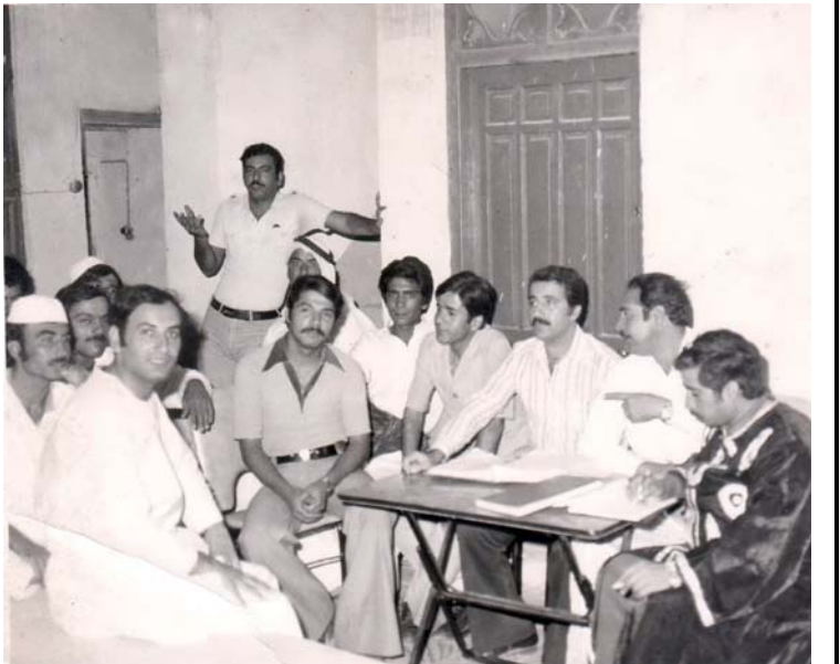
مسرحية قدمتها فرقة كربلاء