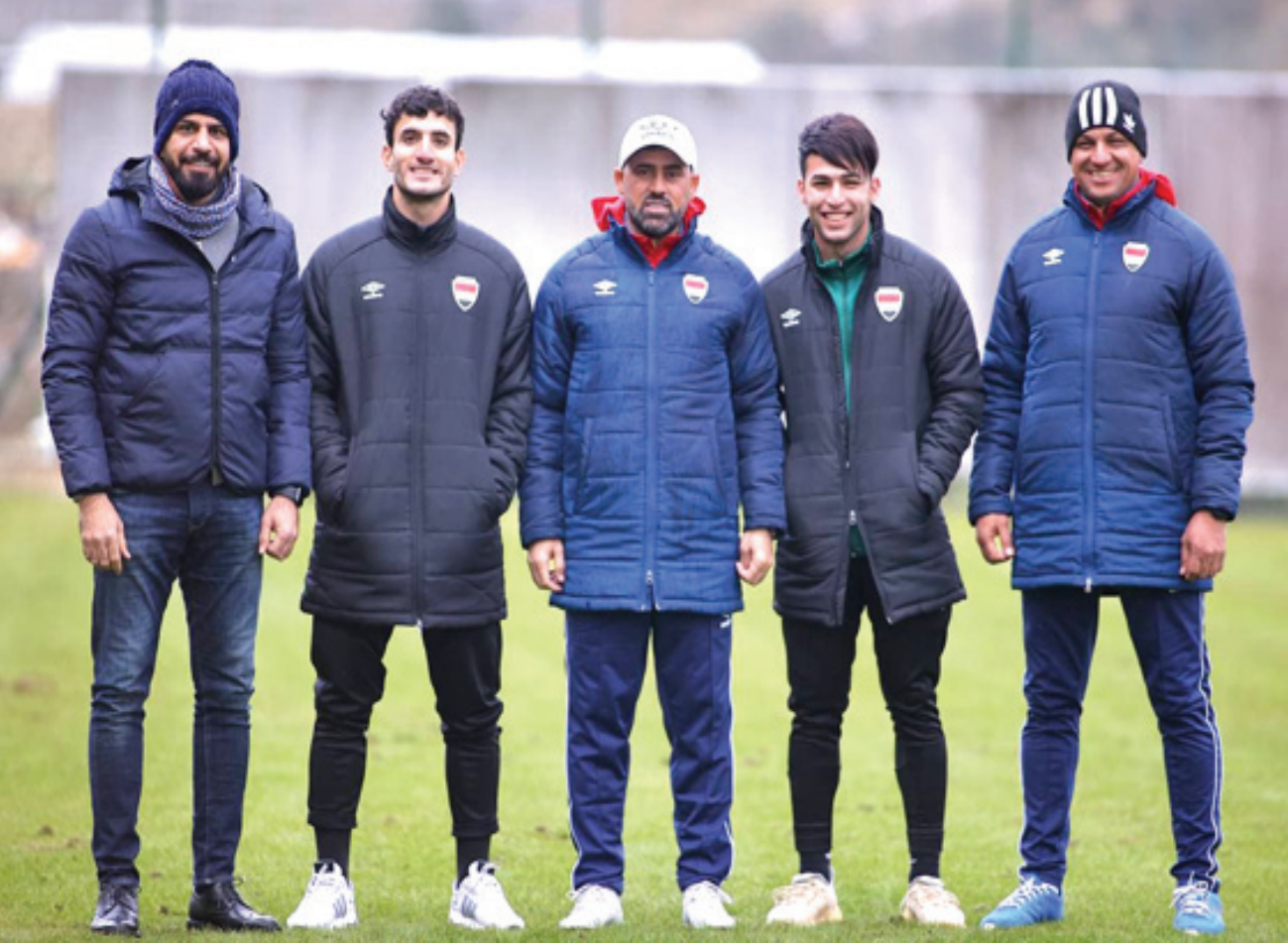
منتخب؛ الكادر التدريبي لمنتخب الشباب