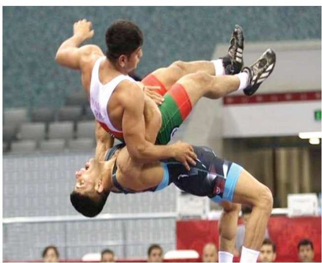
مصارعة، جانب من منافسات المصارعة المحلية