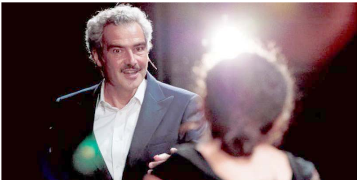
مشهد من مسرحية (اي ميديا)

كل مكان وزمان، كالعنصرية والصراع السياسي وصراع التيارات وحرية التعبير والزواج المختلط واعتمد السام الفاضل عن هذا العمل بجوائز عربية عدة أسلوب الراوي، متخدلاً مراراً في المسرحية، ومتخذاً بسلاسة الى تقمص شخصية الزوج ومن ثم كبريون ملك كورينثيا. وشاء السام ان تكون سينوغرافيا العرض التي وضعها اريك سوابيه متكشفة تقوم على قضاء خييم عليه اللون الاسود. اما الموسيقى فغير تقليدية، قوامها الحان من التي الرق والتمزج أحياناً بنغمات الكترونية او بقرعة نضول السكاكين التي توجب الحظاظ الدرامية. وكذلك تخفي الأناشيد الجنائزية والشاعرية التي ألفها الشاعر الكويتي عبدالله السرحان وتؤديها عمران جرعات وسبق للسام ان أخرج (طقوس الإشارات والتحولات) للكاتب السوري الراحل سعد الله ونوس، وكانت عام 2013 أول عمل عربي يذرع في برنامج فرقة الكوميدي فرانسيس المسرحية العربية. وتوجه اي ميديا بعد بيروت الى محطات عربية أخرى، وفي بداية الصيف تحضنتها خشبات نابولي الإيطالية التي شارك مهرجانها في الإنتاج.