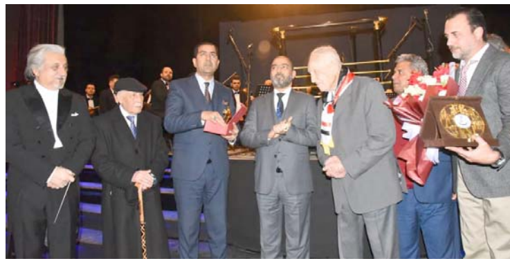
تكريم : الموسيقار الراحل منذر جميل حافظ أثناء تكريمه

وتغيير الحكومات التي مر بها بلدنا والخميلة حافظنا على مسيرتها وهذه المناسبة اناشد وزارة الثقافة والفنون والاعلامية بالشفاء العاجل وقالت مصادر من العائلة ان (حالة السماوي تبدو حرجة حيث يعاني من اضطراب في القلب). والسماوي من مواليد مدينة السماوة بمحافظة المثنى عام 1941 واسمه ناصر عليوي واسم الشهرة ناظم السماوي، تربي في بيئة شعرية حيث كان والده ناصر عليوي ال مشتل الخفاجي شاعراً وراوداً حسيباً بقي لأكثر من أربعين سنة يسافر من مدينة الى اخرى ليقرا شعره في المناسبات الدينية و كان يصطحب ابنه ناظم معه الامر الذي اسهم بشكل كبير في بلورة موهبته الشعرية منذ نعومة اظفاره. وتخزن الذاكرة الفنية العراقية بانتهروا اجمل الغنقيات التي هي