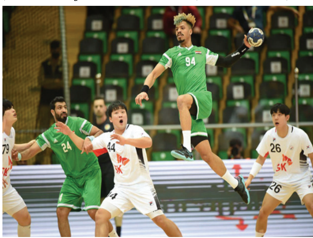
نظيره يد العراق امام نظيره كوريا الجنوبية

بغداد- الزمان أخفق المنتخب الوطني العراقي لكرة اليد، في التأهل لكأس العالم اثر خسارته، امام كوريا الجنوبية بفارق هدفين 26-24 هدف. وانتهى الشوط الاول بتأخر المنتخب العراقي لكرة اليد امام نظيره امام نظيره كوريا الجنوبية للفوز في التأهل إلى بطولة كأس العالم، لكن تكرر لعدد من اللاعبين، فلا يجب ان تهدر.. أما (المرمن) بتروفيتش والاتحاد فانهما لا يمكن كما أسلفت مؤهلات القيام بواجباتهما.. لا يعطيه.