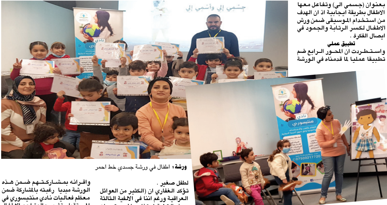
ورشة أطفال في ورشة جسدي خط أحمر