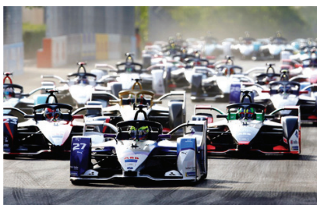
درعية؛ سباق الفورمولا إي الدرعية

فريق روكيت فنتوري ريسينغ- موناكو، بينما حل الهولندي روبين فرينجنز سائق فريق إينشيفجن ريسينغ البريطاني في المركز الثالث. يشان إلى أن منافسات الموسم الثامن من سباقات بطولة العالم إي بي بي فيا فورمولا إي، قد بدأت بالجولة الأولى أمس الجمعة وفاز بها الهولندي نيك دي فريز قبل أن يحل في المركز العاشر في المرحلة الثانية اليوم بعد تعرضه لشاكل تقنية، فيما حل زميله البلجيكي ستوفيل فاندون في المركز الثاني وجاء البريطاني جيك دينيس سائق أفالانش أندريتي، في المرتبة الثالثة. وشهد سباق فورمولا إي الدرعية 2022 اهتماماً إعلامياً كبيراً على المستويين المحلي والدولي، حيث تم بث الحدث عبر 63 قناة في 150 دولة، فيما بلغ عدد وسائل الإعلام التي حضرت لتغطية سباق الدرعية أكثر من 50 وسيلة إعلامية، إضافة إلى 110 إعلاميين بين محررين ومصورين.