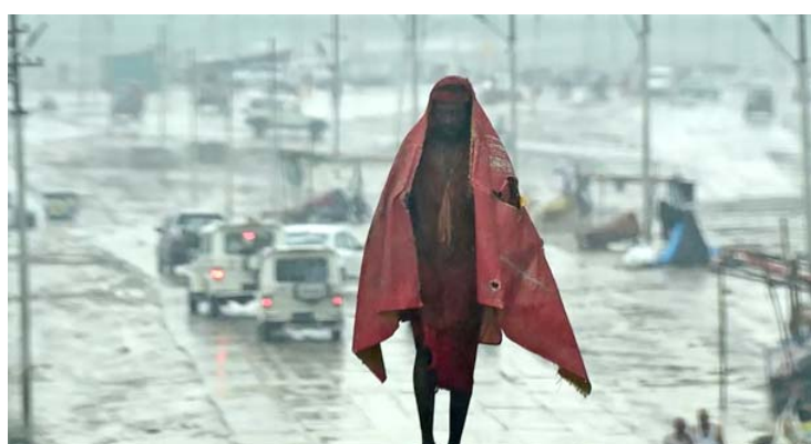
صقيع: هندي يتدثر من موجة صقيع تحتاج بلده

بغداد - فائز جواد أودت الأحوال الجوية السيئة في أوروبا والبرازيل والهند، بحياة عشرات الأشخاص، متسببة بانقطاع الكهرباء وفوضى بحركة النقل، فيما رجح متنبئ جوي، انتهاء الأمطار ظهر اليوم الثلاثاء. وكتب صادق عطية في صفحته على فيس بوك أمس ان (الحالة المطرية تنتهي قبل ظهر اليوم، مصحوبة بتحول الرياح تكون مغيرة للغبار في غرب جنوب البلاد)، وتابع انه (متوقع انخفاض درجات الحرارة بامدن كافة، لتستمر حتى يومي الأربعاء والخميس وتعود لترتفع يوم الجمعة المقبل).