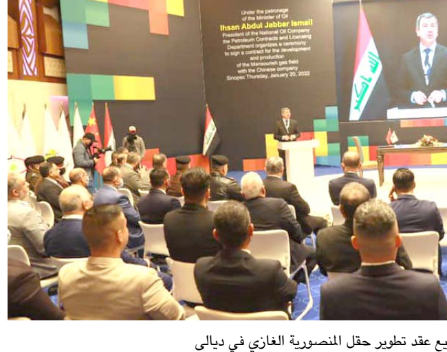
كلمة: وزير النفط يلقي كلمة خلال حفل توقيع عقد تطوير حقل المنصورة الغازي في ندالي