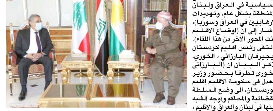
لقاء: رئيس الحزب الديمقراطي الكردستاني يلتقي في اربيل وزير العدل اللبناني

السلطتين القضائيتين اللبنانية والعراقية والاستفادة من خبرات الطرفين، حيث تم التأكيد على أهمية استقلالية السلطة القضائية اللبنانية). مؤكداً ان (الجانبين اتفقا على ان استقال القضاء هو، الأساس لبناء الثقة بين الطرفين (اللقاء ناقش المستجدات الأخيرة في الأوضاع السياسية والأمنية في العراق ولبنان،، إذ قدم الوفد نذرة عن جهود الحكومة اللبنانية لتسليح الأوضاع الاقتصادية الصعبة والأزمات التي يمر بها