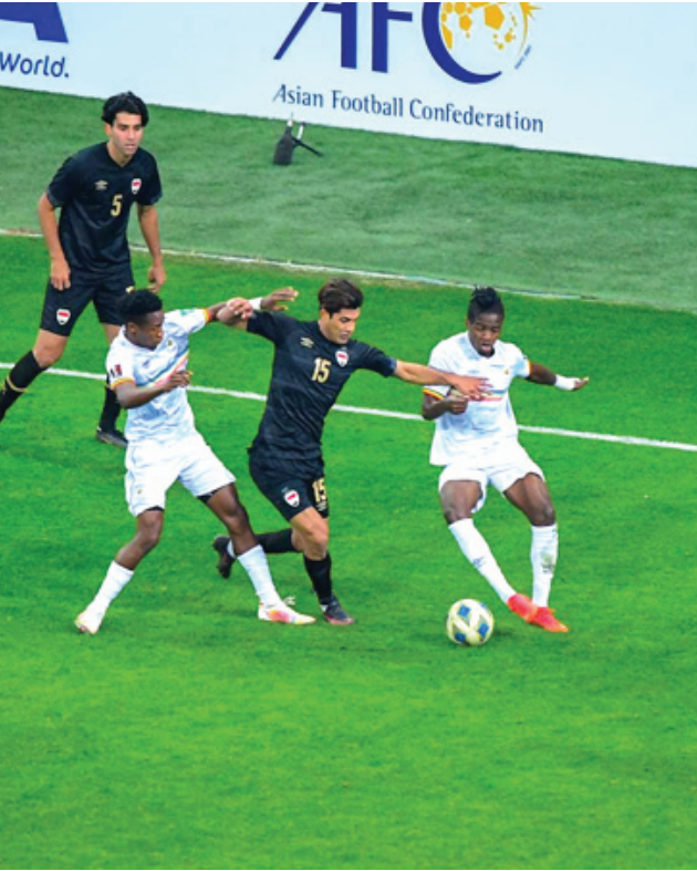
منتخب، جانب من مباراة المنتخب الوطني التحضيرية قبل مواجهة إيران

مهمة الوطني وبما لم يتحلى لاعبي المنتخب بالمسؤولية والانسباط وبخول مباراة الخميس بثقة عالية وليس كما حصل في لقاء المرحلة الأولى التي خسر فيها كل شيء حتى فقد دعم الشارع المناقم على النتيجة وبما لم ان ينخفض