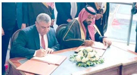
توقيع: المجلس التنسيقي العراقي السعودي يوقع اتفاقية مشتركة

قريباً وقال الغزي خلال الملتقى إن (التعاون بين البلدين مستمر انطلاقاً من توجيهات رئيس مجلس الوزراء مصطفى الكافظمي بحضور دعم روابط الأخوة والتعاون الاقتصادي المشترك)، وأضاف إن (سياسة ومنهجية الحكومة المتعاقبة السابقة والحالية بدعم المجلس التشريعي العراقي السعودي، هو لقطاعه البلدين انها بداية صفحة جديدة بين العلاقات التاريخية، وفعلاً أثمر المجلس عن تأسيس مجلس الأعمال المشترك بين البلدين).