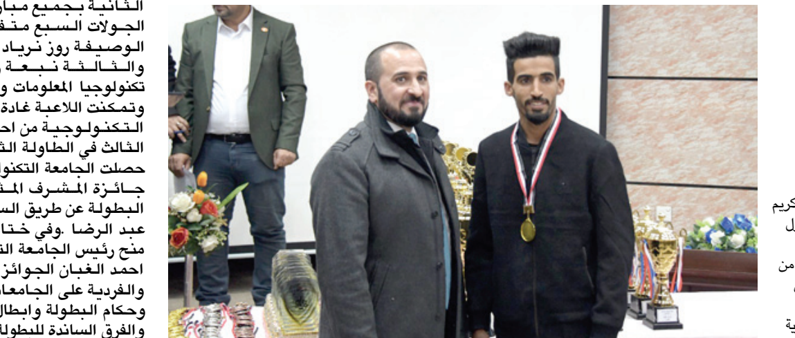
بطولة: تكريم الفائز الأول ببطولة الشطرنج من قبل رئيس الجامعة التكنولوجية

بغداد - ساري تحسين حصل طلاب وطالبات منتخب الجامعة التكنولوجية المركز الأول ضمن منافسات بطولة جامعات العراق بالشطرنج التي اختتمت على قاعة الجامعة الرسمية التي نظمها قسم النشاطات الطلابية في جهاز الاشراف والتقويم العلمي في وزارة التعليم العالي والبحث العلمي وباستضافة الجامعة. بغداد - ساري تحسين حصل طلاب وطالبات منتخب الجامعة التكنولوجية المركز الأول ضمن منافسات بطولة جامعات العراق بالشطرنج التي اختتمت على قاعة الجامعة الرسمية التي نظمها قسم النشاطات الطلابية في جهاز الاشراف والتقويم العلمي في وزارة التعليم العالي والبحث العلمي وباستضافة الجامعة.