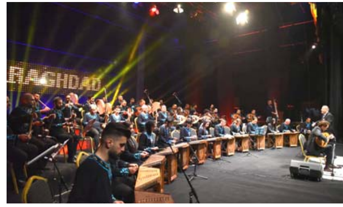
حفلة : لقطات من حفل ألق بغداد على المسرح الوطني عسة - زركار البرزنجي

على حافة الأمل تتصدر تسع مقطوعات موسيقية