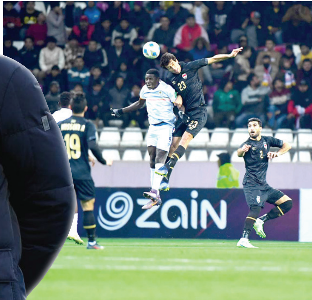
فوز: المنتخب الوطني يحقق فوزاً مغنوباً على نظيره الأوغندي