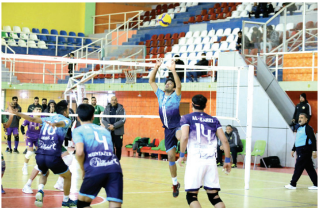
كرة: منافسات دوري كرة الطائرة الممتاز