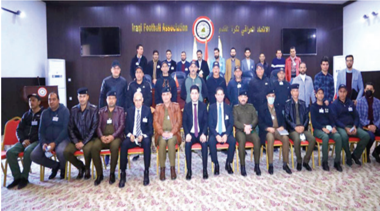
دورة، جانب من دورة لأمن الملاعب في اتحاد الكرة

وان إدارة الأمن والسلامة تمثل التوازن بين اللعب الجيد وإدارة اللعب، إلى جانب متطلبات الأمن والسلامة.