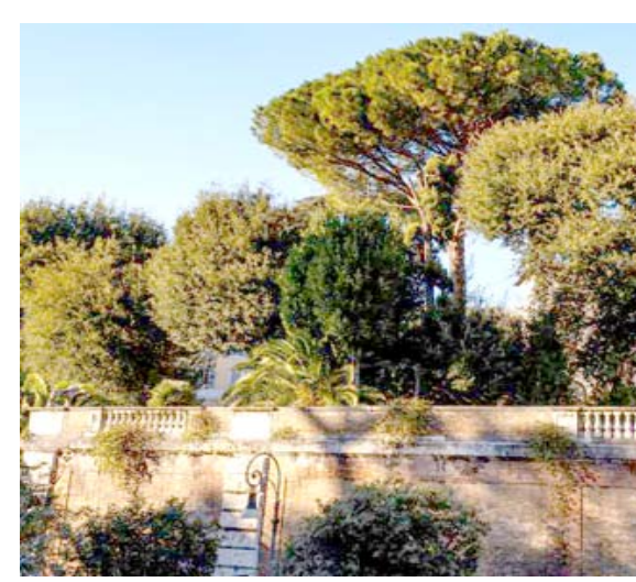
بقية الخبر على موقع (الزمان)

مداية في الكلية الوطنية للفنون الجميلة في أثينا قبل انتقاله إلى باريس، بلوحاته وأعماله بأسلوب الطباعة الحجرية (ليثوغرافيا) المعروضة في العالم أجمع، حيث يمكن رؤية النراج الذي كان يصافه الفنان حين كان طفلاً لدى التوجه إلى الشاطئ، والشعر الذي يظيره اليوناني كيرياكوس ميتسوتاكيس تحية مساء الأحد إلى الرسام والشاعر وأسمك جزيرته المفضلة كيا، الذي كان يظهر توازناً دائماً بين الواقعية والتجريد. وقال إن الكوس فاسيانوس ترك لنا إرثاً ثميناً لافتاً إلى أن الفنان المتعدد المواهب دعا أخيراً إلى مواجهة الضائحة الحالية بروح من التضامن والمحبة والتربية لأن أكبرية أعماله تكرم الإنسان. ويعرف فاسيانوس الذي درس