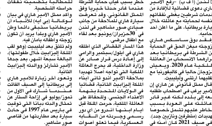
الأمير هاري يريد إستعادة الحق بحراسة الشرطة في بريطانيا

هذا المرار القضائي الذي أطلقه هاري في ايلول/سبتمبر والرامي إلى إعادة درس قرار صادر عن وزارة الداخلية، قد يجرح العائلة الملكية التي تواجه أصلاً تهديداً ملاحقة الأمير أندو ثاني أبناء الملكة إليزابيث الثانية، قضائياً في الولايات المتحدة بتهمته الاعتداء الجنسي، والحفاظ على العائلة الملكية، حرمت الملكة قبل أيام ابنها أندو من أي دور رسمي وجردته من لقبه العسكري، فيما تعلقوا أصوات