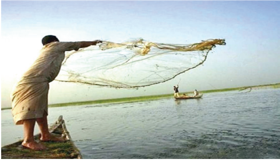
بحيرة: صيادون يزلون الهنة في بحيرة حميرين

4 اشخاص بينهم عقيد في الداخلية من قبل داعش ومن ثم استنهادهم فيما بعد في جريمة مستترة . واشار الى ان (الحظر اجراء وقائي امنى يهدف لمنع حصول اي مكروه لاي مدني خاصة وان بعض الطواقم لا تلتزم بالاطر الامنية وتجتبه الى عمق مناطق نائية وبعيدة عن نقاط المراقبة ما يجعلها امام خطر الخلايا الارهابية المختبئة في المناطق البعيدة).