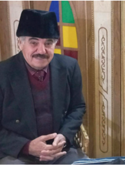
متحف: حوار مع مدير المتحف المتجول

حسب رأيك هل نستطيع اعادة الآثار المسروقة وعرضها في المتاحف العراقية ؟ -من الصعب جداً ارجاعها لان تم تسليمها عبر اتفاقيات جائرة ومتعاقد عليها في غفلة من الزمن وعندما كان الوعي غائبا عن الشعب العراقي والحكومات القديمة في العهد الملكي ولكن من المُستفرض على هذه المتاحف العالمية التي تعرض التراث العراقي تخرج نسبة من الأرباح للعراق ومن المحزن ومع شديد الأسف ان الفرد العراقي المغترب في الدول الأوربية يدفع تذاكر الدخول لمشاهدة اثار وتراث حضارته ولا يوجد متحف في العالم خالي من التراث والبصمة العراقية لان العراق اول حضارة في العالم أما في خصوص المسروقة هناك حملات اطلقتها امريكا وهدفها استرجاع الآثار المسروقة الى العراق .