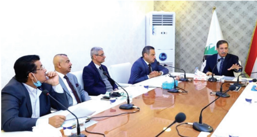
اجتماع: وكيل وزارة الصناعة خلال اجتمع

بغداد - الزمان قامت هيئة البحث والتطوير الصناعي التابعة لوزارة الصناعة والمعادن ومن خلال مركز بحوث وإنتاج الأدوية البيطرية باستخدام مُستخلص أوراق نبات اللهانة للحصول على مادة الانثوسيانين التي اثبتت فعاليتها البيولوجية على انواع من البكتريا وأنواع من الفطريات وقال بيان تلقته (الزمان) امس ان (النتائج الأولية اعطت فعالية تحييطية عالية جداً مُقارنة بالمضادات الحيوية القياسية بهدف استثمارها في إنتاج تركيبات دوائية مختلفة وباشكال صيدلانية عِدّة كما وسيتم