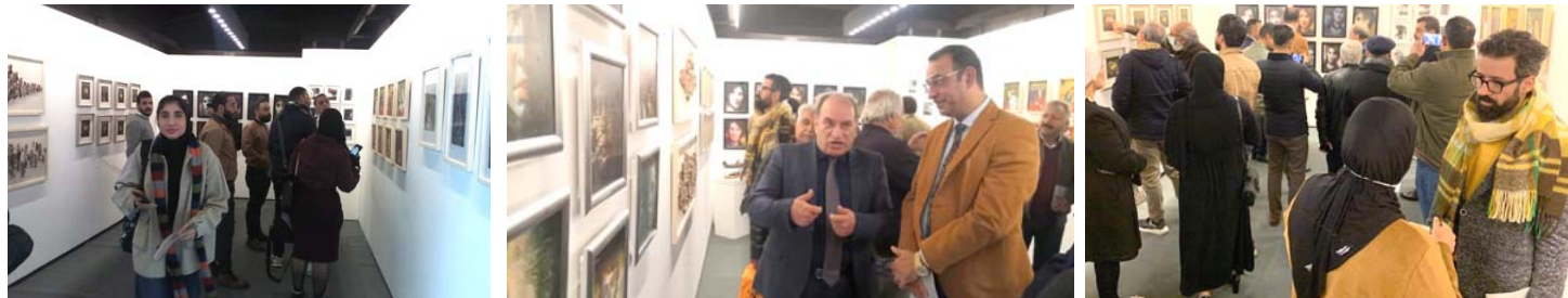
معرض؛ لقطات من افتتاح معرض (تواصل عبر العصور) في قاعة برونز