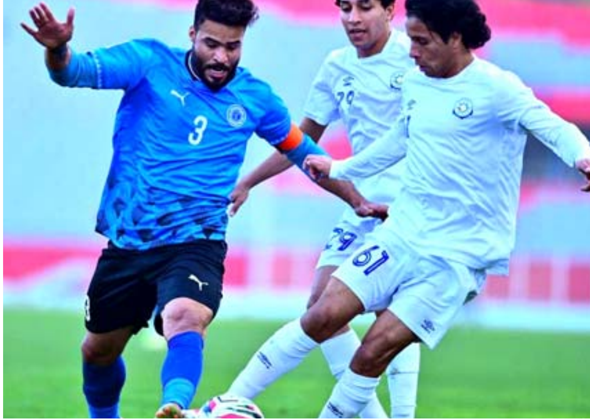
مواجهات: إحدى مواجهات الدوري الممتاز

مواجهات عندما يلتقي زاخو ونفط ميسان والنفط وسمراء والإمامة والطلبة والكهرباء والميناء والشرطة والديوانية وبها يسدل الستار على المرحلة الأولى والذهاب لمراجعة مبارياته لنوروز كان الامانة متراجعا ثلاثة مواقع وتجري غد الأحد خمس