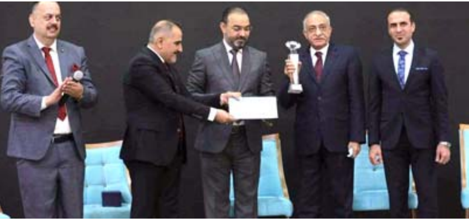
إحتفالية: جانب من إحتفالية المسار الرقمي

بغداد - الزمان يطبق مجلس إدارة المسار الرقمي العراقي برنامجاً يهدف إلى تطوير مهارات الشباب في المجال الرقمي، والذي يحمل شعار التحول الرقمي، والذي يتمثل بإحداث