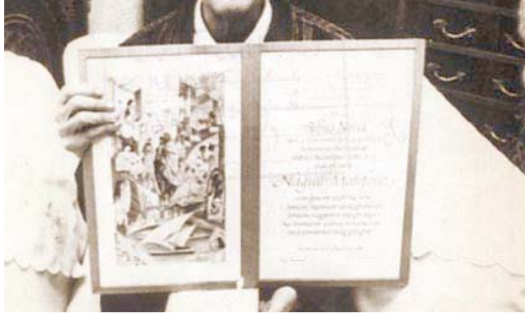
ميديالية : الأديب نجيب محفوظ يحمل شهادة نوبل في الآداب والميدالية الذهبية

في احتدام الجدل بين الأوساط الدينية بان محفوظ يقصد بالجلواي الذات الالهية لذا فكروا الكاتب ومنعوا نشر الرواية ، وتعرض لحادثة اغتيال فاشلة في 14 تموز 1994 من جانب أنصار التيار الديني المتطرف . وحسب اعتقادي الفكري وقرءاتي المتعددة للرواية وفي أزمته مختلفة: أرى أن محفوظ يقصد بالجلال رمزياً بالحكومات المستبدة الذين حكموا مصر الفرعونية والمماليك والأتراك والأسرة الفاروقية وعساكر انقلاب نمون، أما الأخوة عباس وجليل ورضوان -عدا انريس -يمتلون الطبقة الضعيفة والمستلبة في المجتمع المصري . انتهج فيها أسلوباً رمزياً يختلف عن أسلوبه الواقعي ، فهو ينحو في هذه الرواية جاهداً على إبراز القيم الإنسانية التي نادى بها الأنبياء كالحمد والحق والسعادة الروحية ، وربما اعتبرته نقداً مبطناً لفضح ممارسات عساكر الثورة والنظام الإحتكالي الذي كان قائماً . وعلى العموم كانت أكثر جدلاً من حيث المضمون بين الأوساط الدينية بالذات ، حاول الكاتب أن يصور للقرءاء والمحدثين مدى الظلم الذي لحق بهم وبالبنشيرية عموماً منذ طرد آدم من الجنة وحتى اليوم حيث الأشرار يعيشون فساداً في الأرض ويستبدون