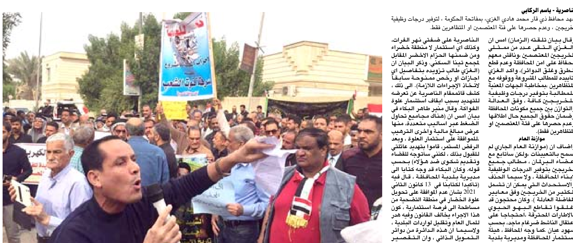
الناصرة - باسم الزكابي تعهد محافظ ذي قار محمد هادي الغزي، بفتاحة الحكومة، لتوفير درجات وظيفية للخريجين، وعدم حصرها على فئة المعتمدين أو المتظاهرين فقط.

وقال بيان تلقته (الزمان) اسم ان (الغزّي السّقى عدد من ممسلي الخريجين المعتمدين، وناقش معهم الحفاظ على أمن المحافظة وعدم قطع الطرق وغلّق الدوائر)، وأكد الغزّي (تأنيده للمطالب المشروعة ووقوفه مع المظاهرين، بمخاطبة الجهات المعنية للمطالبية بتوفير درجات وظيفية للخريجين كافة، وفق العدالة والتوازن بين جميع مكونات المحافظة وضمان حقوق الجميع حال اطلاقها وعدم حصرها على فئة المعتمدين أو المظاهرين فقط).