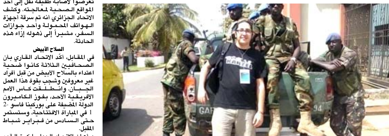
أحد الصحفيين الجزائريين

□ ليبرفيل - (أ ف ب): تعرّض 3 صحفيين جزائريين يقومون بتغطية فعاليات كأس الأمم الأفريقية لكرة القدم في الكامبيرون، لاعتداء بالأسلحة البيضاء في دولا وأصيب أحدهم بجروح خطيرة، كما أعلن الاتحاد الإفريقي لكرة القدم.