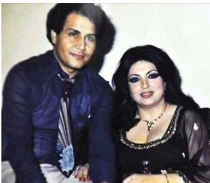
لقطة تعود لسنوات السبعينات تجمع المطرب سعدون جابر والمطربة اللبنانية سميرة توفيق.