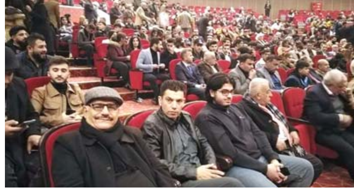
مسرحةيات : مشاهد من عروض مهرجان كركوك المسرحي