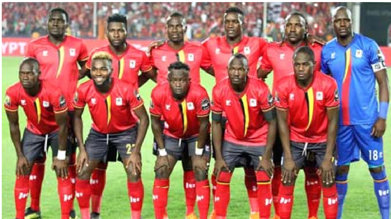
كرة: منتخب اوغندا بكرة القدم