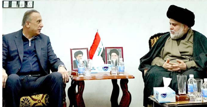
ضيفه : رئيس الوزراء يجل ضيفاً على مائدة رئيس التيار الصدري

مشكلة الماء والجاري، والربط بالخط السريع وطريق الحج البري). واجرى الكاظمي، زيارة إلى مشروع ناظم أبو صخير، الذي تنقذه وزارة الموارد المائية وتنفذ الكاظمي (سير) الأعمال فيه، واطلع على اهم المشكلات التي تواجه سير تنفيذ المشروع، ووجه معالجتها، واطلع البيان ان (رئيس الوزراء تفقد أيضاً مستشفى النجف، كما اطلع