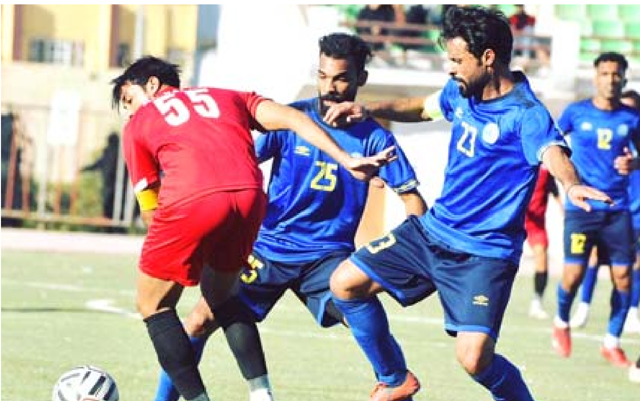
انتهاء: المرحلة الاولى لدوري الدرجة الاولى تنتهي بنجاح

بغداد- الزمان يستوعبه ملعب مباراته مع كربلاء ما دعا الحكم الى ايقاف بعدنا انتهى الشوط الاول بتعادلهما من دون اهداف ومطلوب من الادارة والمدير الفني تقييم منافسات المرحلة السابعة والوقوف عند المشاكل والاهم رعم مسؤوف المشافكل للدخول بقوة المنافسات القادمة كونها من تحدد مصير التاهل للفريق واحد مباشرة للممتاز ولإزال البحرى ليس بعيد عن التلافي المتقدم 17 الآخر الذي اهدر عدد من النقاط في مباريات كان بمقدوره ان يحسمها حيث خسارته من المتأخر الشرفقات ويبتعد عن المتصدر بسبع نقاط ومطلوب معالجة الأمور قبل ان تتضاعف ويبتعد بعد.