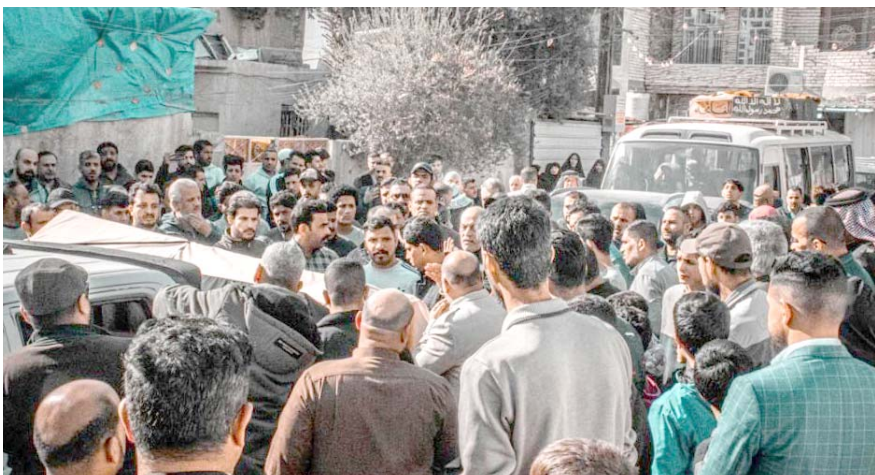
بغداد - الزمان

شيع اهالي محافظة بابل امس، جثامين شهداء مجزرة ناحية جبلة التي راح ضحيتها 20 شخصاً من عائلة واحدة غالبيتهم اطفال. واكد شهود عيان ان (اهالي الناحية، شيعوا جثامين شهداء مجزرة جبلة الى مزارعهم (الخبر)، وكان رئيس الوزراء مصطفى الكاظمي قد شارك قبل يومين بمجلس عزاء الشهداء، كما زار موقع الجريمة في الناحية. وفتحت الحكومة في وقت سابق تحقيقاً عالي المستوى بالجريمة التي شهدتها المحافظة وراح ضحيتها 20 شخصاً من أسرة واحدة، نتجته خلاف عائلي، واران القضاء (44 منهم بينهم ضباط بالحادثة، حيث جرى تصديق اقوالهم بالاعتراف، والقياهم بهم المنزل بناء على معلومات مضللة)، كما شيع اهالي التحالف في منطقة الحالف، امس جثامين ضحايا الهجوم المسلح الذي استهدف عائلة منتسب بالحشد الشعبي مع اطفاله، الى مزارعهم (الخبر)، فيما وجهت الحكومة بتشكيل