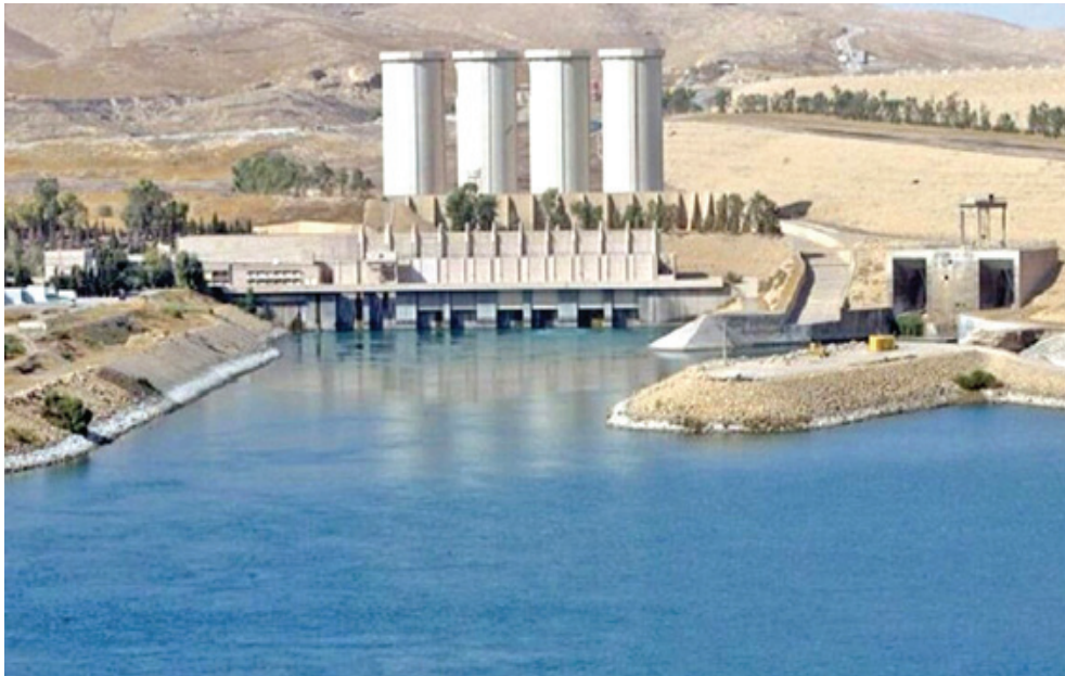
سده جانب من سد الموصل