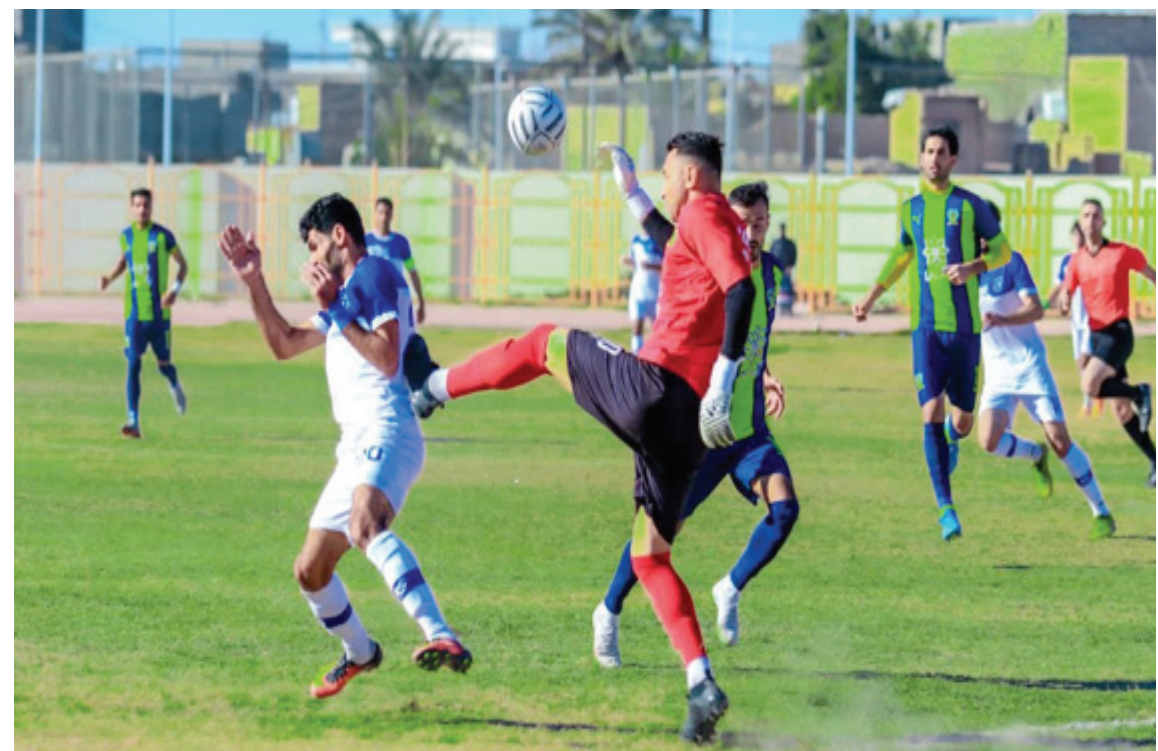
دوري : احدى مواجهات دوري الدرجة الاولى بكرة القدم

التي منحت صدارة الصعود للمجموعة الاولى عندما تقدم بسرعة متفوقا على اقرانه في اي ملعب والسيطرة على الامور وازاحة دهبك في الدور الاخير بفارق نقطة مستقيدا من خدمة الرمادي بتعادله مع الوصيف ونجح في تحقيق