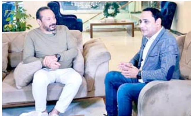
علي الحجار في حلقة من البرنامج صورت في بغداد