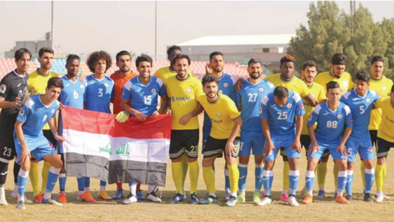
علم: فريقا القاسم واربيل ويرغان العلم العراقي

الترتيب ويستقبل بابل منمخها المتأخر قبل الاخير ويضيف ديالي السادس فريق فريق الحسين مع المبتذل غاز الشمال.