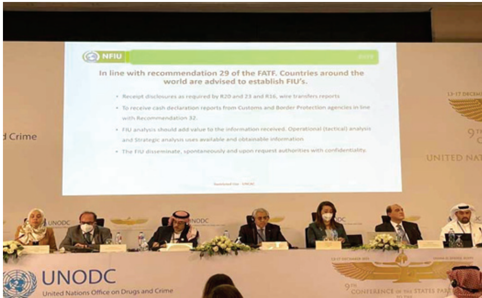
مؤتمراً القاهرة تحضن مؤتمراً النزاهة

الفساد في العراق، وتحسين القدرة والإطار القانوني لإجراء التقاضي التجاري، وتهيئة مناخ من الدعم في البرلمان لمكافحة الفساد، وتعزيز نظام القضاء التجاري، وإشراك المجتمع المدني والإعلام والمواطنين في حوار بناء، بغية تحقيق الإصلاح في مكافحة الفساد، مبيّناً أن (مشروع) بناء الثقة الذي أطلقه بالتعاون مع المكتب الإقليمي التابع للبرنامج، الذي يهدف إلى بناء الثقة بين المواطن والحكومة، ودعم النزاهة الوطنية للزنازة ومكافحة الفساد، العاملين في الأجهزة الرقابية من خلال الدورات الماضية للمؤتمراً من