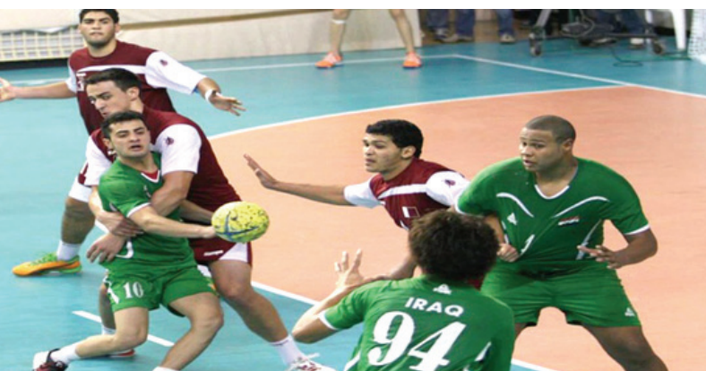
منتخب، مباراة للمنتخب الوطني بكرة اليد

ال 22 من الشهر الحالي. وأضاف الاعرجي ان المنتخب سيقيم معسكراً خارجياً تحضنه العاصمة الإيرانية طهران للفترة من 22 ويستمر حتى 30من الشهر الحالي، مشيراً، الى ان المعسكر سيضمّن إجراء مباراتين تجريبيتين مع المنتخب الوطني الإيراني ومنتخب الششاب يومي 25 و27من الشهر الحالي، بالإضافة إلى اربع مباريات مع الاندية المتقدمة في الدوري الإيراني.