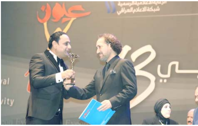
تكريم مقدم (هوليود الشرق) في مهرجان عيون