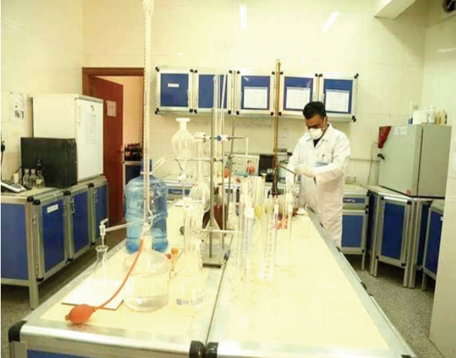
التي تقوم ببيع وتداول البراميل الكيميائية الملوثة الفارغة في الأسواق المحلية في قضائي الجبايش والقوقود.