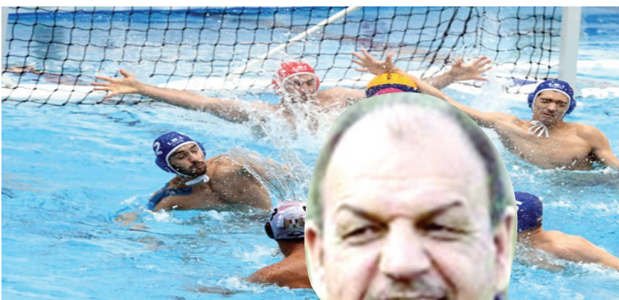
بطولة: احدي منافسات بطولة كرة الماء

وبين ان الاتحاد شارك بالبطولة العربية للمرجى القصير التي اقيمت في مدينة ابو ظبي وتمكن لاعبونا من تحقيق سبعة اوسمة ملونة. ولفت الخرزجي الى ان الاتحاد