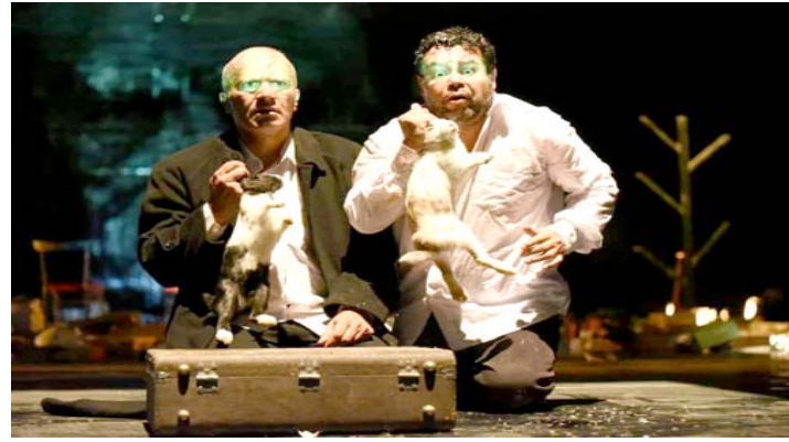
إبداع، مشاهد من مسرحية (يس كودو)

من الأرض والسماء معا واصوات الماكينات التي ملئت العرض في حين كانت الإضاءة حالة منسجمة وكانها لطخات رسام في بقع الضوء على الشكل المعروض. والموسيقى لغة و حوار متكاملين. ومن جميل الصدف كان جالسا بجوارني فنانين أوروبيين اجانب وارى تأثيرهم بالعرض من خلال همهماتهم وانفاسهم كذلك التصفيق الكبير بعد انتهاء العرض فعلا كان عرضا على مستوى عالمي ونحن المسرحيون فعلا قد وجدنا مكانا