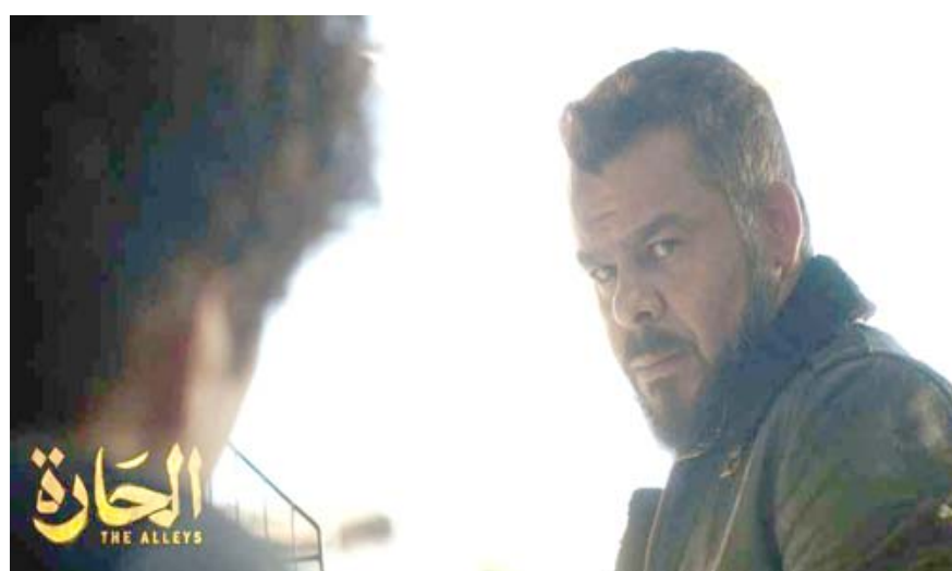
السينمائية والتلفزيونية السعودية على فتح دور السينما، انطلق في السعودية اسم الأنثى إلى مهرجان سينمائي ضخم، تدعمه حكومة المملكة السابعة لبناء صناعة ترقيعية جديدة وتعزيز أذرع قوتها الناعمة في خضم حملة الافتتاح الأخيرة وتخطت الدورة الافتتاحية لمهرجان البحر الأحمر السينمائي في مدينة جدة الساحلية في غرب البلاد بين 6 و15 كانون الأول، وتشمل 138 فيلماً طويلاً وقصيراً من 67 بلداً و34 لغة، وتنتقل عادة تنظيم أول سباق فورمولا واحد في المملكة ومن بين الأعمال المشاركة في المهرجان، الفيلم الأردني الحارة للمخرج باسل غندور الذي أشار إعجاب النقاد، إضافة إلى أفلام غير عربية بينها سيرانو لجو رايت و83 عن فوز الهند بكاس العالم في الكريكت سنة 1983. ويكرم المهرجان أيضاً المخرجة والمتنجة هيفاء المنصور،

بالسينما في 2018 كانت الصناعة تعمل تحت الأرض، لم يكن هناك إمكانية للتصوير أو الحصول على تمويل. الأمور كانت تعتمد على الطاقة الفردية. ولطالما اقتصرت صناعة السينما السعودية المحلية على محاولات مستقلة دون دعم حكومي أو رسمي، ويوجد في المملكة اليوم أكثر من 39 صالة سينما بعدد 385 تشغّلها خمس شركات. ورغم الإنتاج السعودي الكبير، تحظى الأفلام المصرية والإنجليزية بإقبال كبير في دور العرض والأسبوع الماضي، أطلقت هيئة الأفلام السعودية استراتيجية