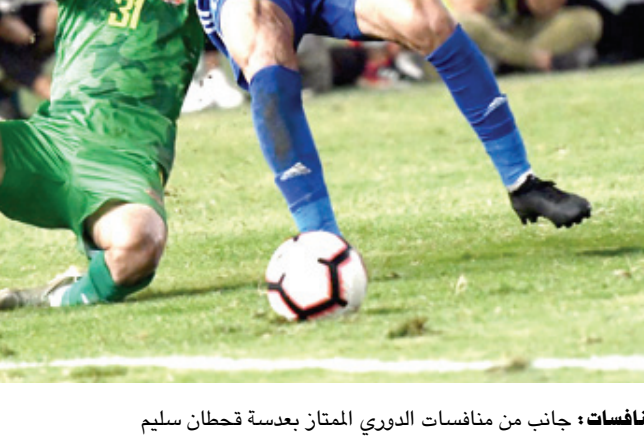
منافسات: جانب من منافسات الدوري الممتاز

سامراء والميناء ويبحث كل من سامراء والميناء ويعد سلسلة نكسات ونزف النقاط والبحث عن الفوز الاول وتخلصهما من البقاء في المنطقة المظلمة بعد مغادرتها لبطولة الكاس لكن الامر المهم يتعلق بنتائج الدوري وتحدياتها التي اخذت تظهر بقوة بوجه الميناء بعدما رفضت عناصره حضور الوحدات التدريبية للمطالبة برواتبهم الشهرية فضلا عن غضب جمهورهم لاستمرار السقوط في عقر الدار وتراجع المستوى والنتائج التي اريكت المشهد فيما يسعى