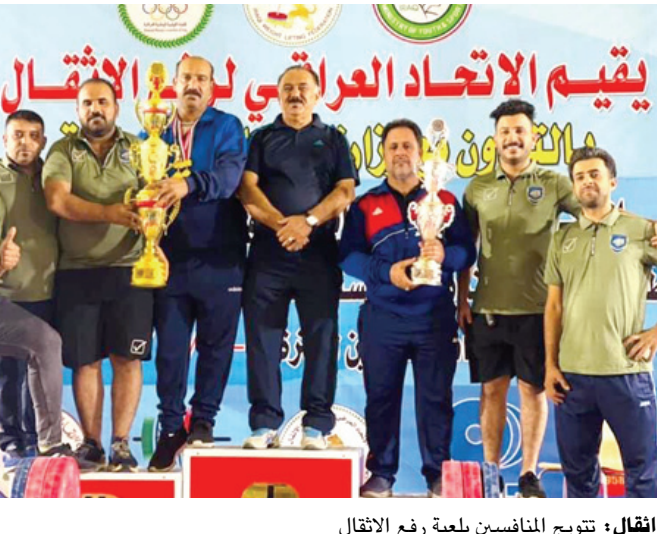
أثقال: تتويج المنافسين بلعبة رفع الأثقال