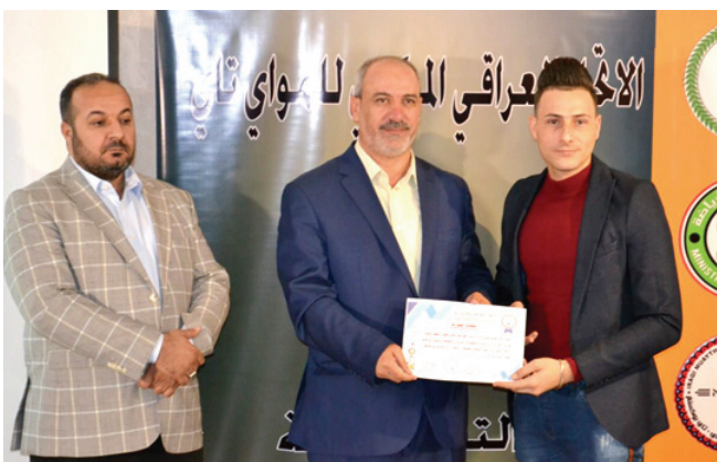
دورة: تكريم المشاركين في دورة الموائ تاي

بغداد- الزمان اختتمت الدورة التدريبية والتحكيمية ومكافحة المنشطات التي اقامها الاتحاد العراقي للموائ تاي في محافظة كربلاء المقدسة بمشاركة ثمانين حكماً ومدرباً من مختلف محافظات العراق. واستمرت محاضرات الدورة على مدار اربعة ايام حيث تسلم المدربون والحكام في ختامها شهادات مشاركتهم. وانشاد رئيس الاتحاد العراقي للموائ تاي مصطفى جبار علك برعاية اللجنة الاولمبية الوطنية