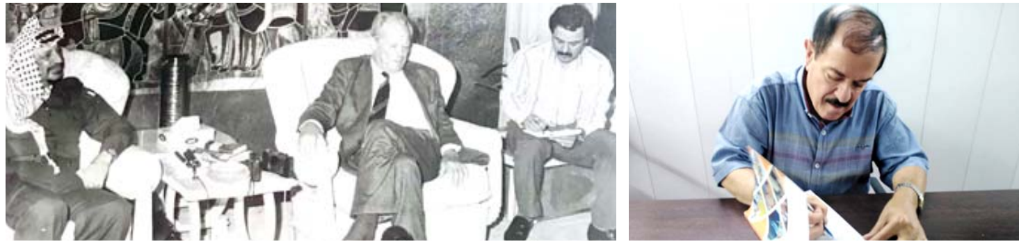
كتاب : صور كثيرة مع شخصيات متميزة يضمها كتاب (رحلة صحفية) لعلاء خليل ناصر