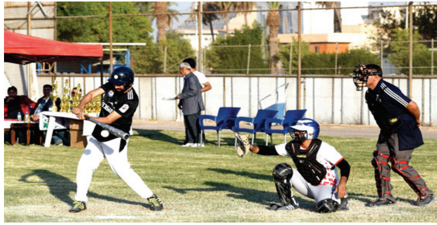
لعبة: إحدى جولات لعبة البيسبول

بغداد- الزمان حققت فرق ديالى والسليمانية والتعاون. الفوز ضمن حساب الدور الرابع من المرحلة الأولى لدوري كرة اليد الممتاز للموسم 2021-2022. وفاز فريق نادي ديالى على فريق نادي كربلاء بنتيجة 23 - 30 هدفاً في المباراة التي جرت في قاعة الراحل علي سلام. كما فاز فريق نادي التعاون على فريق نادي الخليج العربي بنتيجة 22 - 41 هدفاً في المباراة الثانية التي احتضنتها قاعة جامعة المعارف. وفي اللقاء