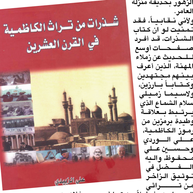
شذرات من تراث الكاظمية في القرن العشرين