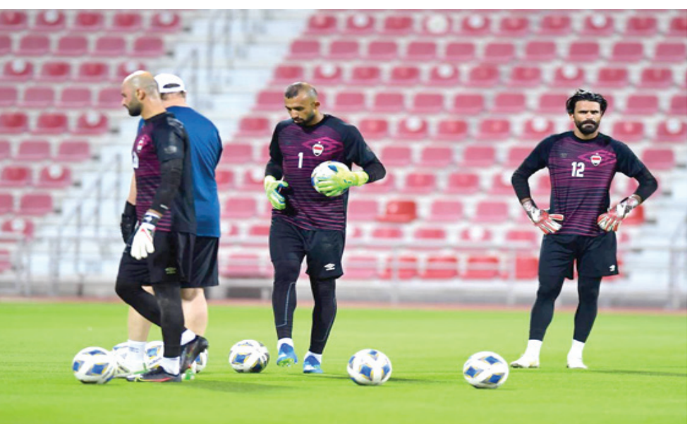
تدريبات المنتخب الوطني يجري وحداته التدريبية الأخيرة قبل مواجهة سوريا

الناصرية - باسم الركابي يعود المنتخب الوطني اليوم الخميس لخوض مباراته الخامسة والأخيرة من المرحلة الأولى من التصفيات المؤهلة لكأس لكرة القدم لعام المقبل في قطر أمام المنتخب السوري عند الساعة الثامنة مساءً في ملعب الغرافة وبحضور جماهيري للمرة الأولى.