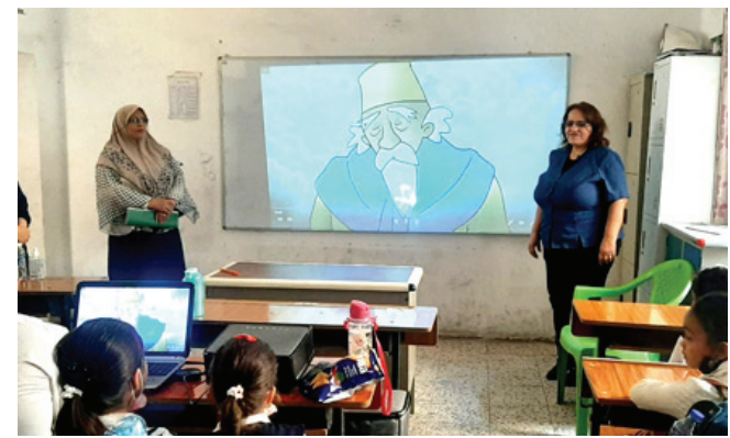
زيارة : مرشدة بيئية تزور مدرسة في بغداد

بغداد- قصي منذر بغداد - ميسون حسين الجبوري نظمت وزارة البيئة زيارات ميدانية إلى عدد من مدارس محافظة بغداد في جانب الكرخ ضمن حملتها التوعوية البيئية والصحية بين طلبة وتلاميذ المدارس للاطلاع على الواقع البيئي والدارس للاطلاع على الواقع البيئي