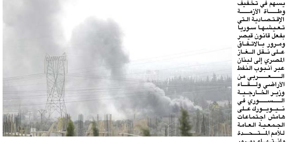
ضربة : الدخان يتصاعد من موقع في ريف دمشق اثر ضربة جوية اسرائيلية

دمشق) ، ( ف ب - اصيب جنديان سوريان بجروح جراء قصف إسرائيلي جديد استهدف موقعا في وسط وغرب سوريا، وفق نسا أقال مصدر رسمي السوري وقال مصدر عسكري، وفق ما نقلت وكالة الأنباء السورية الرسمية (سانا) امس انه (عند حوالي الساعة 05.16) 19.16 بتوقيت غرينتش من مساء اليوم نفذ العدو الإسرائيلي عدواناً جدياً من اتجاه شمال بيروت مستهدفاً بعض النقاط في المنطقة الوسطى والساحلية).