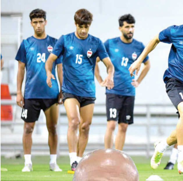
تدريب: وحدة تدريبية للمنتخب الوطني بالدرجة

لا يمكن التكهن بمباريات الكأس وسيقوم مصافي البصرة بتقديم مباراة تكتيكية لإيقاف قوة الصناعة الذي يمر بحالة متقدمة والباحث عن العودة بفوائد المهمة التي يامل البصريين كسبها. أربيل والرمادي ويعول جمهور فريق المثنى على التشكيل في تحقيق الظهور المبكر الأول لفريقهم ودعمه بالانصرار على نطف الجنوب لتأكيد بقائه في منافسات البطولة التي يسعى الضيوف الأطلحة باصحاب السدار واقساد مغامرتهم للانتقال للطور المقبل ويظهر مؤهل لذلك، يتطلع نوروز الذي يمر بوضع مقبول في الفترة الحالية عبر الظهور الأفضل في منافسات اليوم امام جمهوره الكبير عند استقبال ضيفه كرابلاء جيرانه الخفيف فنيا بوضوح وسيدخل ميدان اللعب بشعاع لايدل عن الفؤز للاستمرار في المنافسات لكن مهمته صعبة.