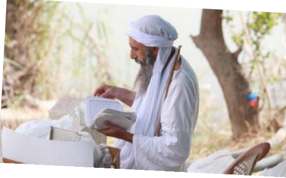
تعميد: رجال دين من الصابئة يمارسون طقوس التعميد في نهر دجلة

كل عام ويسميه الصابئة المنادئون هيمية الله الصغرى (هيمو هيمية) وهو نكري عودة الملاك جبريل وصعوده، وقد نزل إلى الأرض بأمر الله، ثم عاد إلى السماء مشيراً بأزهار الكروم وديانة الصابئة مريم من المعتقدات والاعتقادات المسيحية والفرسية، وفق تقرير لوكالة فرانس برس. وهم يتكلمون لغة تقليدية تعتبر مشتقة من اللغة الآرامية، ويعتبرون آدم نبيهم ويقدمون بوحنًا للمعمدان، وتعود جذورهم إلى ما قبل المسيحية بينما يعتقد باحثون أنهم مهذب وصل إلى بلاد الرافدين في القرن الثاني قبل الميلاد، والمندائية تختلف عن الديانات الأخرى، بأنها ليست تبشيرية، ولا تؤمن بذنوب أحد إليها، وتحرم الزواج من خارج الديانة، ومن بين طقوسها الصلاة، الصوم، والصدقة، والتعميد وهو أحد أهم أركان هذه الديانة. ويشترك اسم الصابئة من الفعل الآرامي (صبا) الذي يعني تعمد أو اصطبغ أو غطس في الماء، وهو ما يجري في طقوس التعميد الذي يدخل في الكثير من المناسبات لدى هذه الطائفة مثل الأعياد والزواج والوفاة.