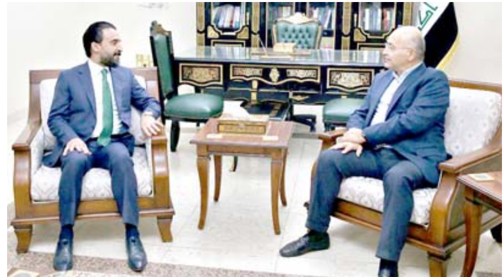
استقبال: رئيس الجمهورية برهم صالح خلال استقباله رئيس البرلمان السابق محمد الحلبيسي

للانتخابات، عدم ثبوت حصول أي تغيير في النتائج أو تزوير خلال إعادة عمليات العد والفرز التي شملت أكثر من 14 ألف محطة مختلطة 25 بالمئة من مجموع المحطات بعموم العراق. وقال عضو الفريق الإعلامي للمفوضية عماد جميل محسن إنه (لم يحدث أي تشكيك بالعملية الانتخابية بعد نهايتها ولم يتحدث أي طرف عن حدوث خروقات، لكن بعد ظهور النتائج الأولية ظهرت اعتراضات وتشكيك بالعملية الانتخابية من قبل اطراف منضرة من النتائج).