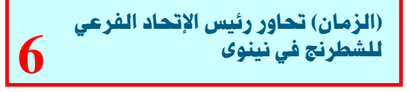
(الزمان) تحاور رئيس الاتحاد الفرعي للشطري في تينوي

تصدر امر تكليف حميد الأيزيرجاوي (الشطري) برئاسة جهاز الامن الوطني، خلفا لمجدي الغني الاسدي الذي تولى المنصب في تموز 2020، وسائل الاعلام ومواقع التواصل الاجتماعي، واكثت مصادر ان (رئيس الوزراء مصطفى