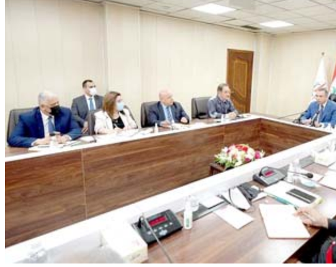
لقاء: رئيس الوزراء مصطفى الكاظمي خلال لقائه بالملك المقدم لوزارة الكهرباء

مستقبلية لتتويع مصادر الطاقة، والإسراع بإنشاء محطات الطاقة النظيفه من أفضل الشركات العالمية، وقد قطعنا شوطا كبيرا في هذا (السياق) ولغت الى ان (ترشيد الطاقة ظاهرة حضارية، فضلا عن أهمية تفعيل الجباية لضمان استمرارية