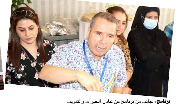
برنامج، جانب من برنامج عن تبادل الخبرات والتدريب

وقدراتهم في التقنيات المبتكرة مع الأنظمة المتعلقة بالثروة الحيوانية. هؤلاء المتدربين الإرشاديون يدعمون المشروع كمدرسين رائدين على مستوى المنطقة (TOT) وميسري مدارس الحقلية ومراقبة أنشطة المشروع. واثبت نجاح هذا النهج، ولا سيما إنشاء وياء COVID-19، وكذلك في فترات انعدام الأمن في منطقة المشروع الذي يمنع في كثير من الأحيان سهولة الوصول، ولهذا يمكن توسيع نطاقه في مكان آخر، مع تأكيد الدور المهم لخبريق الإرشاد في تنسيق ودعم ونقل الخبرات من خلال التدريب بين النظراء في الإرشاد الزراعي بشكل متواصل.