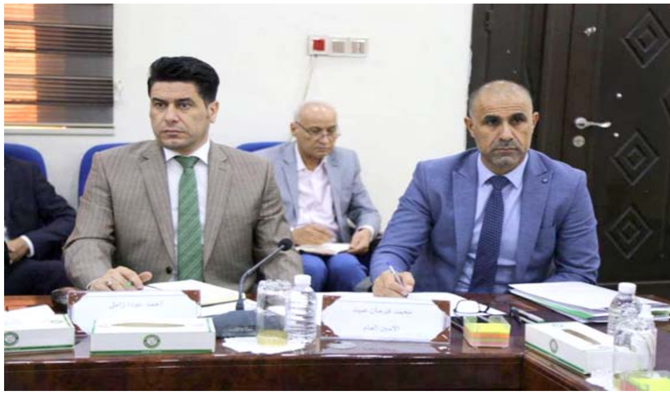
اجتماع: جانب من إجتماع أعضاء اتحاد كرة القدم

معلومات دقيقة في ضوءها يخرج بمقرراته بشأن السماح او الرفض لإقامة المباريات في ملاعبنا. من جانبه قال رئيس الاتحاد السابق عبد الخالق مسعود إنه يحق للاتحاد العراقي لكرة القدم رفع شكوى ضد الاتحاد الدولي محكمة كاس الدولية بسبب منعه للعراق اللعب على أرضه وأصدرت قاتلاً، لكن لا تعرف هل سيكسب الاتحاد العراقي القضية ام لا. وأشار مسعود، الى ان الشكوى لاتنفع الا ان، لأن الاتحاد العراقي قد تأخر برقع الشكوى، والمباراة لم يتبقى عليها سوى أيام . وكان درجال قد بحث مع رئيس الاتحاد الدولي جيانى انفانتينو، ملف رفع الحظر عن الملاعب العراقية واستضافة المباريات الرسمية عليها، وفق بيان صدر اسبوعاً عن وزارة الشباب والرياضة. وأشار البيان، إلى أن درجال، المتواجد حالياً في قطر لحضور نهائي كأس أمير قطر بين السد والريان عقد اجتماعاً مع رئيس الاتحاد الدولي لحسم ملف استضافة العراق للمباريات الدولية على أرضه ورفع الحظر عن الملاعب العراقية فضلاً عن