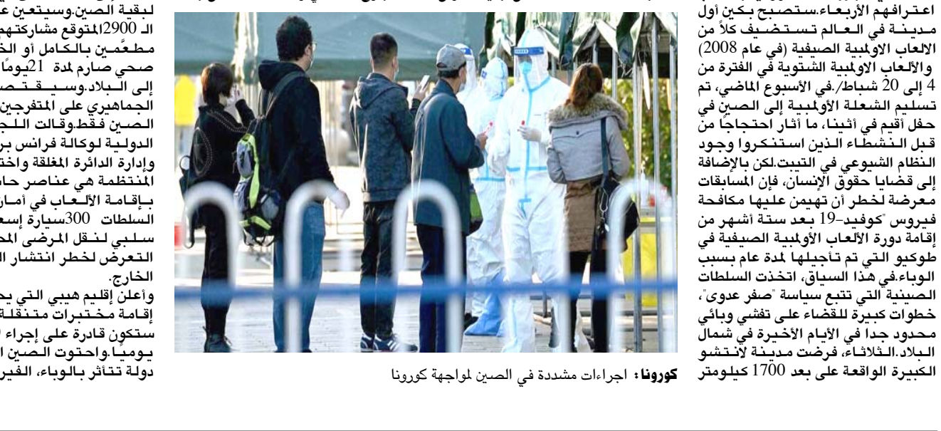
كورونا: إجراءات مشددة في الصين لمواجهة كورونا

لوسائل الإعلام أن الوباء هو التحدي الأول لإدارة الألعاب الشتوية، وعزز 12 إقليمياً، أي ثلث الأقاليم الصينية، إجراءات الوقاية بما في ذلك مدينة بكين، حيث تم إجلاء 20 حالة إصابة في الأسبوع الماضي، وتعهد تشانغ بان