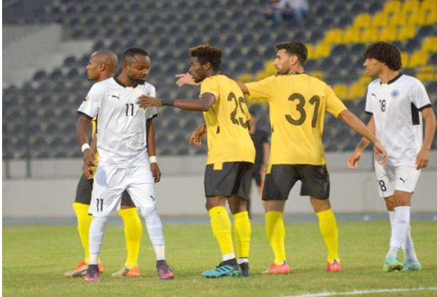
دوري: مواجهة الطلبة وأربيل في الدوري الممتاز

المضيف على عاملي الأرض والجمهور ويسعى الصناعات للفوز الثاني عندما يواجه الجنسية المتطلع إلى تقديم نفسه بصورة أفضل ويريد البشمركة باستقبال جيرانه نطف الشمال تحقيق النتيجة الفاتحة تلمعه والاستمرار بالصدارة بعد الفوز العريض على السمواء.